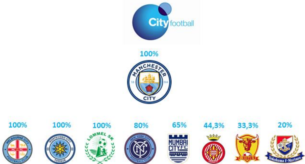
Figura 2. Organograma ilustrativo dos clubes integrantes do City Football Group .

Eis o organograma ilustrativo dos clubes que fazem parte do grupo, conforme a Figura 2, a seguir apresentada: