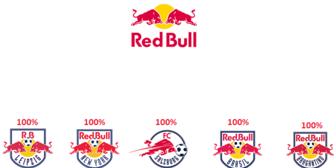
Figura 3. Organograma ilustrativo dos clubes integrantes do Red Bull .

Eis o organograma ilustrativo dos clubes que fazem parte do grupo, conforme a Figura 3, a seguir apresentada: