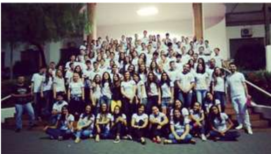
Figura 1. Alunos ingressantes do Cursinho DACA em 2015.

Durante o ano de 2015, sabendo-se dos cursos de eleição dos alunos, o cursinho DACA organizou atividades didáticas que visaram influenciar positivamente nas suas escolhas. A primeira delas, foi o projeto "Conhecendo a Unesp", projeto que teve como objetivo apresentar aos estudantes participantes do projeto, os campus e faculdades da Universidade Estadual Paulista "Júlio de Mesquita Filho", e principalmente os cursos oferecidos e seus enfoques. Já a "I Semana Universitária e das Profissões" foi organizada com o objetivo de permitir aos alunos contato com profissionais de diversas áreas e possibilitar um amadurecimento de suas escolhas.