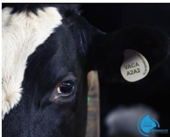
Figura 2: Exemplo de brinco homologado para identificação de vacas com genótipo A2A2. Adaptado de Regulamento Beba Mais Leite (2020).

O selo de certificação, criado em 2019 pelo Movimento Mais Leite, estabelece uma série de normas de diferenciação de produção, fiscalização de propriedades e laticínios, e rastreabilidade, como: brincos homologados; lotes e ordenha separada; tanques de estocagem exclusivos, bem como suas válvulas e conexões, evitando contrafluxo de leite de vacas não genotipadas; procedimentos de limpeza das instalações, equipamentos e utensílios (BEBA MAIS LEITE, 2020).