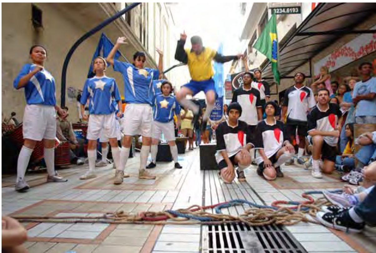
Imagem 3: Barbosinha Futebol Crubi em versão para a rua.

A carnavalização se manifesta a partir do tratamento futebolístico, da acidez e do sarcasmo. O TUOV intervém no cotidiano, tanto pela forma, como pelo conteúdo da apresentação de suas peças.