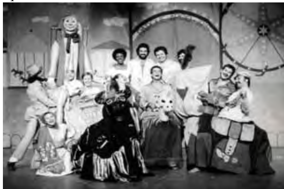
Imagem 6: Bumba, meu queixada , elenco de 1978.

Funcionalidade de adereços e figurinos garantem comunicação com o público.