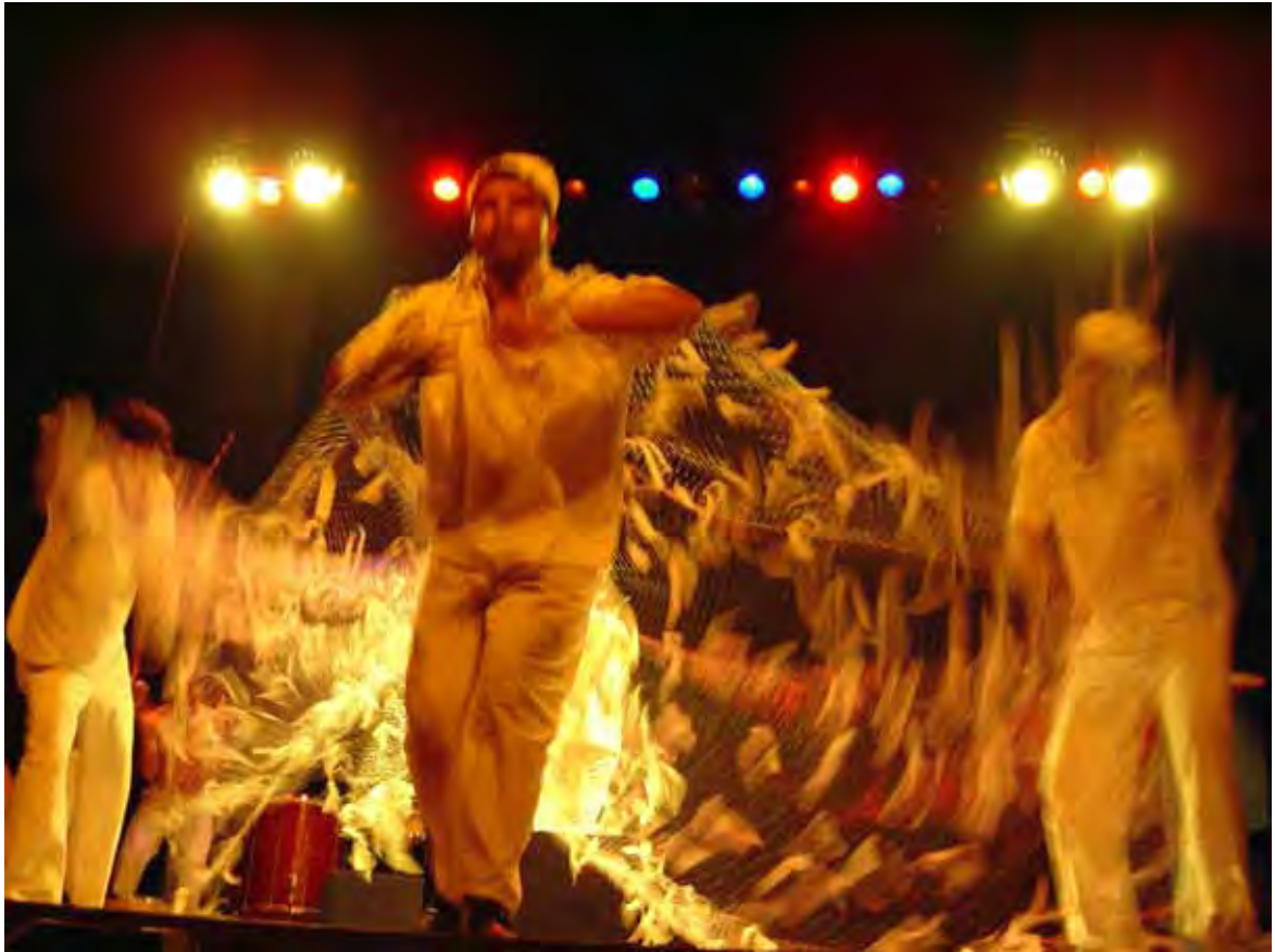
Imagem 4: João Cândido do Brasil: a Revolta da Chibata .

Valorizar o trabalhador e as manifestações tradicionais, em prol da arte popular, é pressuposto da obra humanística do TUOV.