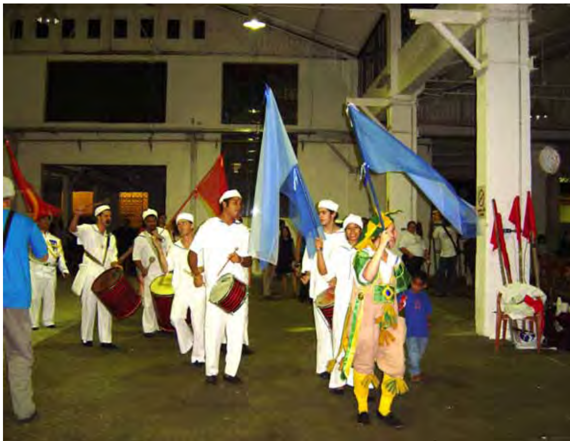
Imagem 2: Elenco de João Cândido do Brasil: a Revolta da Chibata , no Abrigo Boracéia, em São Paulo, que atende pessoas em “situação de rua”.

A versatilidade dos espetáculos permite apresentações em locais alternativos. A forma de cortejo popular garante a convocação do público para as apresentações, com intervenções populares características: instrumentos, canto, cores e interatividade.