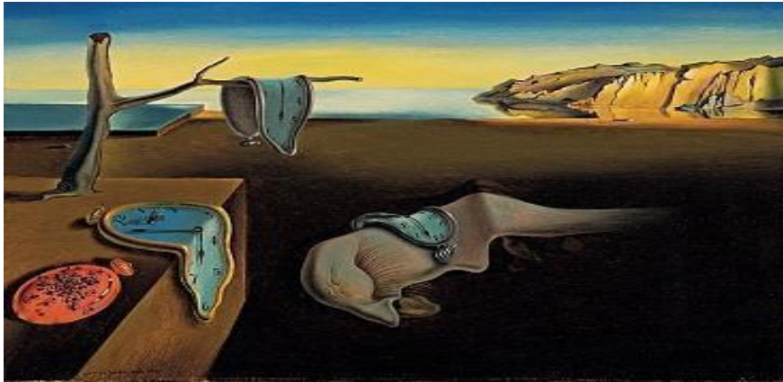
Figura 1: "A persistência da memória" - Salvador Dali

O quadro "A persistência da memória" de Dalí é uma obra surrealista que retrata um ambiente distorcido e irreconhecível, no qual objetos e formas têm uma aparência derretida e fluida. Gibson (2014) afirma que o tempo não é uma entidade física objetiva, mas sim uma propriedade emergente da estrutura dinâmica do mundo percebido. Neste sentido, coerente com a ideia proposta no quadro. Isso significa que a percepção do tempo depende da capacidade do organismo de detectar mudanças significativas no ambiente, e que os organismos podem ter percepções de tempo diferentes.