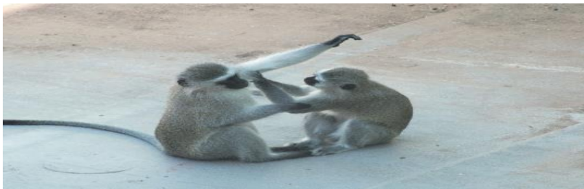
Figura 2 - Macacos Vervet em interação, em Gaborone, Botsuana.

Na teoria da atividade, as atividades ocorrem dentro de um sistema de relações em que as ações influenciam e são influenciadas pelo ambiente. Assim, elas não podem ser compreendidas isoladamente, mas apenas em seu contexto mais amplo, incluindo o objetivo da atividade, as ferramentas e tecnologias utilizadas, os papéis dos participantes e as condições materiais e no caso dos humanos culturais em que a atividade ocorre.