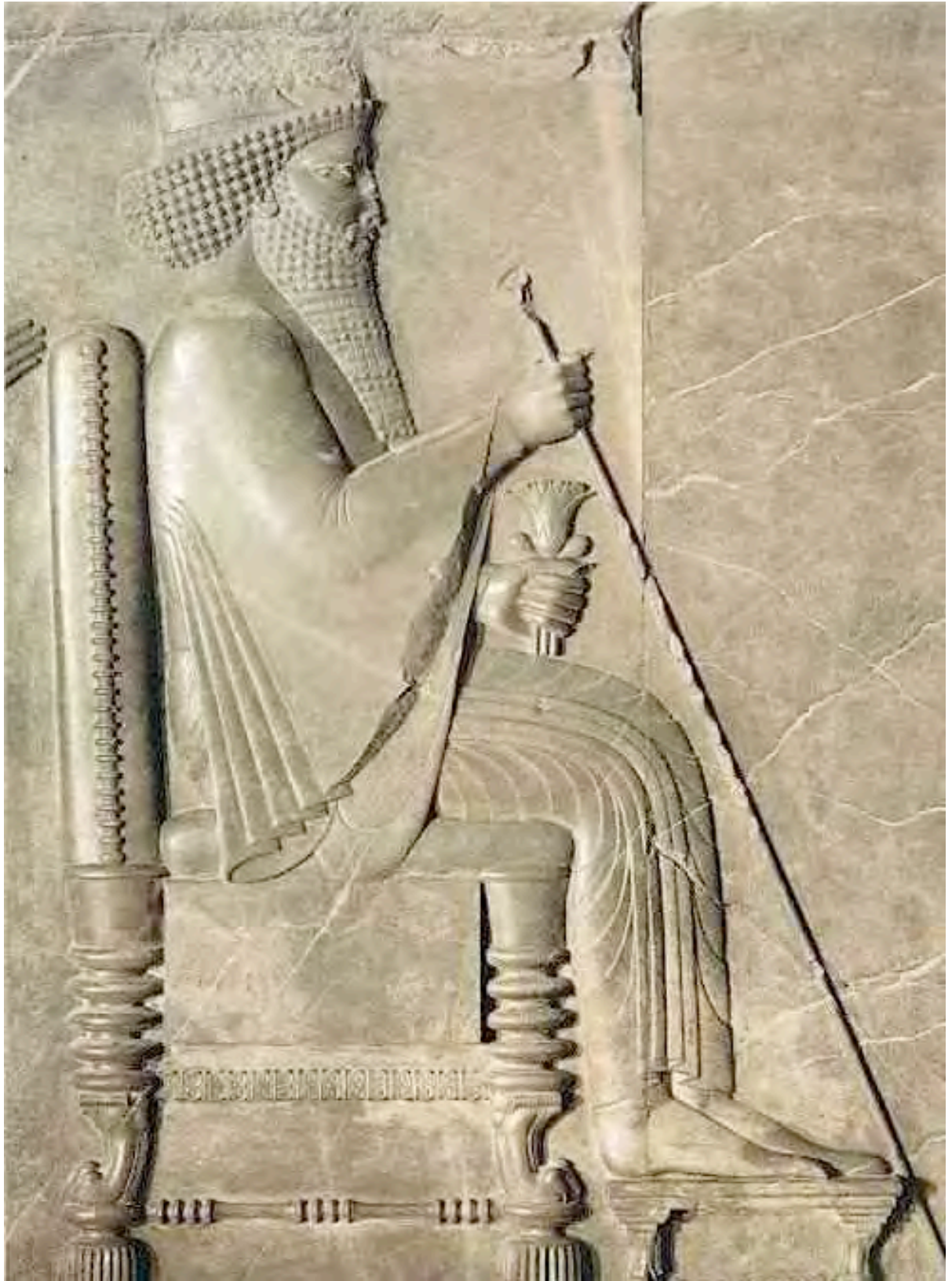
Treasure Relief. Xerxes I The Great . Persepolis, 2009. Color. 17,5 x 24,8 cm.