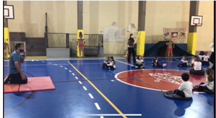
Brincadeira Indígena "Gavião e os passarinhos"