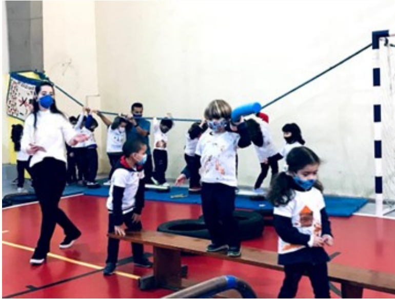
Jogando uma "lança"