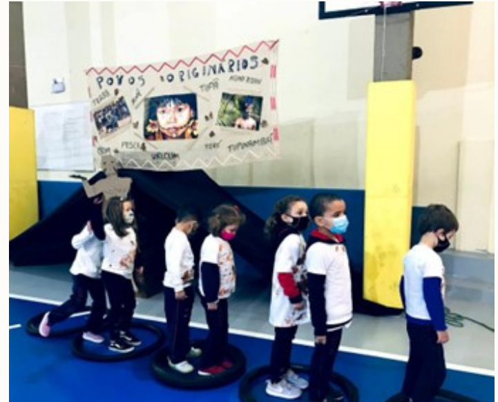
Atravessando o "rio"