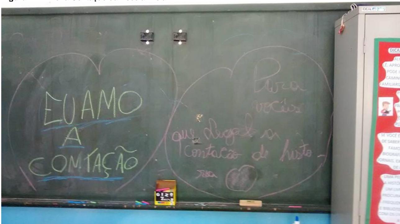
Figura 2: Lousa escrita pelos alunos após a contação.