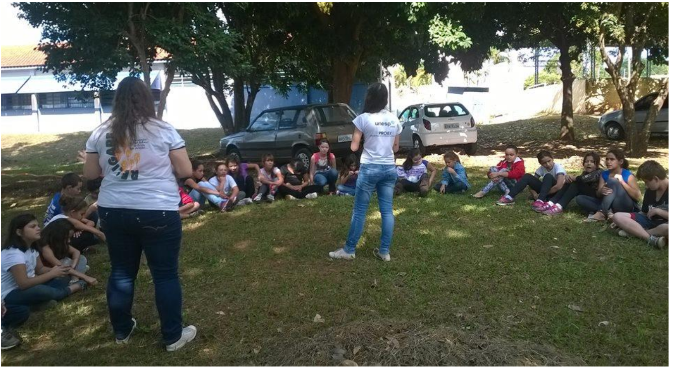
Figura 3: Contação na área verde da escola