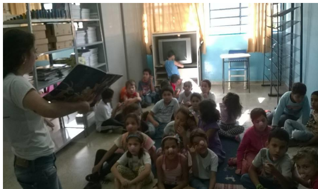
Figura 4: Contação na sala de leitura

mudança no comportamento em sala e no interesse pelas atividades propostas. Houve melhora na concentração e também na oralidade. Percebemos também que, em relação ao conhecimento cognitivo, muito tem acrescentado, que o repertório dos alunos está cada dia mais amplo e que eles o utilizam em sala de aula, por essas razões, eles se sentem valorizados. Também percebemos que o corpo docente tem encontrado maior facilidade para trabalhar atividades de leitura em sala, pois os alunos já estão familiarizados com diferente obras, estilos, temas e gêneros. Fica claro que se trata de um projeto de qualidade e sua eficácia pode ser percebida nos amplos e significativos resultados em um tempo relativamente curto na escola. Há contentamento por parte direção com os resultados e é possível afirmar que o projeto ainda pode apresentar grandes evoluções e melhorias ainda na rotina escolar até o final do ano letivo.