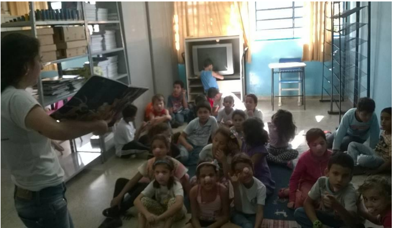
Figura 4: Contação na sala de leitura