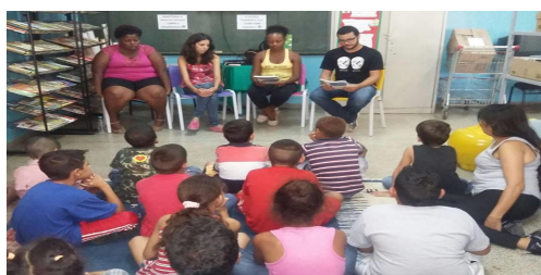
Figura 1: Primeira Contação da Escola Nísia

A cada nova contação, as crianças adquirem ferramentas para construir suas percepções de mundo. As leituras são trabalhadas de forma lúdica, convidando a criança a exercitar sua criatividade, expressar seus sentimentos e opiniões, percebendo nos livros o espaço de voz e de troca existente onde se cria a interpretação. O novo conteúdo apresentado às crianças pretende também acrescentar novas palavras a seu vocabulário e favorecer a sociabilidade. Para os integrantes do projeto ele se faz interessante, pois viabiliza a produção de material científico acerca da formação do leitor baseada no conteúdo teórico estudado nas reuniões semanais de preparação, somado aos dados colhidos em campo na atividade prática do contar. Para refletir acerca do projeto, realizou-se uma pesquisa de campo que considerou, como objeto de estudo, os depoimentos dos professores que acompanham as nossas crianças todos os dias e por isso são capazes de aferir os impactos.