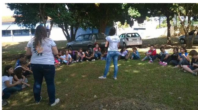
Figura 3: Contação na área verde da escola