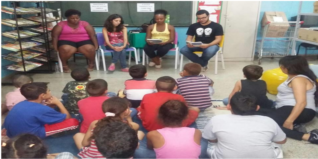
Figura 1: Primeira Contação da Escola Nísia