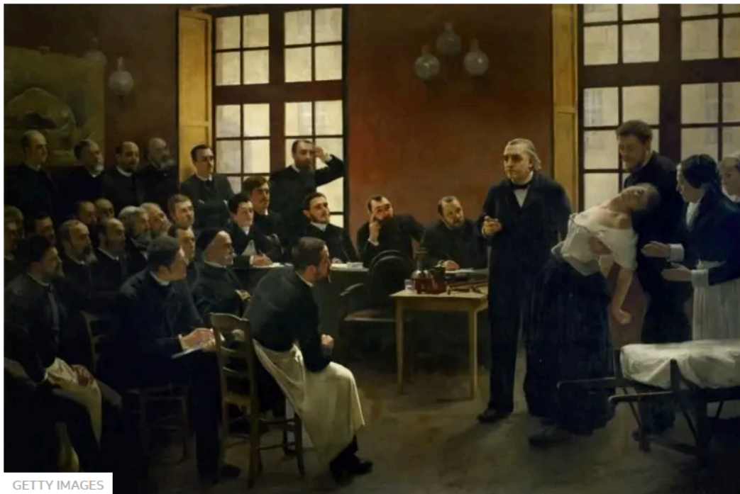
Figura 2 - Une leçon clinique à la Salpêtrière