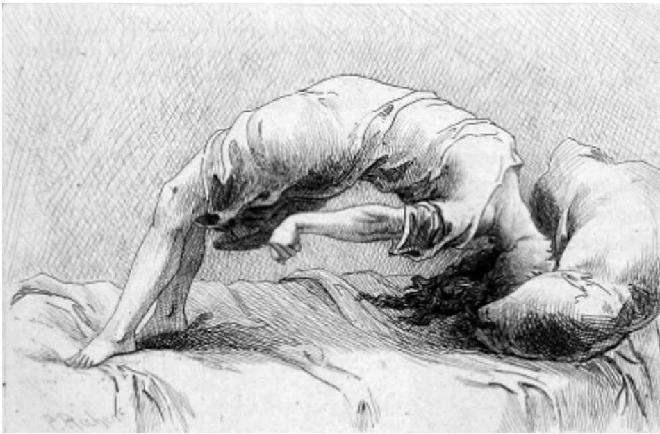
Figura 3 - O arco histérico