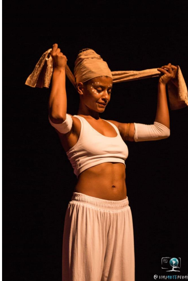
Figura 15 - Cena A Caminho do Mar. Encontro Internacional de Mulheres do Circo. Ribeirão Preto/SP