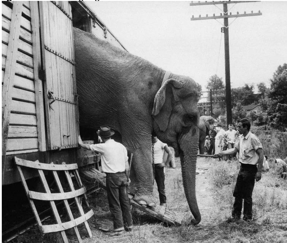
Figura 6 - The Ringling Brothers and Barnum & Bailey Circus – Elefante

outros animais, especialmente aos selvagens: elefantes, leões e tigres passaram a ser os símbolos máximos do incógnito que, representava as florestas, o reino do obscuro e do incerto. (AMATO, 2010, p. 24)