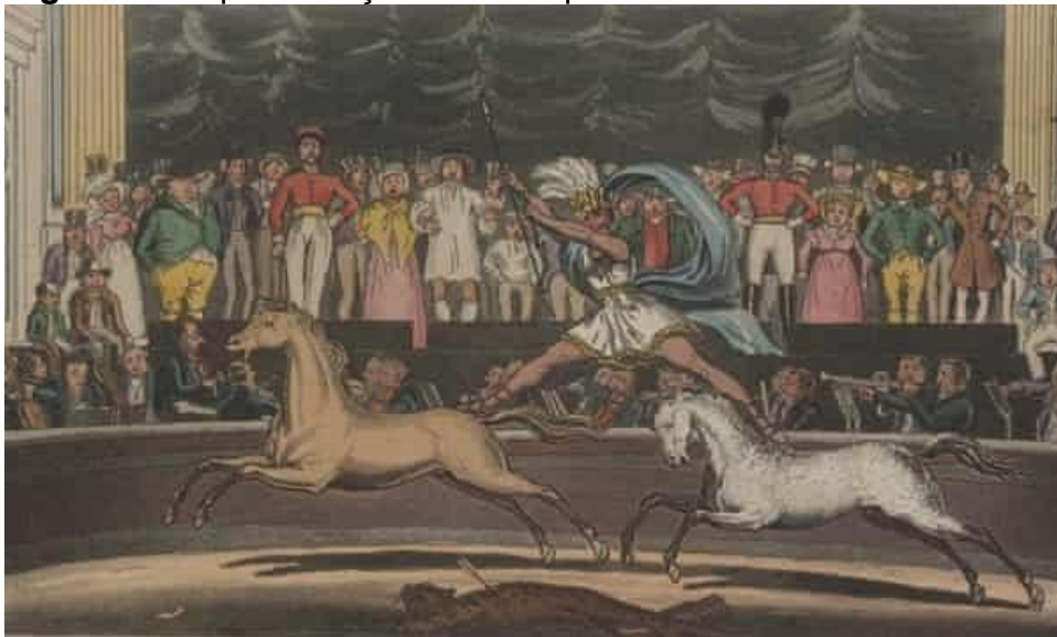
Figura 2 - Representação de um hipodrama.

Além da exibição de movimentos dinâmicos executados sobre cavalos, os animais equinos também atuavam como protagonistas em encenações denominadas hipodramas (ou dramas equestres), que tinham como principal narrativa feitos heroicos de Napoleão Bonaparte e desdobramentos da Revolução Francesa. As histórias narradas pelos hipodramas também contribuíram para a propagação do “ideal romântico de afirmação do eu, em decisiva ruptura com a natureza e a sociedade” (BOLOGNESI, 2009, p.5).