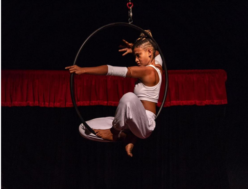
Figura 18 - Cena A Caminho do Mar. Encontro Internacional de Mulheres do Circo. Ribeirão Preto/SP