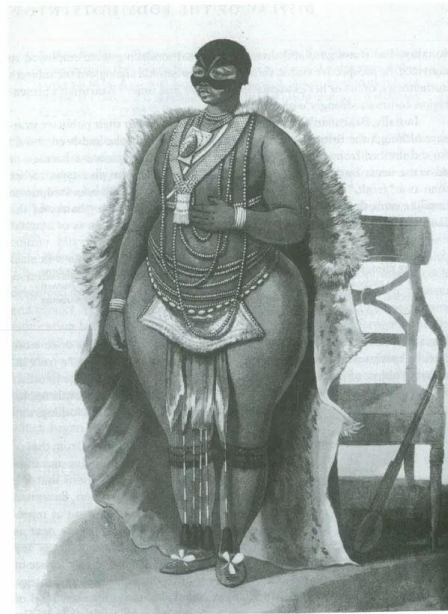
Figura 7 - The Hottentot Venus Sartjee