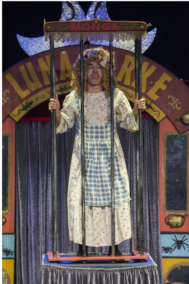
Figura 4 - Monga, Circo Zanni