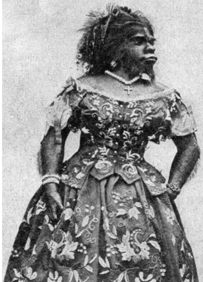
Figura 5 - Julia Pastrana, monga “a mulher macaco”

presença de Julia Pastrana 6 , mulher mexicana que manifestava essa condição e passou grande parte de sua vida sendo exposta e humilhada em espetáculos de freak show . Nos espetáculos, Julia era chamada de Monga, a mulher-macaco (BEZERRA, 2014).