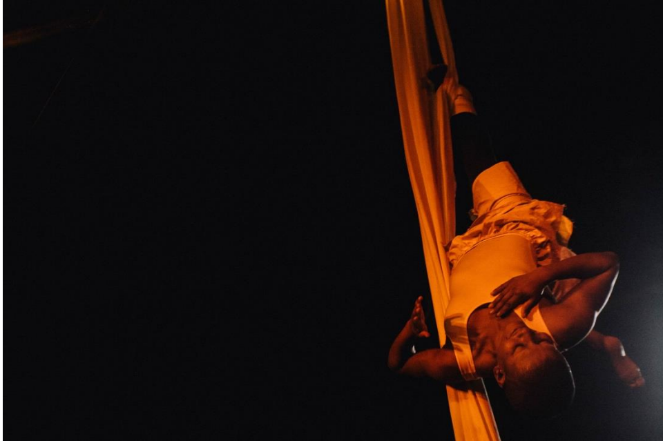
Figura 14 - Cena Lençóis. 21ª Convenção Brasileira de Malabarismo e Circo. Goiânia/GO

acrobata simule leveza, como se estivesse flutuando, me instigou investigar maneiras de empregar o peso e a firmeza do ritmo do coco durante as movimentações com o aparelho.