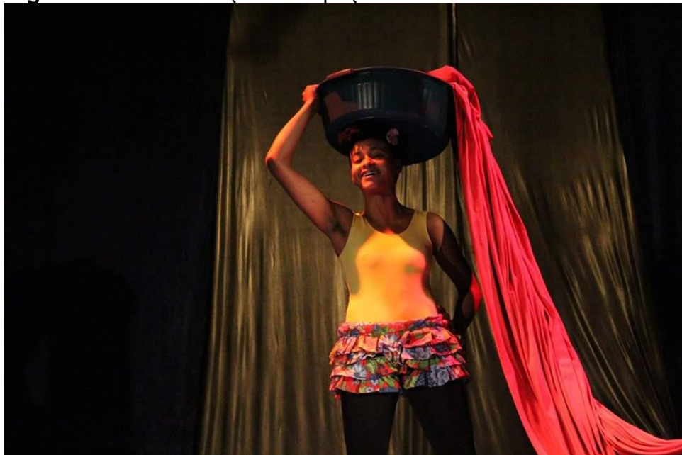
Figura 12 - Cena Lençóis. Ocupação Vulverística na Lona. São Paulo/SP

na gestualidade das lavadeiras. Procurei tecer a cena com movimentações e gestos comuns às lavadeiras durante a realização de seus trabalhos, de maneira que essa corporeidade confluísse com técnicas de tecido acrobático. Me preocupei em desenvolver uma partitura que desse ao tecido um significado dentro da narrativa construída, evitando sua participação como um objeto alheio a história que estava sendo contada. Sendo assim, fiz do tecido um objeto cênico que representava a roupa a ser lavada. Portanto, o aparelho é manipulado por meio de gestos que fazem alusão ao processo de lavar roupas, como as ações de esfregar, torcer, bater e estender. Quanto a figurino, escolhi utilizar uma saia de chita, por ser um material muito presente em expressões populares afrobrasileiras. Atualmente, o figurino é feito de algodão cru, que foi escolhido pelo mesmo motivo.