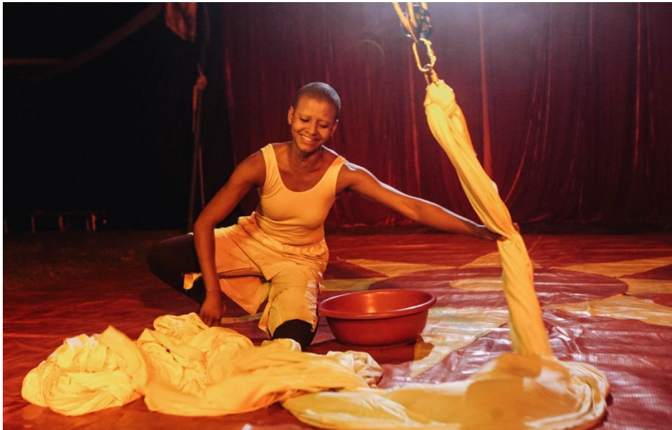
Figura 13 - Cena Lençóis. 21ª Convenção Brasileira de Malabarismo e Circo. Goiânia/GO