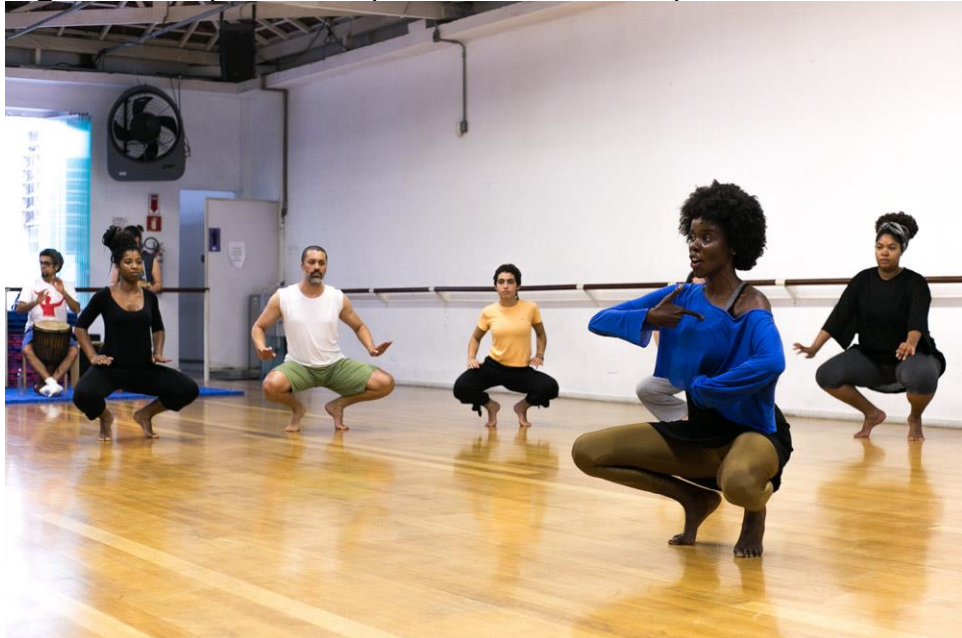
Figura 8 - Corpo em Diáspora. Sala Crisantempo

o corpo como um todo. Movimentos espiralares incentivam os corpos na sala a se moverem em todas as direções, seguindo em frente sem deixar de contemplar o que está ao lado e o que está atrás. A pulsação, individual e coletiva, está presente do começo ao fim mantendo a coletividade da turma e reverberando nossos movimentos de maneira cíclica e fluida. Assim como a relação entre o solo e os corpos em movimento, quando saltamos, rodamos, deslizamos e vamos ao encontro do chão. Também destaco os trabalhos de mobilidade do quadril, a circularidade, as formas corporais arredondadas, o equilíbrio e o desequilíbrio.