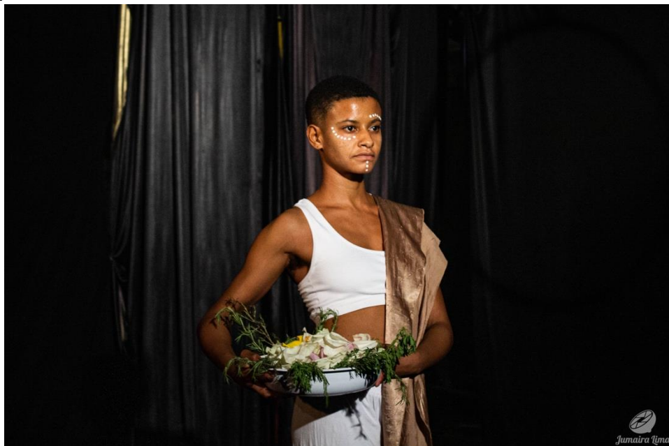
Figura 16 - Cena A Caminho do Mar. Ocupação Vulverística na Lona. São Paulo/SP