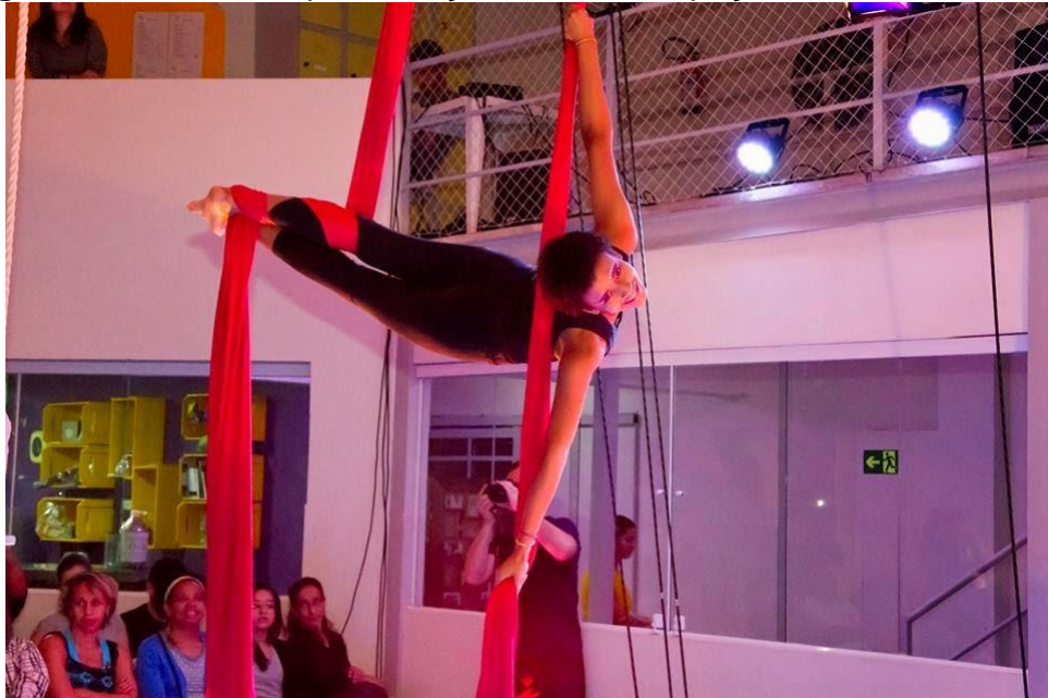
Figura 11 - Primeira apresentação de circo. Espaço Escola Arena de Artes