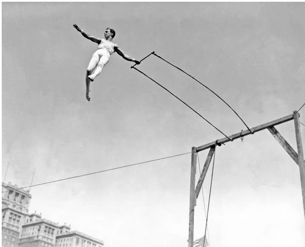
Figura 3 - The Ringling Brothers and Barnum & Bailey Circus - Trapézio

Para Bolognesi (2001), a corporeidade circense pode ser dividida entre o “corpo sublime” e “o corpo grotesco”. O sublime seria este descrito anteriormente, o corpo que após passar por intensos e rígidos treinamentos executa movimentos virtuosos e espetaculares, gerando apreensão, admiração e distanciamento de quem assiste.