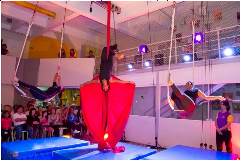
Figura 10 - Primeira apresentação de circo. Espaço Escola Arena de Artes

iniciantes e não tínhamos muitos repertórios e referências, o número foi dirigido por nossa professora. Lembro pouco da partitura acrobática, mas recorro bem da estética utilizada. Uma música escolhida por nós era tocada, enquanto realizávamos movimentos aprendidos em sala de aula, sem nenhuma relação direta com a música a não ser pelo ritmo. Não havia nenhum tipo de narrativa, apenas acrobacias executadas em uma sequência estruturada por nós, em parceria com a professora. Os figurinos utilizados eram collants e calça legging , ambos na cor preta. E a maquiagem era bem colorida, cheia de purpurina. Lembro que eu fiquei muito feliz com essa apresentação, por conseguir realizar os movimentos e vivenciar um dia como artista de circo. Grande parte de minha família foi assistir e ficaram impressionados com nossas acrobacias.