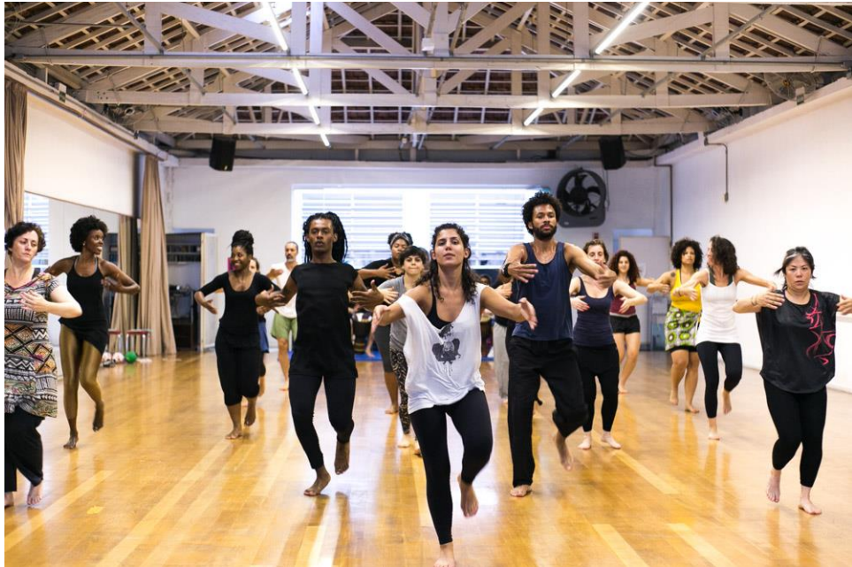
Figura 9 - Corpo em Diáspora. Sala Crisantempo