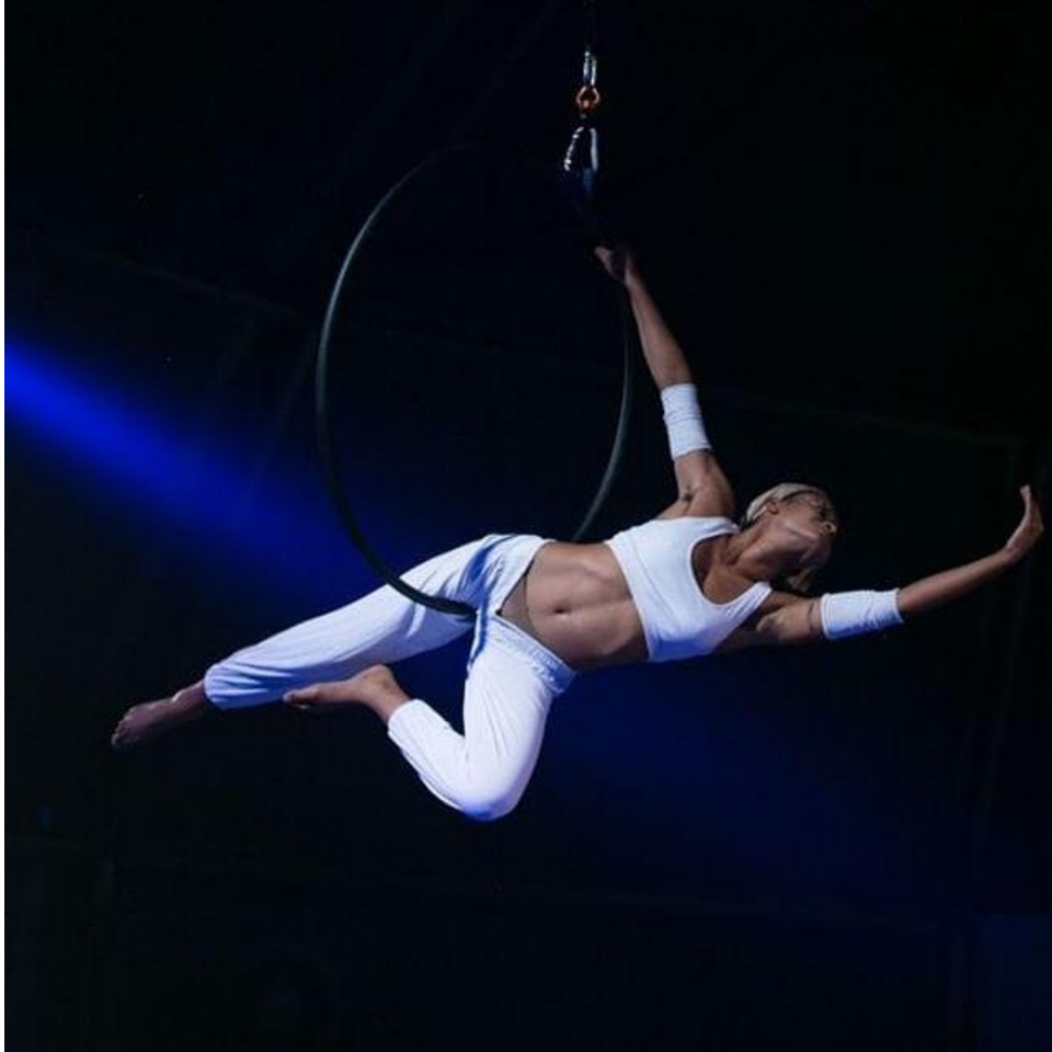
Figura 17 - Festival Internacional de Circo de São Paulo (FIC)