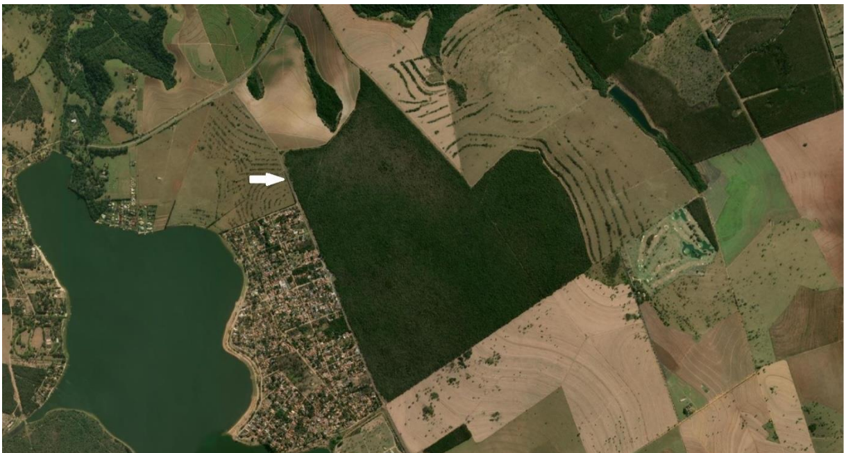
Figura 1. Vista superior da área do fragmento estudado (indicado pela seta) pertencente à Fazenda São José da Conquista em Itirapina, SP, Brasil.

mais comum da família Annonaceae nesse ambiente (SILBERBAUER-GOTTSBERGER et al., 2003; SANTOS, 2007). Também elegemos Caryocar brasiliense Cambess. (Caryocaraceae), ou popularmente conhecido por pequi, que é uma árvore que possui acúmulo de aproximadamente 170 mg de Al por kg de folha seca (HARIDASAN & ARAÚJO, 1988), a qual pode atingir até 10 metros de altura, possui folhas grandes, opostas, sem brilho, folíolos tomentosos e com margem crenada. Esta espécie também tem ampla ocorrência na vegetação de Cerrado (RIBEIRO et al., 1986; LORENZI, 1998) e possui grande importância ecológica, econômica e social.