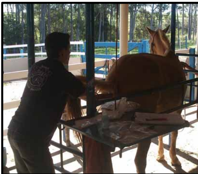
Figura 3: Coleta de amostras fecais dos equinos