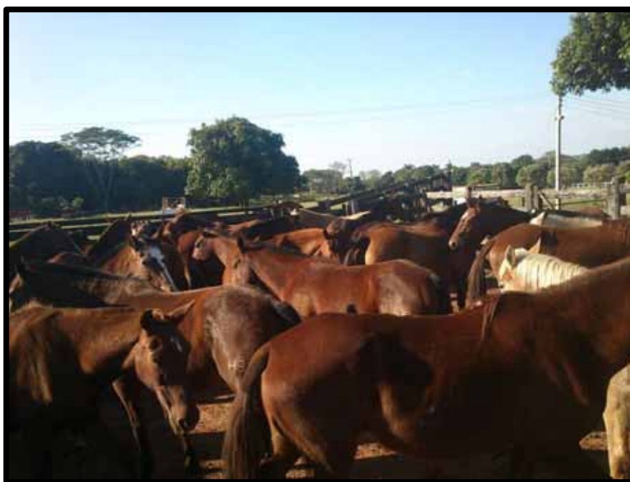
Figura 1: Seleção dos animais por categorias