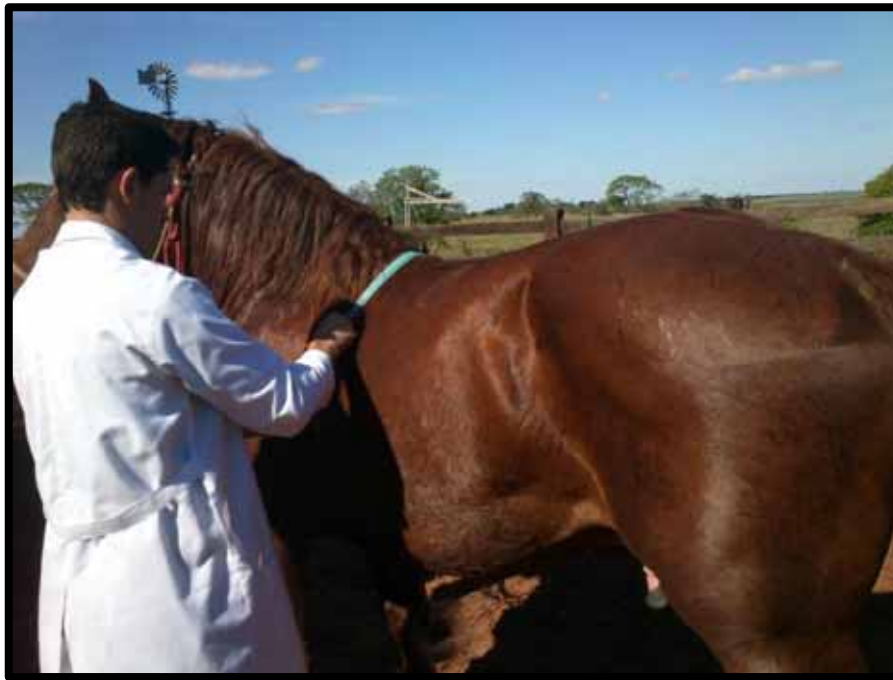
Figura 2: Pesagem dos animais com fita torácica