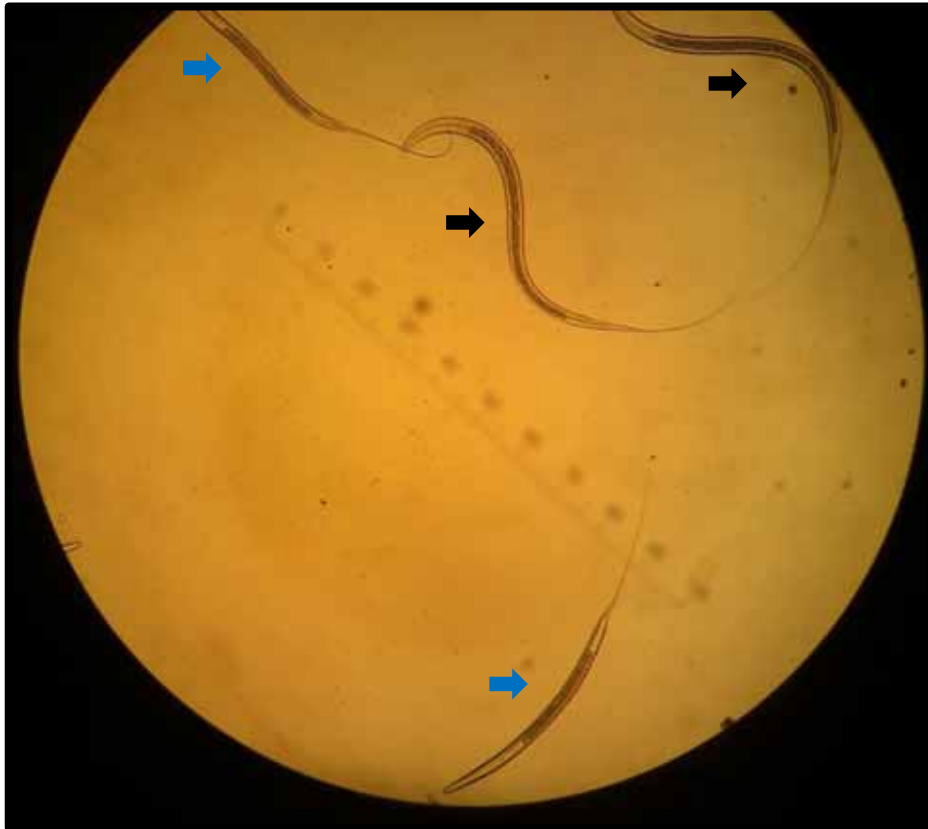
Figura 6: Larvas de terceiro estágio (L3) da espécie Strongylus vulgaris (➡) e da subfamília Cyathostominae (➡).