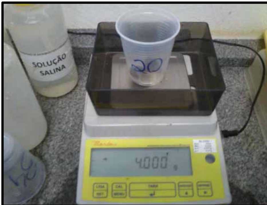
Figura 5: Pesagem das amostras