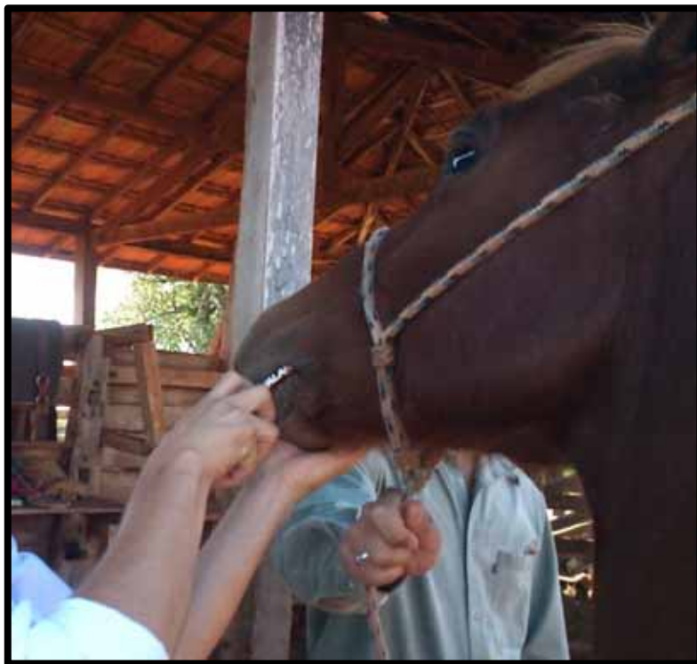
Figura 4: Aplicação dos anti-helmínticos