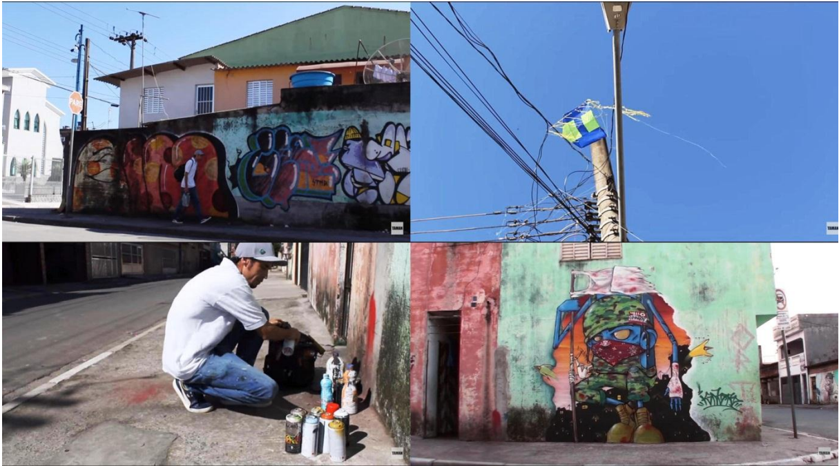
Figura 23 – Imagens do documentário Sampa grafite – Ignoto