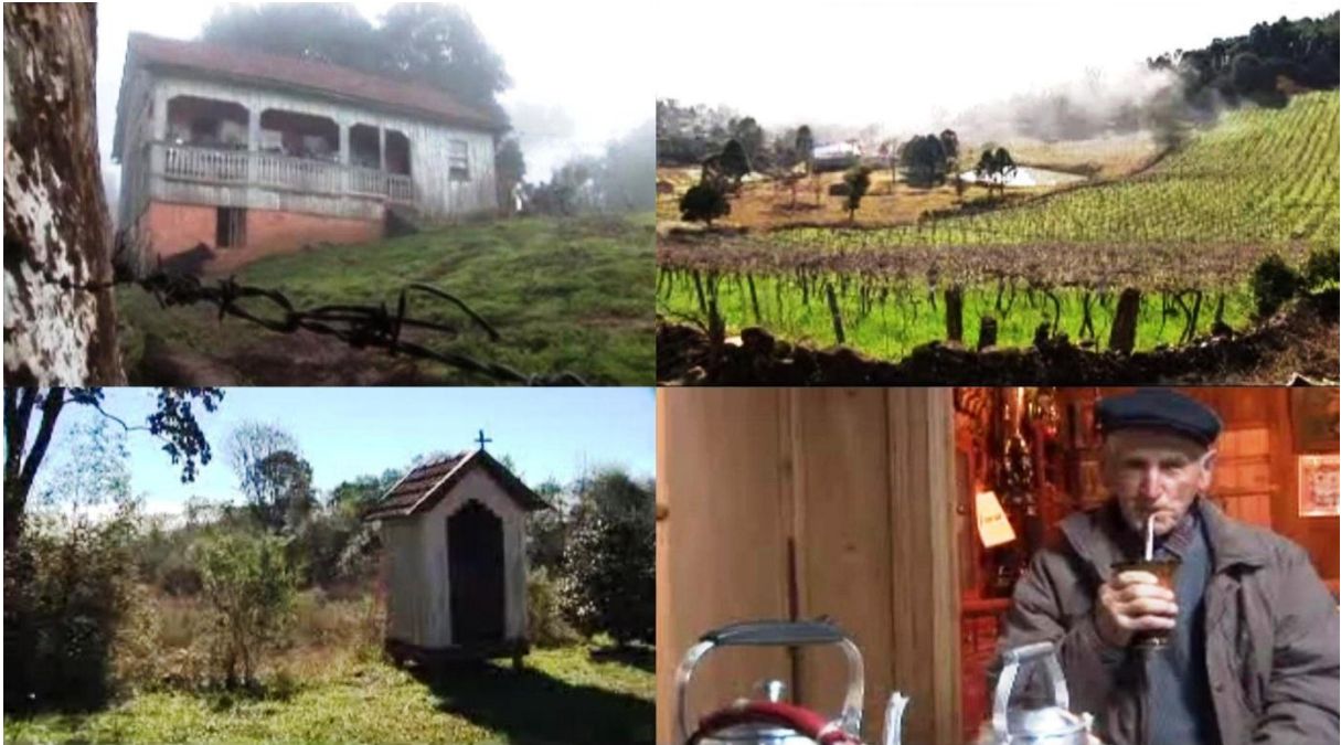
Figura 17: Imagens do documentário Se milagres desejais