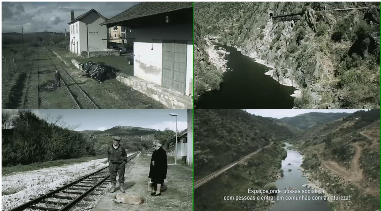
Figura 7 – Imagens do documentário Pare, escute, olhe (2009)