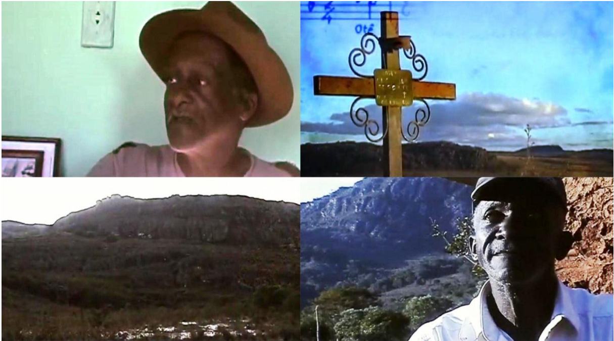
Figura 13 – Imagens do documentário Vissungo. Fragmentos da tradição oral