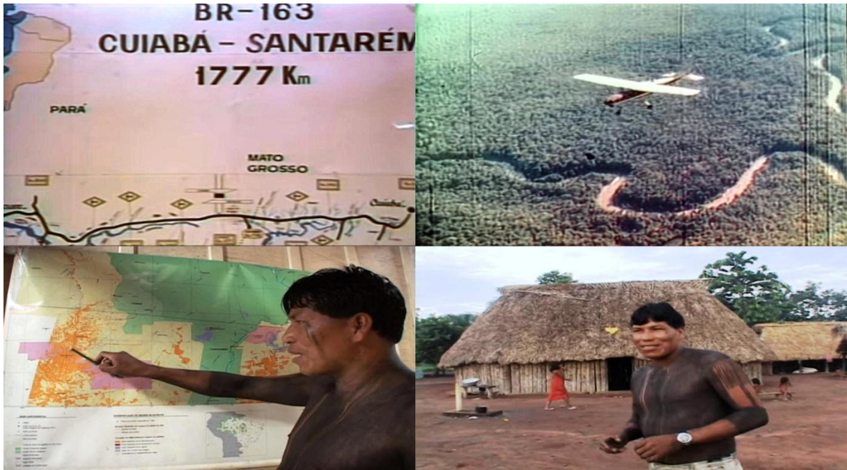
Figura 19 – Imagens do documentário De volta a terra boa