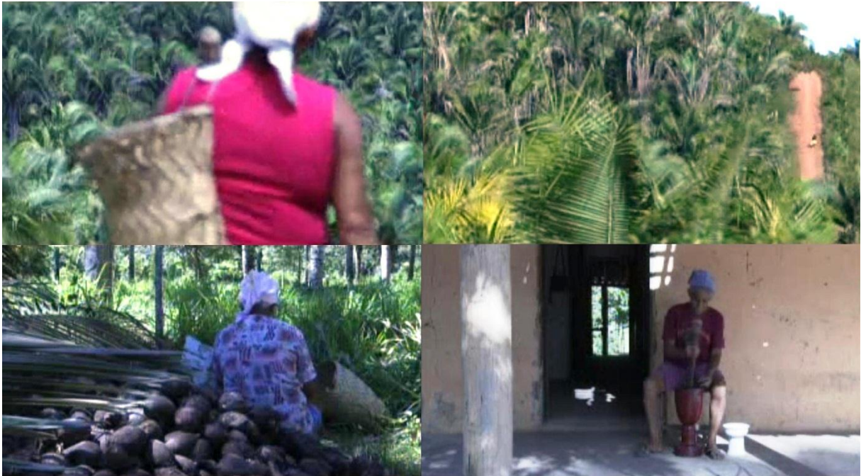
Figura 11 – Imagens do documentário Quebradeiras