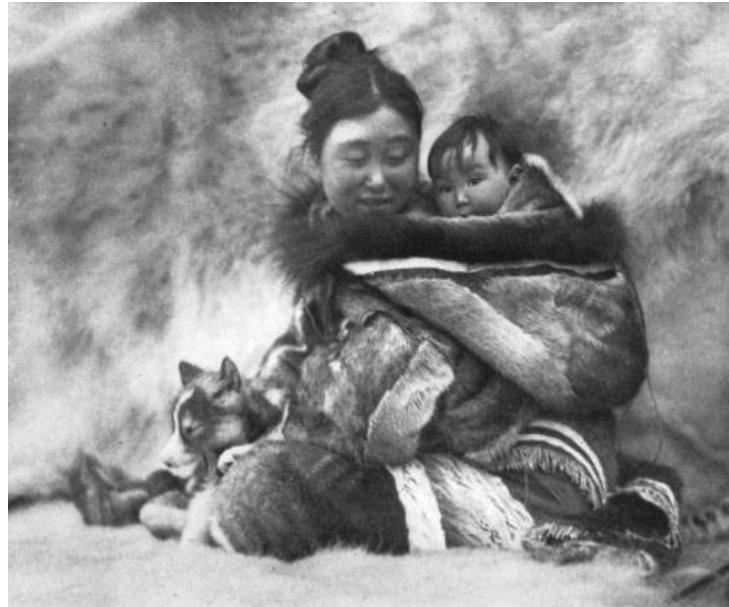
Figura 1 – Imagem do documentário Nanook of the North de 1922 de R. Flaherty