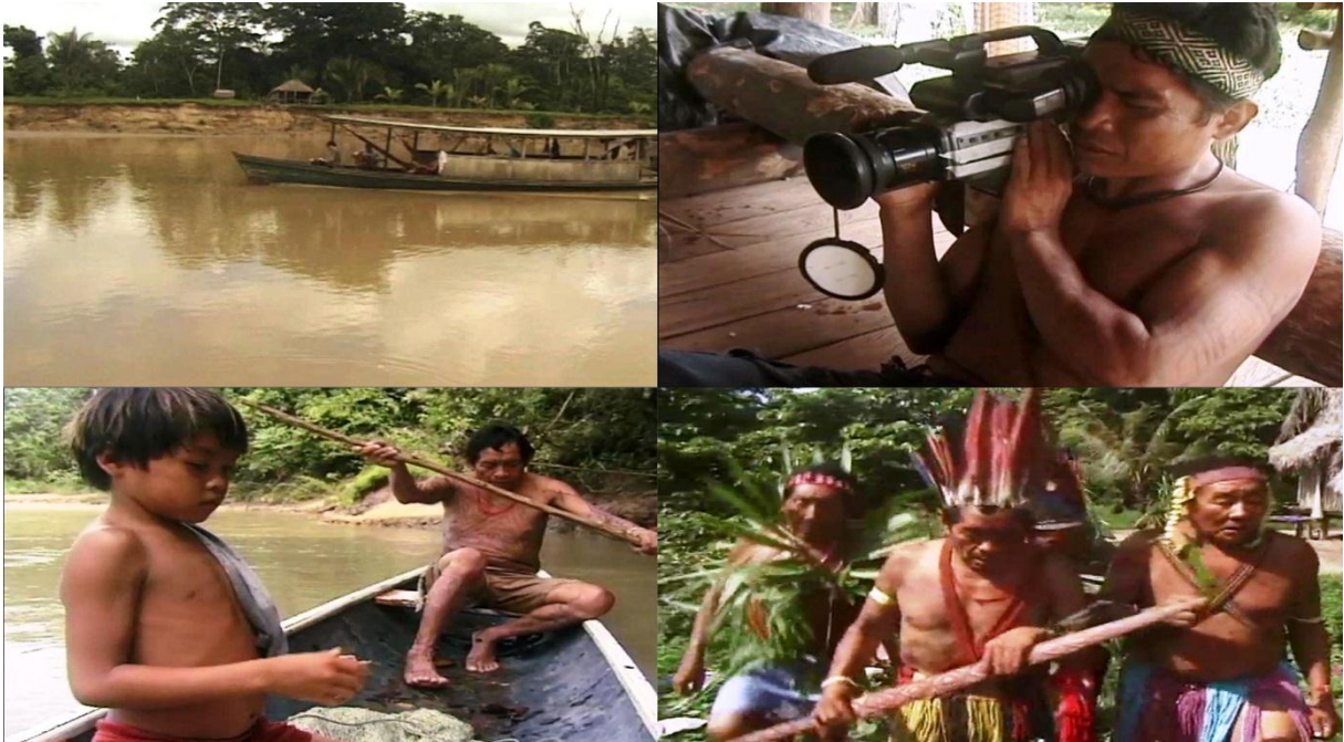
Figura 18 – Imagens do documentário Xinã Bena, novos tempos

O grupo de trabalho realizou pesquisa referente aos indígenas Kaxinawá, também conhecidos como Huni Kui, especificamente uma aldeia localizada no Acre. A partir do documentário Xinã Bena, novos tempos (Figura 18), a equipe traçou pontos acerca da cultura, território, paisagem e da experiência com o audiovisual.