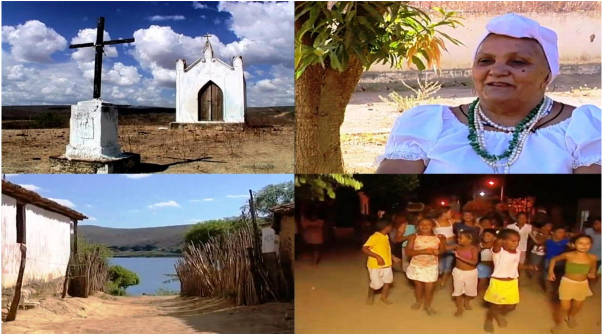
Figura 21 – Imagens do documentário Um olhar sobre os quilombos do Brasil – Mocambo

localizado no município de Porto da Folha em Sergipe. Além de retratarem questões territoriais, a identidade cultural, as lutas e conquistas dos direitos dos quilombolas.