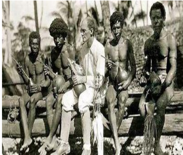
Figura 2 – Malinowski e os Kula nas Ilhas Trobriand entre 1914 e 1918