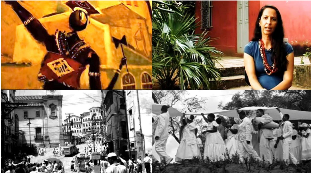
Figura 20 – Imagens do documentário Arte no espaço

Neste trabalho, o grupo realizou pesquisa referente ao documentário Arte no Espaço (FIG. 20) o qual retrata através de entrevistas, documentos e fotografias as contribuições do fotógrafo franco-brasileiro Pierre Verger para a manutenção da cultura afro-brasileira com seus trabalhos que ao mesmo tempo nos remete a um tempo histórico e cria imaginários a respeito das manifestações culturais afro-brasileiras.