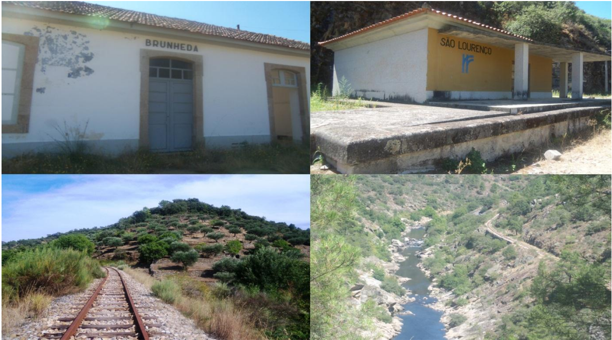
Figura 9 – Estações, o caminho de ferro e o rio Tua

isolamento em Portugal. Em contra partida, sua paisagem cultural historicamente construída, seus olivais e vinhas a tornaram um lugar singular. (FIG. 9). E de fato sua morfologia e suas tradições culturais foram reconhecidas e postas às vistas depois da construção das linhas de ferro. Assim ocorreu com o entorno da linha do Tua, o que propiciou ao turismo natural e cultural estabelecer-se como atividade econômica. (SIMÃO; MELO, 2011).