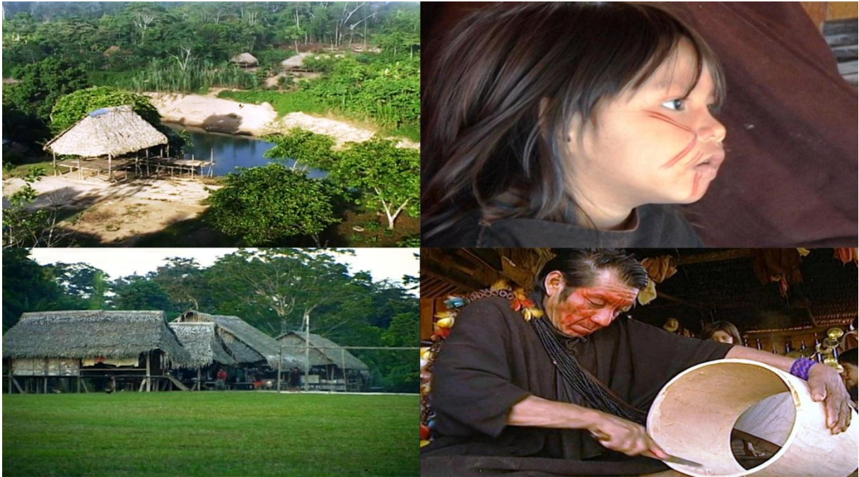
Figura 12 – Imagem do documentário A gente luta, mas come fruta