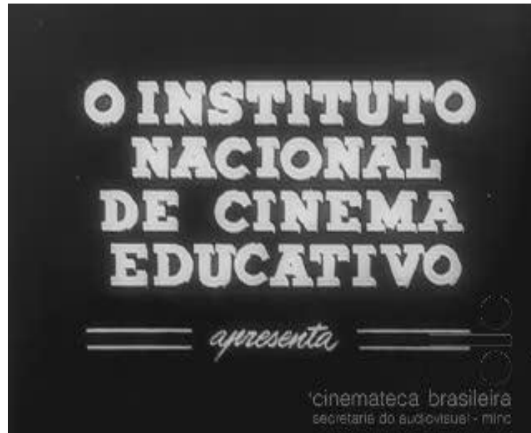
Figura 5 – Letreiro de documentário do INCE