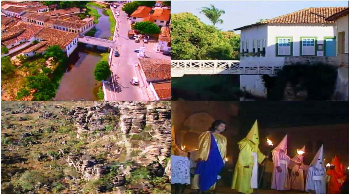
Figura 15 – Imagens do documentário Villa Boa de Goiás