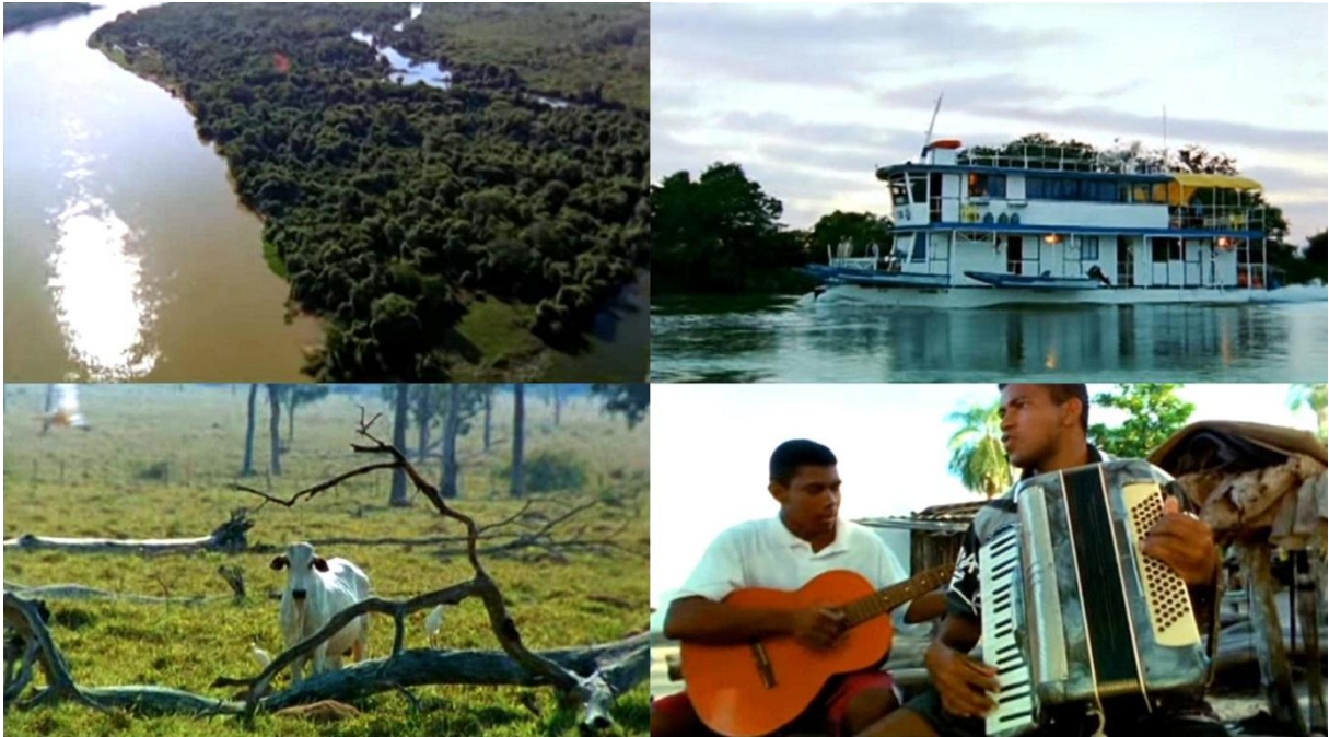
Figura 16 – Imagens do documentário História sem fim... do Rio Paraguai

cultura das populações ribeirinhas que vivem em torno do Rio Paraguai”. (TEXTO GRUPO 7).