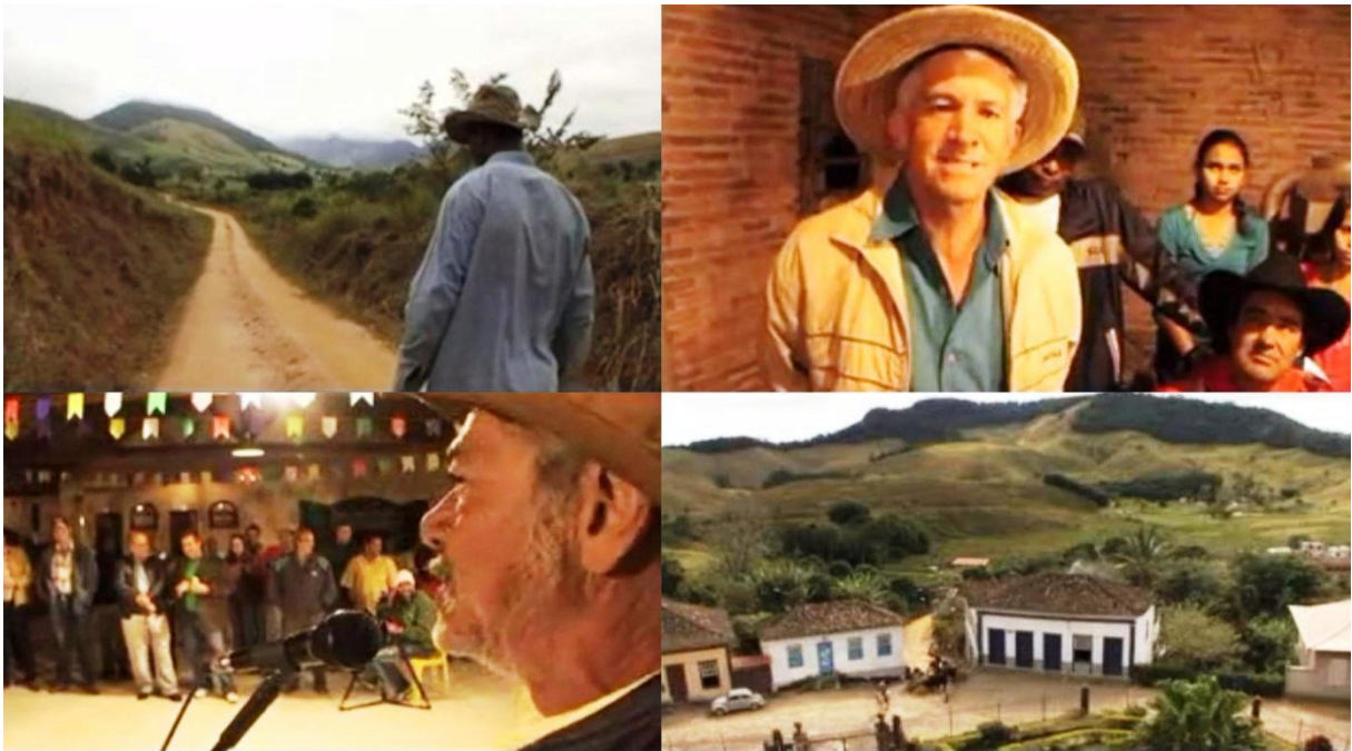
Figura 14 – Imagens do documentário Calangos e Calangueiros: uma viagem caipira pelo Vale do Paraíba