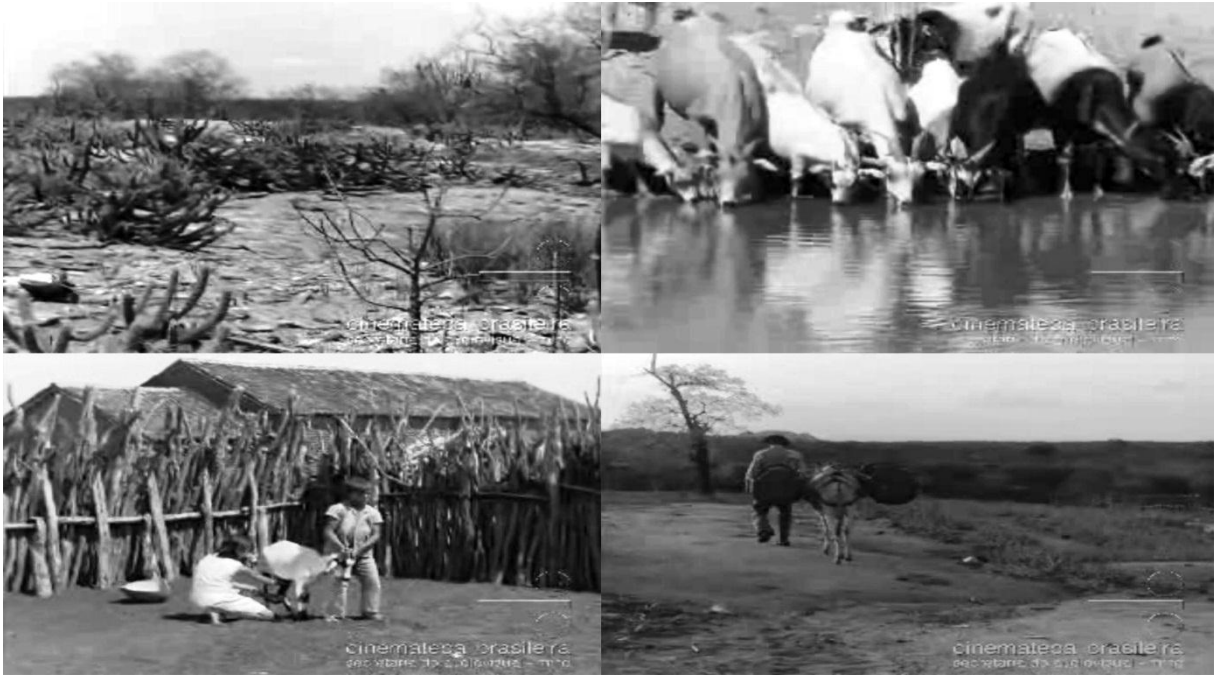
Figura 10 – Imagens do documentário A cabra na região semi-árida