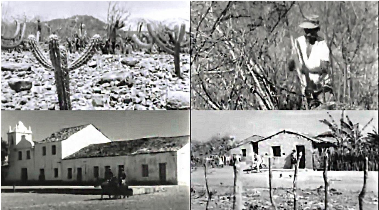
Figura 6 – Imagens do documentário O País de São Saruê de Vladimir Carvalho (1971)

Fonte: https://www.youtube.com/watch?v=HiznfkUBBqE