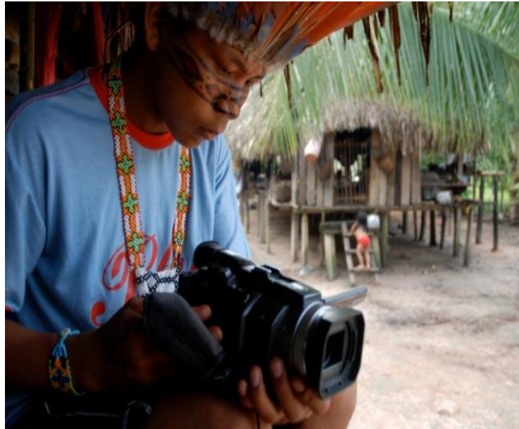
Figura 4 – Projeto Vídeo nas aldeias