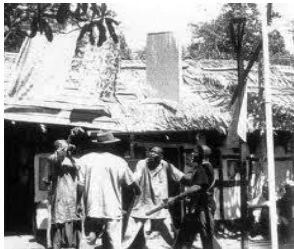
Figura 3 – Imagem do documentário Les Maîtres Fous (Os mestres loucos), de Jean Rouch, 1954