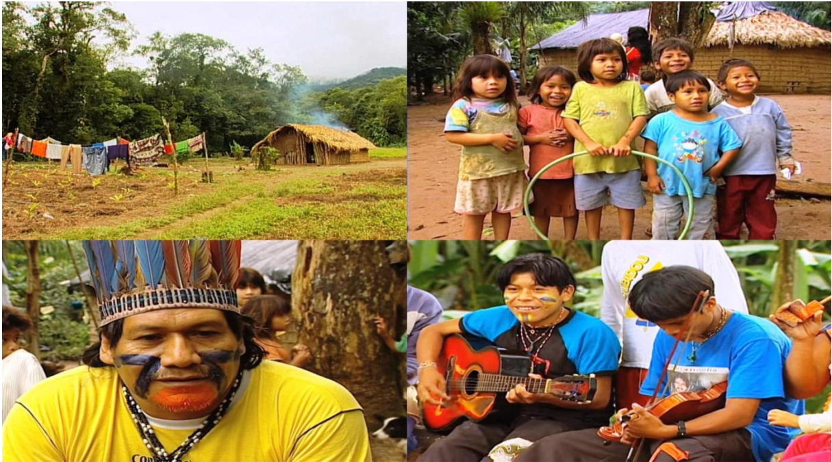
Figura 22 – Imagens do documentário Visita a aldeia Guarani