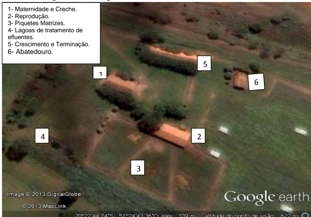
Figura 1- Vista geral do setor de Suinocultura da FEPE.

No setor de reprodução (Figura 2) há baias coletivas para as fêmeas, as quais foram dimensionadas para até 8 matrizes, possuindo acesso à piquete, onde, estes animais podem expressar seu comportamento natural ao ar livre, e até mesmo banhar-se em piscinas de lama. O setor de reprodução conta também com baias para os cachaços, sendo baias individuais com acesso a piquetes.