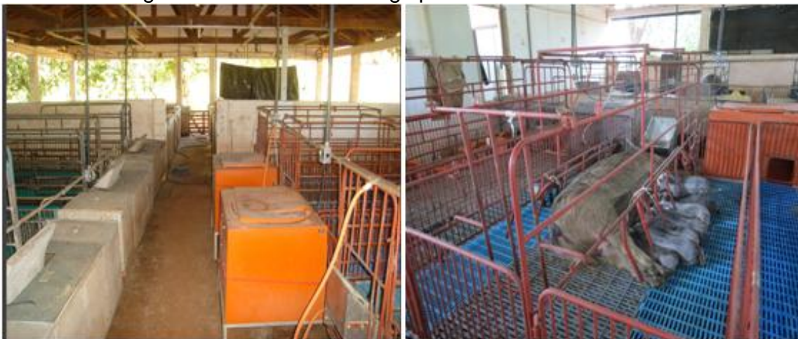
Figura 3 - Vista interna do galpão de Maternidade e Creche.