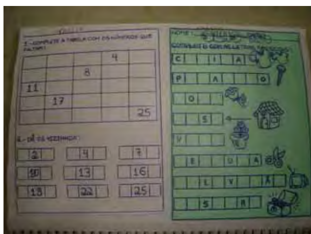
Figura 3- Registro de aula de Marina

Nas figuras pode ser observado o aspecto dos registros de aula de Marina e Laura, com colagem de folha mimeografada: