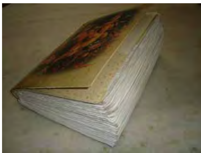
Figura 1- Caderno de Marina com os registros de suas aulas do primeiro semestre.

Outra semelhança entre as professoras iniciantes está na forma de seus registros diários das aulas. São cadernos com um grande volume devido à colagem de várias folhas mimeografadas, modelos das atividades utilizadas na sala de aula. Ao observar as imagens dos cadernos com os registros referentes ao primeiro semestre letivo de 2007, pode-se ter uma idéia do volume dos mesmos: