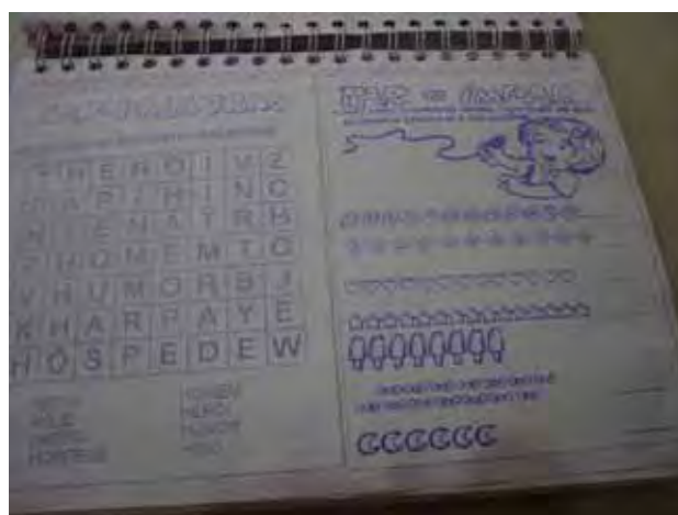
Figura 4- Registro de aula de Laura