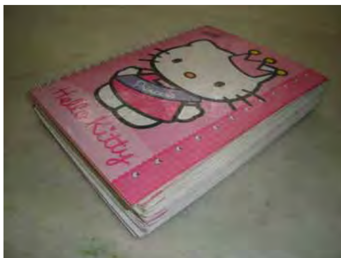
Figura 2- Caderno de Laura com os registros de suas aulas do primeiro semestre.