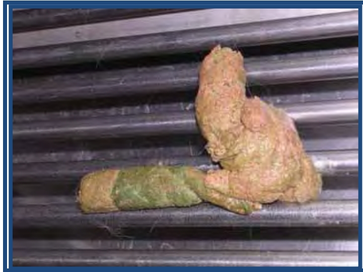
Figura 2. Fezes de gato após administração de cápsula contendo óxido crômico.

Estudos demonstram que o consumo de alimentos pode estar relacionado com o tempo de permanência do alimento no trato gastrointestinal, e com o consumo de fibras, baseando-se em respostas de saciação e saciedade. A presença do alimento no estômago no início da refeição determinou a quantidade de energia que foi ingerida e a duração do intervalo entre refeições em ratos (CASTRO et al., 1981). Estudo em humanos demonstrou que a remoção da fibra encontrada naturalmente nos alimentos, causa aceleração do esvaziamento gástrico e proporcionou fome mais rapidamente (BELINE et al., 1995). A distensão gástrica e intestinal estimula o nervo vago a emitir sinais de saciação e saciedade (CASE et al., 1998). PAPAS et al. (1989) concluíram que a distensão gástrica em cães é um fator que inibe o consumo alimentar. Outros polipeptídeos também são liberados e agem sobre o tempo de esvaziamento gastrointestinal, interferindo indiretamente na regulação do apetite.