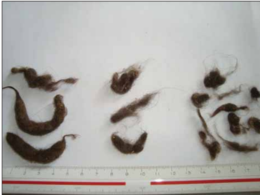
Figura 2. Tricobezos coletados de um gato durante os três dias, separados em grandes (>2,0 cm), médios (<2,0 cm e >1 cm) e pequenos (>1,0 cm).

O contraste ortogonal significativo para o número total e número de tricobezos médios (gato/dia), indica que houve diferença de fontes sobre estas variáveis. A redução do número de tricobezos nas fezes, observado com a suplementação de fibra de cana na dieta, não foi verificado nos gatos que consumiram a dieta com celulose. Este resultado pode ter sido efeito da diferença do comprimento das fibras, considerando-se que fibras longas parecem provocar maior estimulação do peristaltismo (KRUGNER-HIGBY et. al, 1996) e que a fibra de cana apresenta diâmetro geométrico médio maior do que a celulose ( 188\pm 1,8 vs 112\pm 1,7 microns).