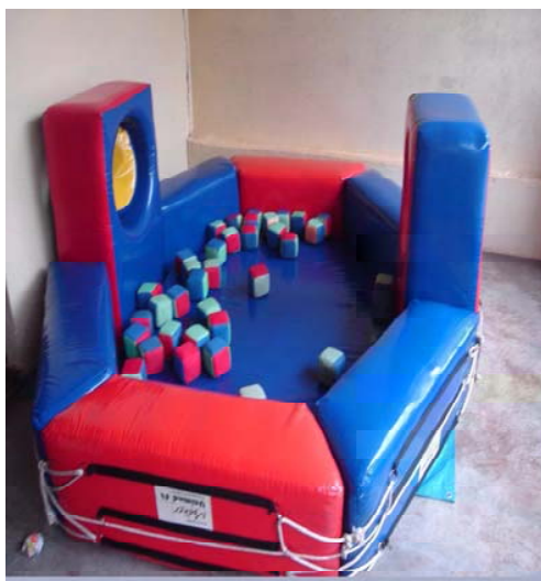
Figura 6. Piscina de cubos do Berçário I

As crianças desse grupamento passavam a maior parte do tempo livres, no tapete da sala, em contato com os objetos ou na área onde ficava a piscina de cubos e o parque. As professoras acompanhavam sempre as atividades de perto, incentivando e evitando, assim, qualquer tipo de acidente. Mas, por diversas vezes, foi possível observar que elas ficavam conversando sobre os mais diferentes assuntos enquanto as crianças brincavam sozinhas.