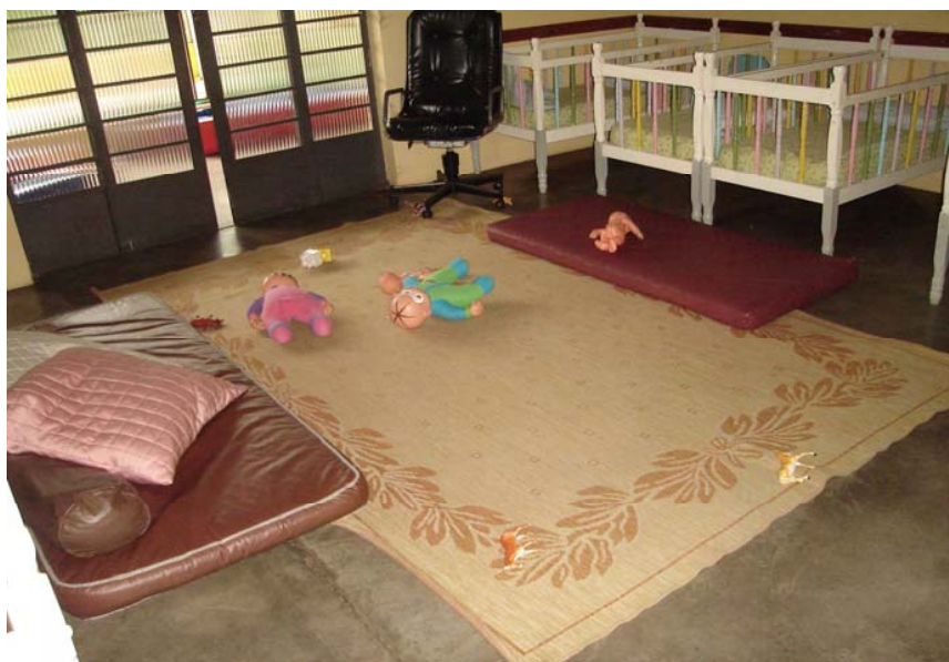
Figura 2. Organização da sala do Berçário I

A sala do Berçário I possui um tapete bem no centro, seis berços dispostos próximos às paredes (três de cada lado da sala), um espelho, um banheiro próprio para a higienização das crianças (banho e troca de fralda) e um outro espaço destinado ao armazenamento dos materiais utilizados na prática educativa (estante). A sala tem, ainda, uma grande porta de correr de vidro que aberta dá acesso aos brinquedos externos (piscina de cubos) e semáforo de espuma, carrinhos de bonecas. Em frente a este espaço, está o parquinho do Berçário I, que possui um balanço coletivo, um gira-gira e um escorregador.