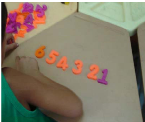
Figura 14. Brinquedo destinado à aprendizagem específica.