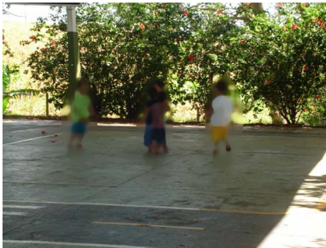
Figura 10. O brincar no Maternal – sala. Figura 11. Momento de brincadeira na quadra – Maternal.

Nas salas de Pré-escola, observamos uma grande diferença com relação aos materiais empregados pelas professoras, os quais cada vez mais se destinam à aprendizagem de conteúdos científicos ou ao desenvolvimento de habilidades específicas. Dentre outros objetos, destacamos: alfabetos móveis (de plástico, EVA, madeira), de seriação, de classificação, sequência lógica, de cálculo, de números, de representação de quantidade, quebra-cabeça, jogo da memória.