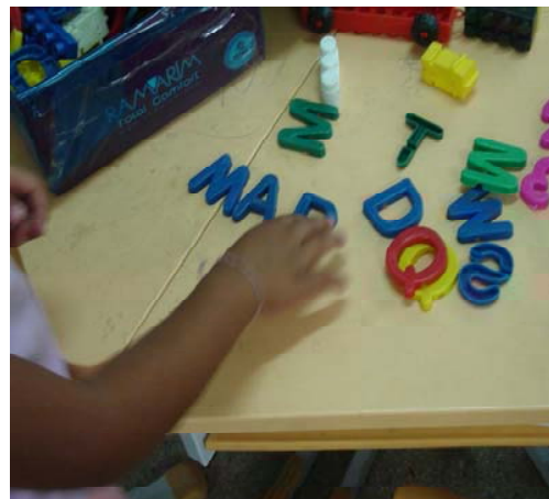
Figura 13. Brinquedo empregado para alfabetizar (linguagem escrita).