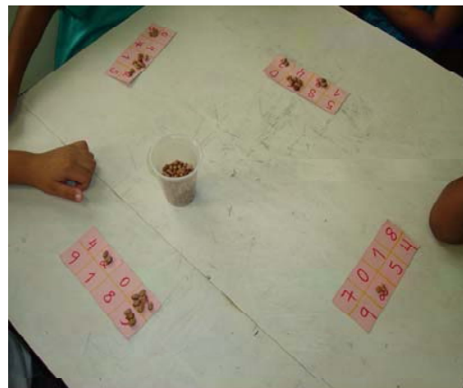
Figura 15. Uma das principais finalidades da utilização do brinquedo na Pré-escola

Esses são alguns dos exemplares de brinquedos mais encontrados nas salas de Pré-escola. Do lado esquerdo da sala, fica o armário de uma das salas. Nesse grupamento a professora permite que as crianças escolham sozinhas os brinquedos, assim que terminam a lição. Embora a sala possua um número significativo de brinquedos, as opções de brincadeira não são muitas, haja vista que há inúmeras variações de brinquedos que oferecem uma mesma função.