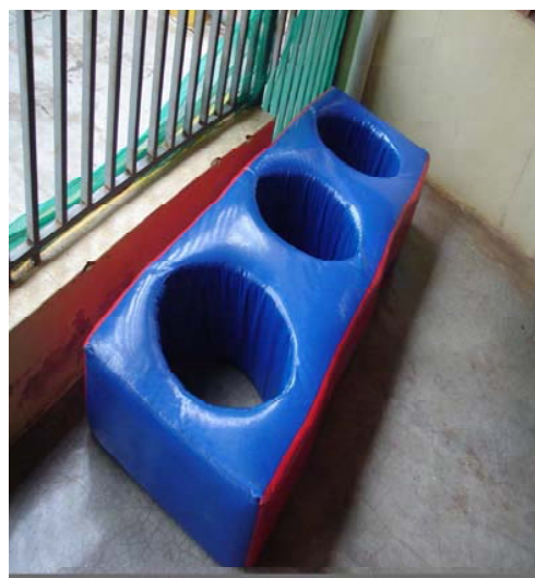
Figura 7. Área exclusiva do Berçário I

O Berçário II possuía uma variedade maior de brinquedos, tais como: fantoches, blocos de encaixe de diversos modelos, bonecas, carrinhos de boneca, bonecos, panelinhas, carrinhos, bambolês, bonecos de pelúcia, mordedores, blocos de construção, bola, corda, animais de fazendinha e da floresta, incluindo dinossauros. Além desses, havia vários objetos do cotidiano, também utilizados pelas crianças para representar situações da vida real, como frascos de shampoo, de hidratante, etc. Tudo ficava devidamente armazenado num grande armário de aço com as devidas identificações, como já foi mostrado anteriormente.