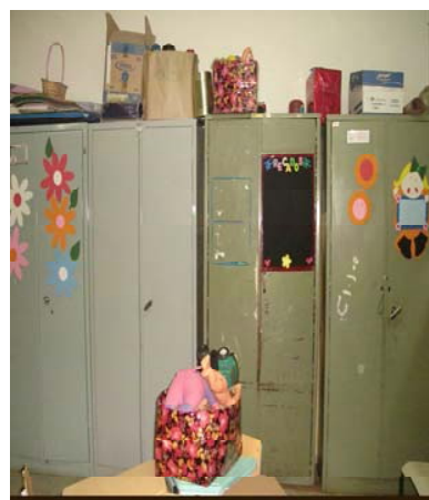
Figura 4. Brinquedos da sala- prof.Cláudia Figura 5. Armários com brinquedos, prof. Ângela

Das seis salas da escola, uma delas era usada também como sala de repouso e uma outra sala foi adaptada para o atendimento das crianças do Maternal, conforme relata, em entrevista, a professora Poliana: “[...] então, lá na sala do Maternal, bom, aquela sala é adaptada era uma sala única que foi cortada ao meio, têm crianças lá no Maternal que já estão naquela mesmíssima sala há três anos. Então eles já estão saturados, eles já estão por natureza agitados por ser de período integral”.