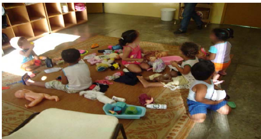
Figura 8. Parte da rotina do Berçário II

A turma do Maternal também dispunha de grande variedade de brinquedos como blocos de encaixe, carrinho, bonecas e bonecos, objetos de casinha, bambolês, carrinhos de bonecas, bichos de pelúcia, todos dispostos em caixas grandes e vazadas para facilitar a identificação.