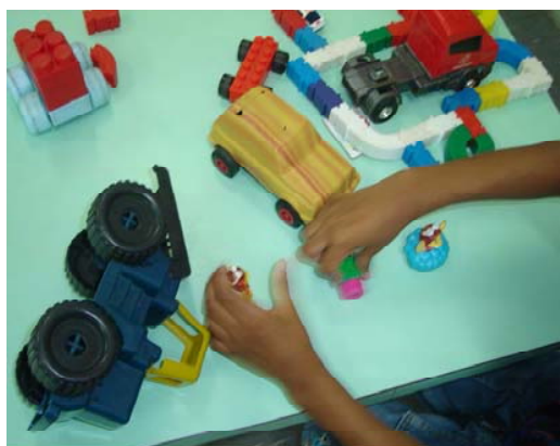
Figura 18. Brinquedo de caráter Imaginativo - escola A