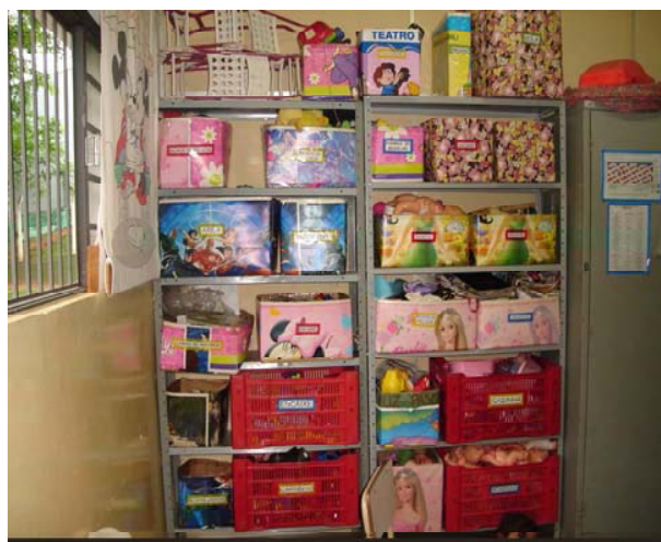
Figura 3. Disposição dos brinquedos do Berçário II

Já a sala do Berçário II, está organizada com um tapete no centro, um espelho, um armário pequeno para guardar as bolsas das crianças; uma prateleira de aço, contendo os brinquedos da turma (todos dispostos em caixas devidamente etiquetadas); um armário de aço fechado para armazenamento dos demais materiais escolares; e uma pequena mesa com três cadeiras também pequenas (infantis), que as professoras utilizavam para realizar suas atividades, organizar os cadernos das crianças e, eventualmente, descansar.