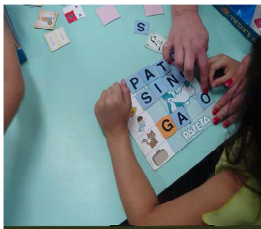
Figura 12. Um dos usos do brinquedo na Pré-escola.

Nas salas de Pré-escola, observamos uma grande diferença com relação aos materiais empregados pelas professoras, os quais cada vez mais se destinam à aprendizagem de conteúdos científicos ou ao desenvolvimento de habilidades específicas. Dentre outros objetos, destacamos: alfabetos móveis (de plástico, EVA, madeira), de seriação, de classificação, sequência lógica, de cálculo, de números, de representação de quantidade, quebra-cabeça, jogo da memória.