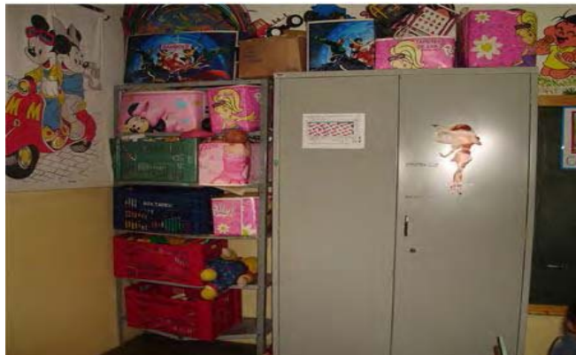
Figura 9. Acomodação dos brinquedos do Maternal

A turma do Maternal também dispunha de grande variedade de brinquedos como blocos de encaixe, carrinho, bonecas e bonecos, objetos de casinha, bambolês, carrinhos de bonecas, bichos de pelúcia, todos dispostos em caixas grandes e vazadas para facilitar a identificação.