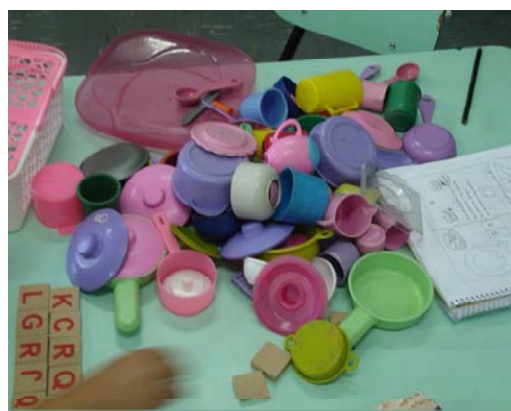
Figura 19. Brinquedos de casinha, usados na escola A

Na escola B, as salas até que tinham brinquedos como bonecas, carrinhos, bolas, ursinhos, mas raramente as crianças os utilizavam, pois a quantidade era insuficiente, o estado de conservação também não era dos melhores e a maioria dos modelos voltava-se mais para o universo feminino e os meninos se recusavam a brincar com os mesmos.