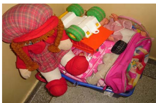
Figura 21. Brinquedos de cunho fantasista, encontrados na escola B.

Em uma das salas, parte dos brinquedos ficava em um armário baixo, junto com as apostilas e revistas e os demais brinquedos ficavam dentro de caixas de papelão sobre o armário. Apenas os brinquedos da caixa permaneciam à disposição das crianças. Na outra sala do pré todos os brinquedos ficavam fora do alcance das crianças, sendo estes guardados dentro ou em cima do armário da professora.