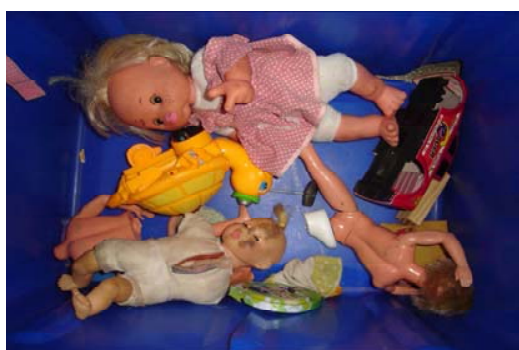
Figura 20. Estado de conservação de alguns brinquedos

Na escola B, as salas até que tinham brinquedos como bonecas, carrinhos, bolas, ursinhos, mas raramente as crianças os utilizavam, pois a quantidade era insuficiente, o estado de conservação também não era dos melhores e a maioria dos modelos voltava-se mais para o universo feminino e os meninos se recusavam a brincar com os mesmos.