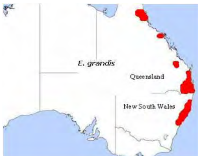
Figura 1. Área de ocorrência de Eucalyptus grandis na Austrália

MORA e GARCIA (2000) relatam que o E. grandis supera qualquer outra espécie de Eucalyptus pelo incremento volumétrico em condições ambientais adequadas, sendo a espécie do gênero mais plantada no Brasil e também pela sua plasticidade genética, muito utilizada na obtenção de híbridos e na clonagem de árvores selecionadas.