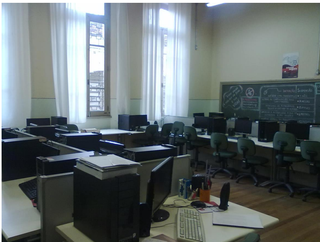
Figura 2: foto do laboratório de informática da Escola 2

Em visita feita a escola vimos que o laboratório de informática está em perfeito funcionamento. Possui 17 computadores, todos conectados à internet.