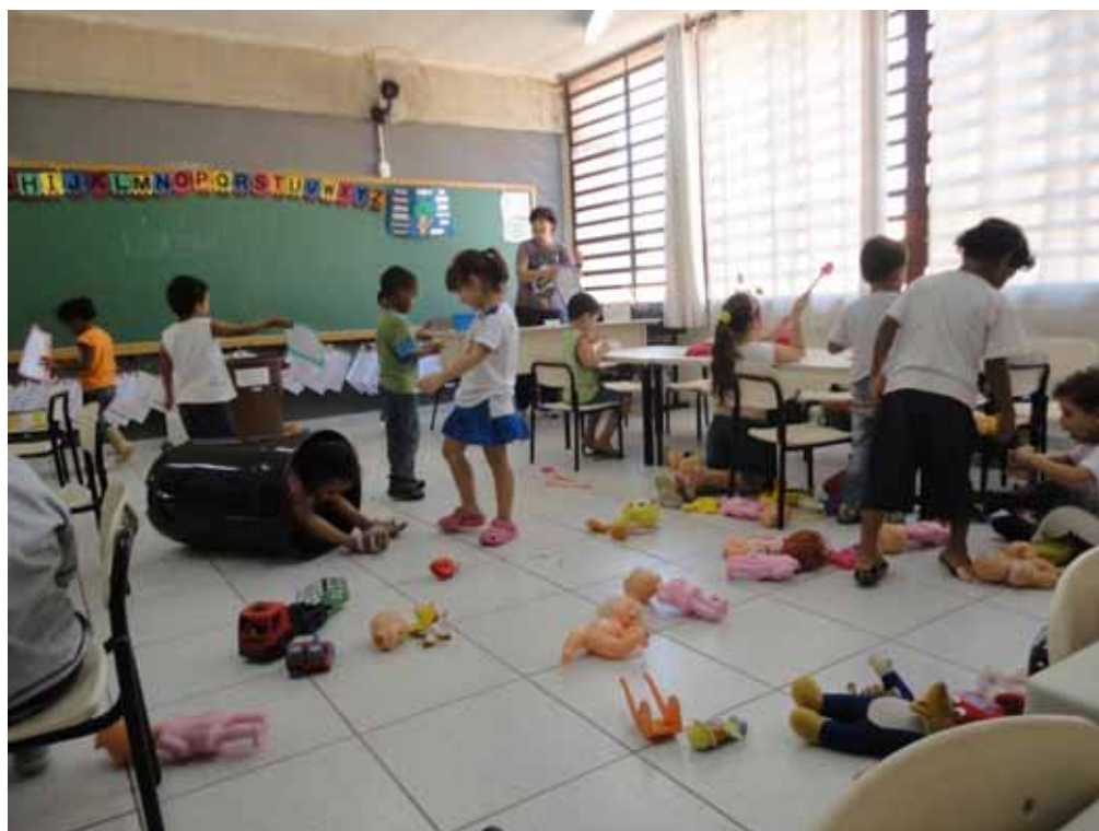
Imagem 24 – Alunos brincando na sala de aula enquanto a professora organiza a mesa