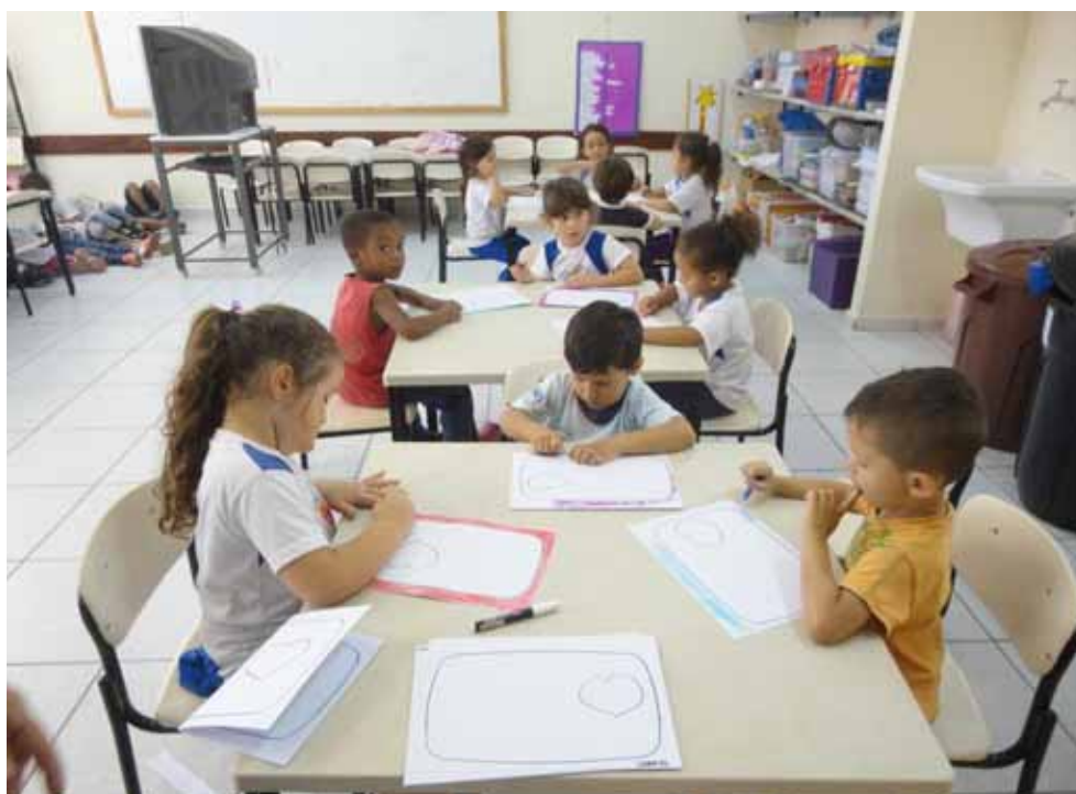
Imagem 3 – Atividade em sala de aula

Na Imagem 3, alguns alunos realizam uma atividade pedagógica na mesinha. Aqueles que já terminaram, estão assistindo um filme na televisão. Em contrapartida, aqueles que ainda não terminaram, não podem assistir à televisão. Observamos que a professora A colocou a televisão virada para aqueles que ainda realizavam a atividade na mesa, com intuito de não permitir que essas crianças olhassem ou assistissem ao filme. Os alunos não têm alternativa.