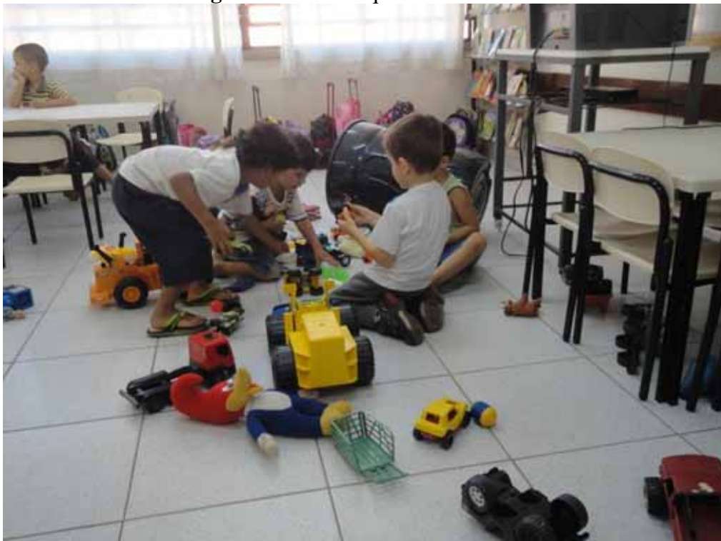
Imagem 21 - Os brinquedos dos meninos