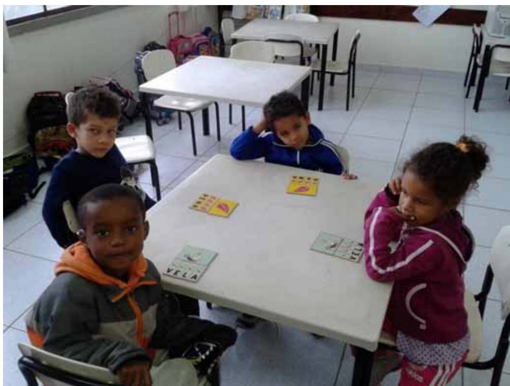
Imagem 9 – Atividade Bingo das Letras em sala de aula

Foi esta uma das poucas brincadeiras que percebemos uma interação entre a professora A com os seus alunos. Ela utilizou o jogo com o propósito de ensinar às crianças algo que já estava sendo trabalhando em sala de aula: as letras do alfabeto. A imagem 9, a seguir, mostra as crianças realizando esta atividade.