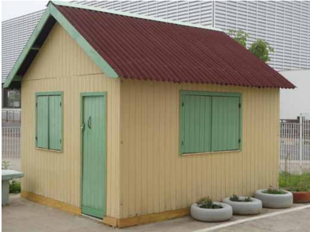
Imagem 13 – A Casinha da Escola X