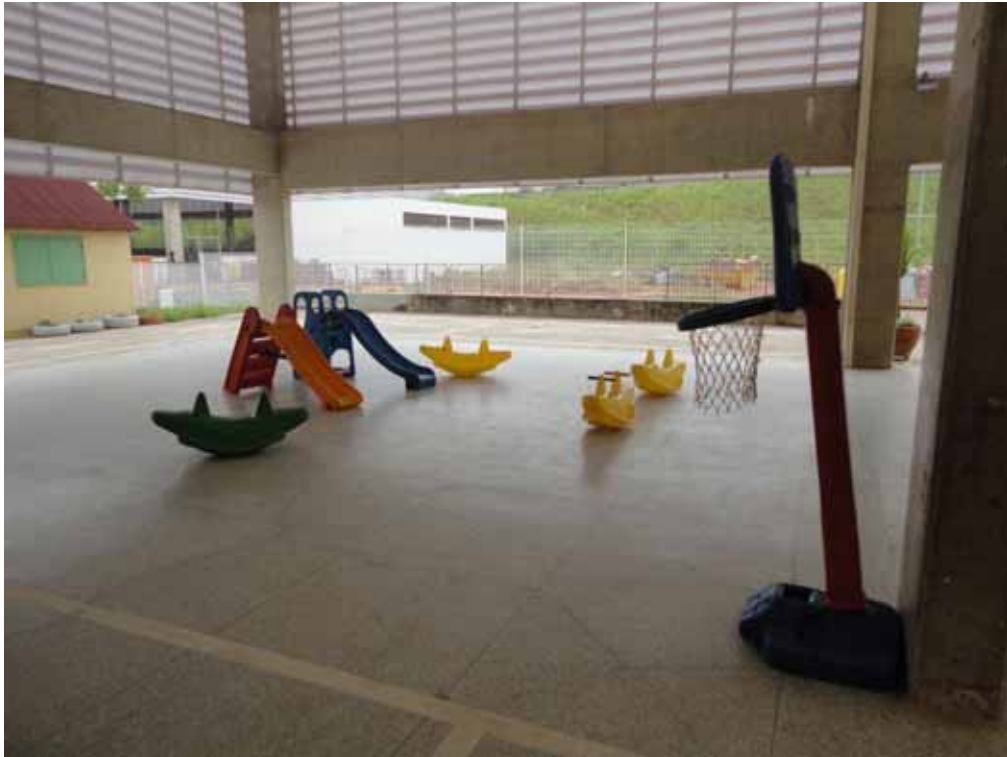
Imagem 10 – Brinquedos disponíveis para o uso das crianças no pátio.