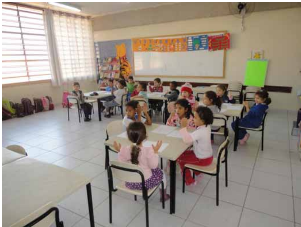
Imagem 1 - Organização da sala de aula