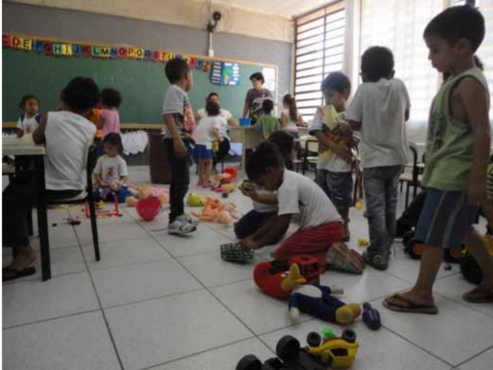
Imagem 6 - Brincando livremente na sala de aula