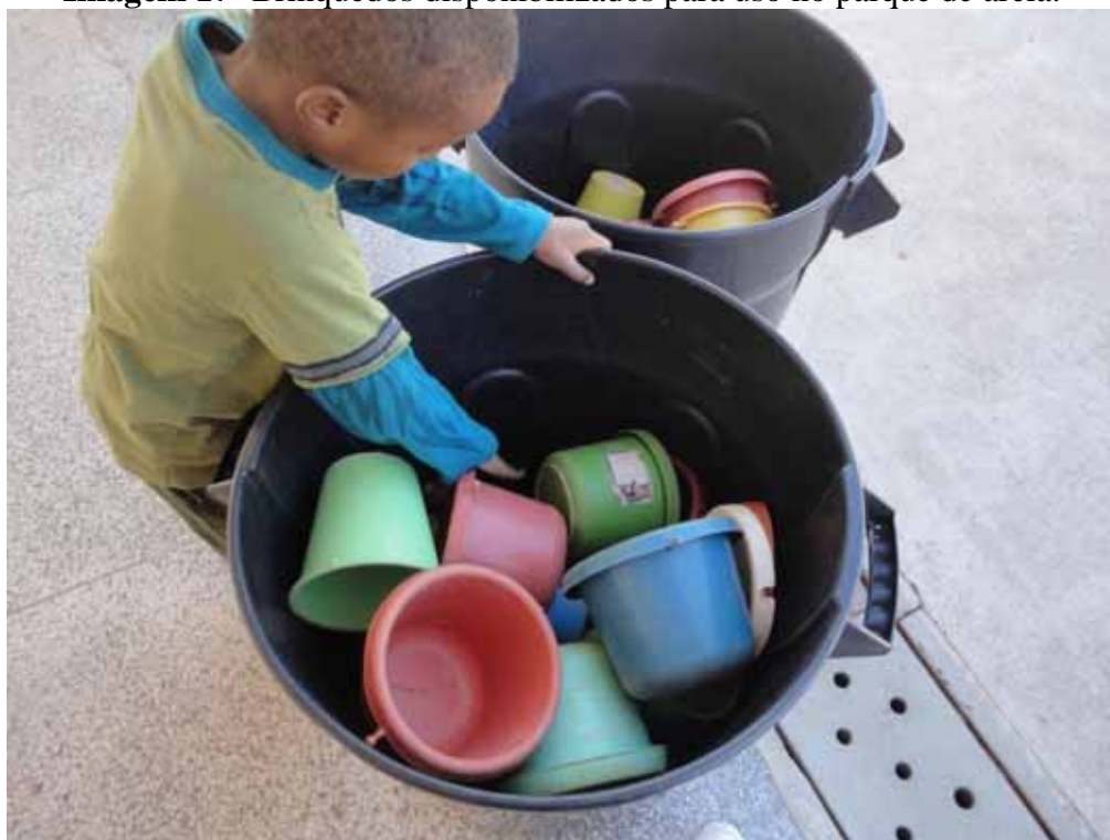
Imagem 17- Brinquedos disponibilizados para uso no parque de areia.