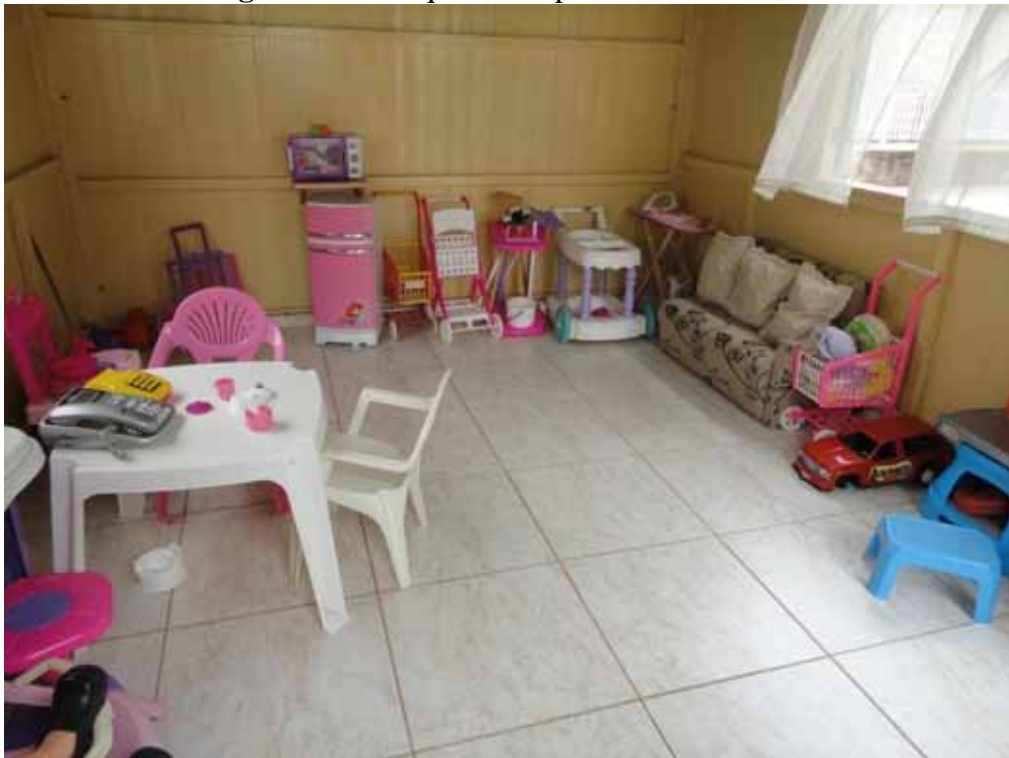
Imagem 14 - Brinquedos disponíveis na casinha 1