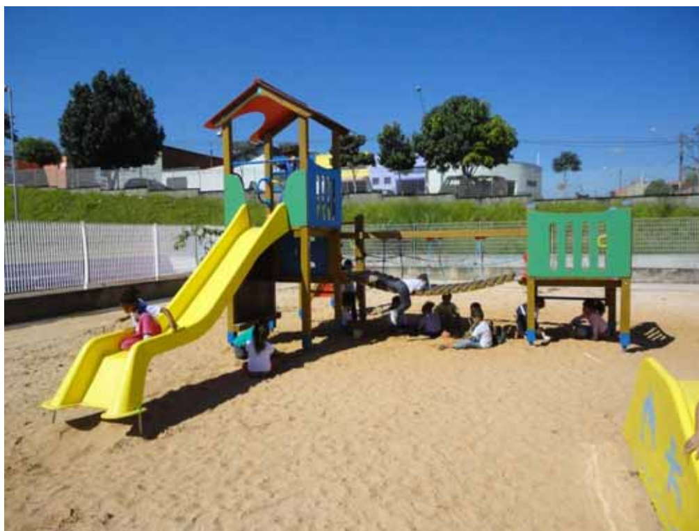
Imagem 5 - Brincando livremente no parque

Dos quarentas dias de visitação e observação nesta escola, as crianças realizaram algum tipo de brincadeira livremente em apenas vinte e dois dias. Eu digo ‘livremente’ quando a professora A não intervinha no processo de brincar das crianças. Elas brincavam com aquilo que era proposto e disponibilizado pela professora, mas seguindo sempre as normas e regras da professora, a qual mantinha a ordem e disciplinava, como nos fala Foucault (2010). Apresentaremos a seguir alguns desses momentos registrados em fotografias.