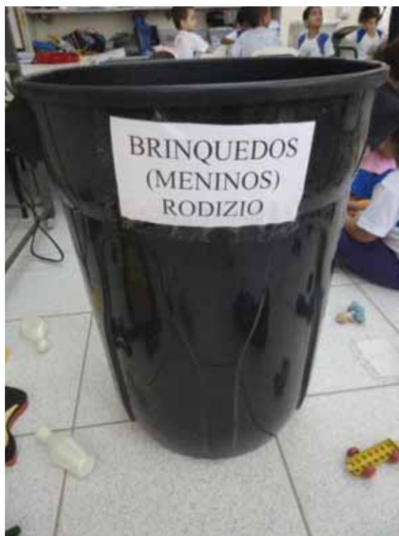
Imagem 19 - Balde Meninas