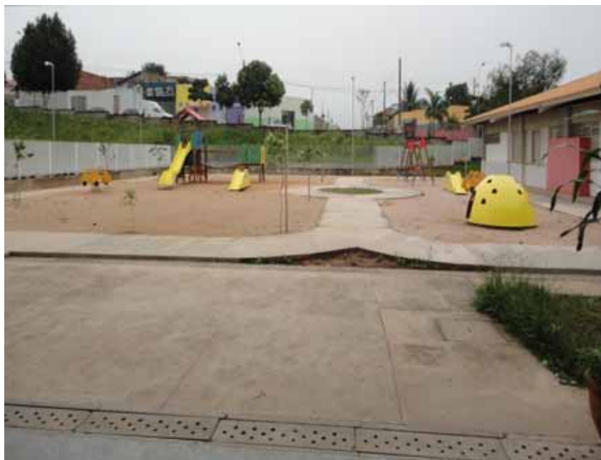
Imagem 16 – Parque da Escola X

Além dos brinquedos do pátio e da Casinha, ainda encontramos na área externa os brinquedos fixos do parque e aqueles que eram para este ambiente. Entre estes brinquedos, encontrávamos várias pás, peneiras, baldes menores, entre outros. A imagem 16 nos mostra o parque da escola e a imagem 17, os brinquedos disponibilizados.