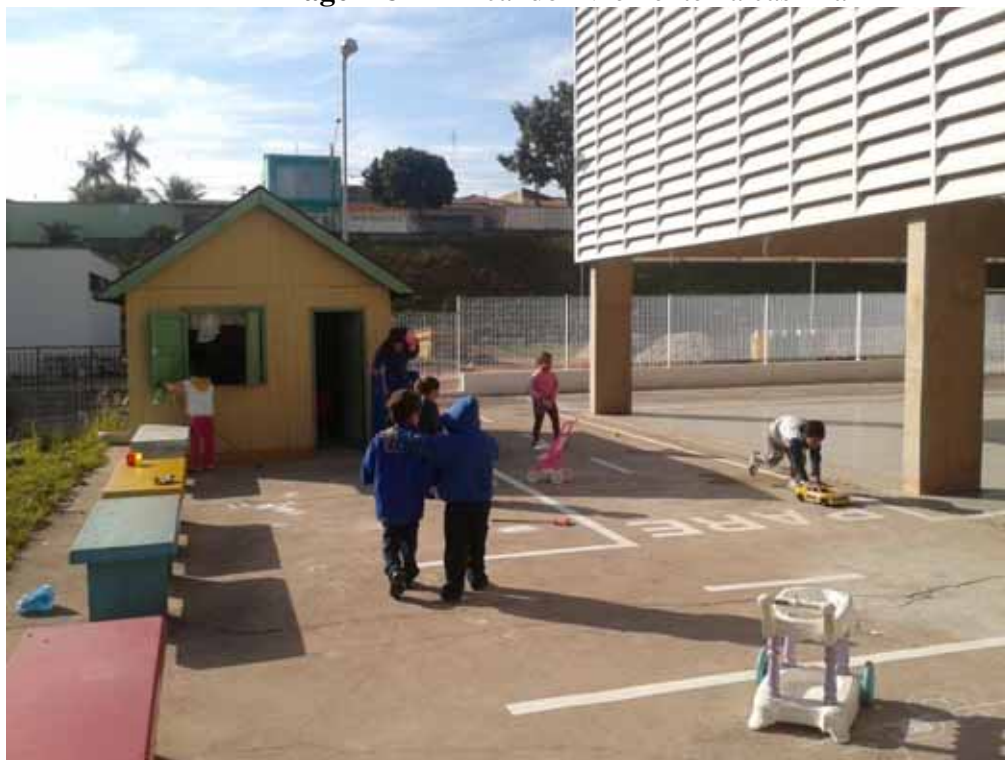
Imagem 8 - Brincando livremente na casinha