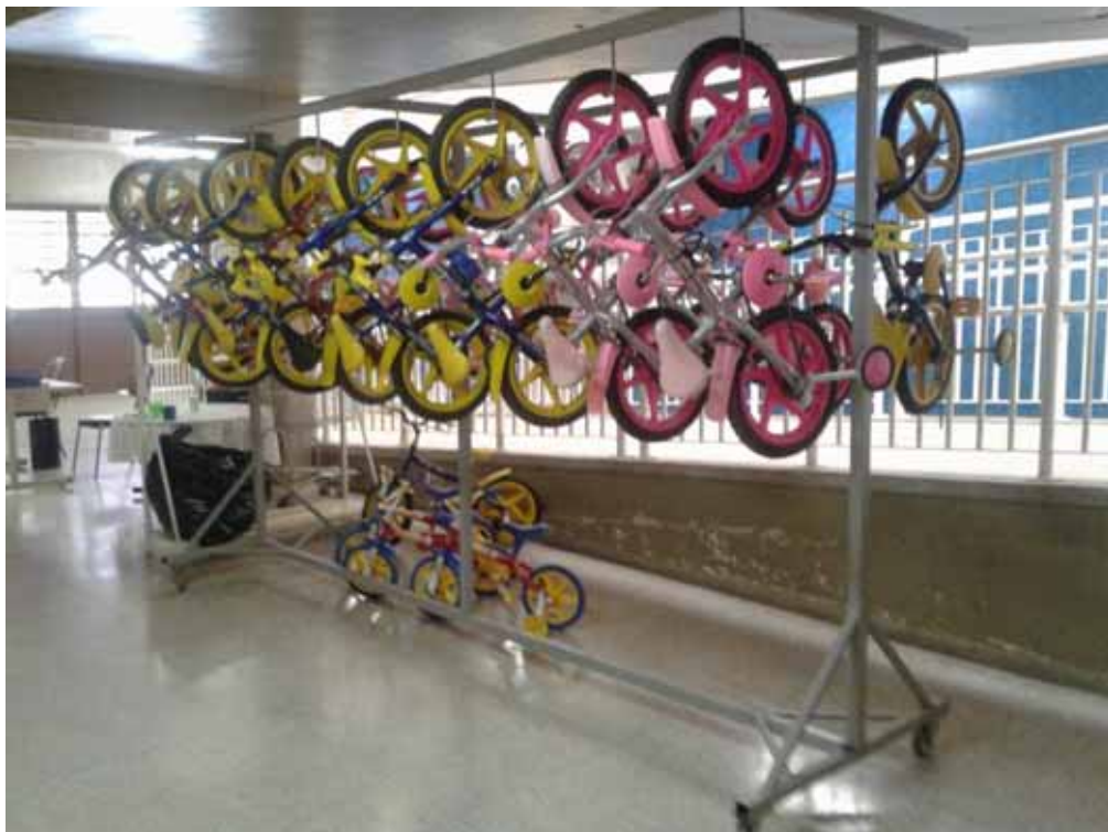
Imagem 11 – Bicicletas disponíveis para o uso das crianças no pátio.