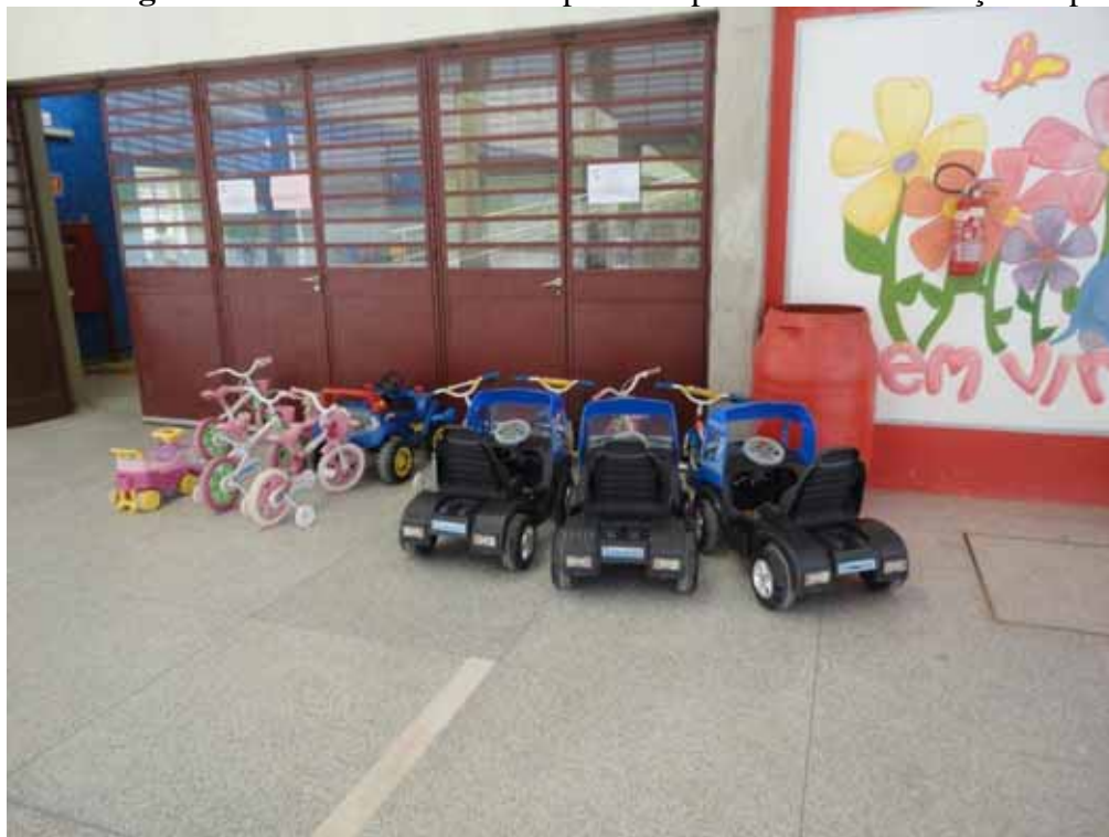
Imagem 12 - Caminhãozinhos disponíveis para o uso das crianças no pátio.