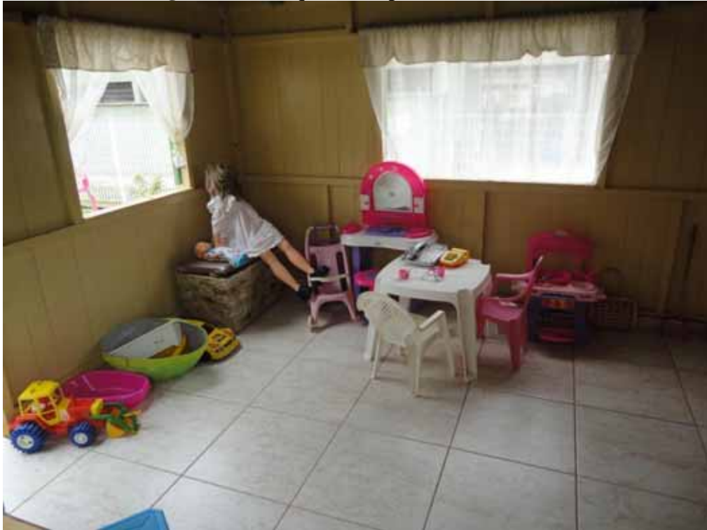
Imagem 15 - Brinquedos disponíveis na casinha 2