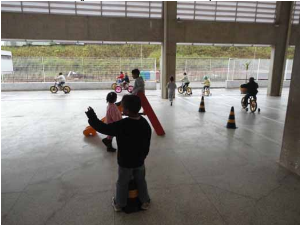
Imagem 7 - Brincando livremente no pátio da escola