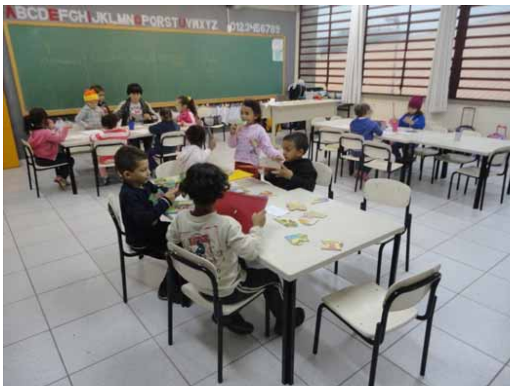
Imagem 22 – Sistema de rodízio