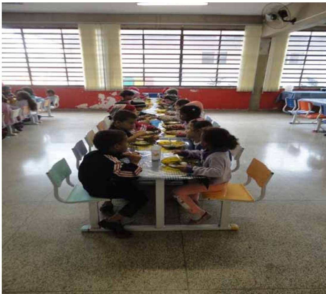
Imagem 4 - Todos os alunos, no refeitório, comendo ao mesmo tempo, sentados e sem fazer muita bagunça.