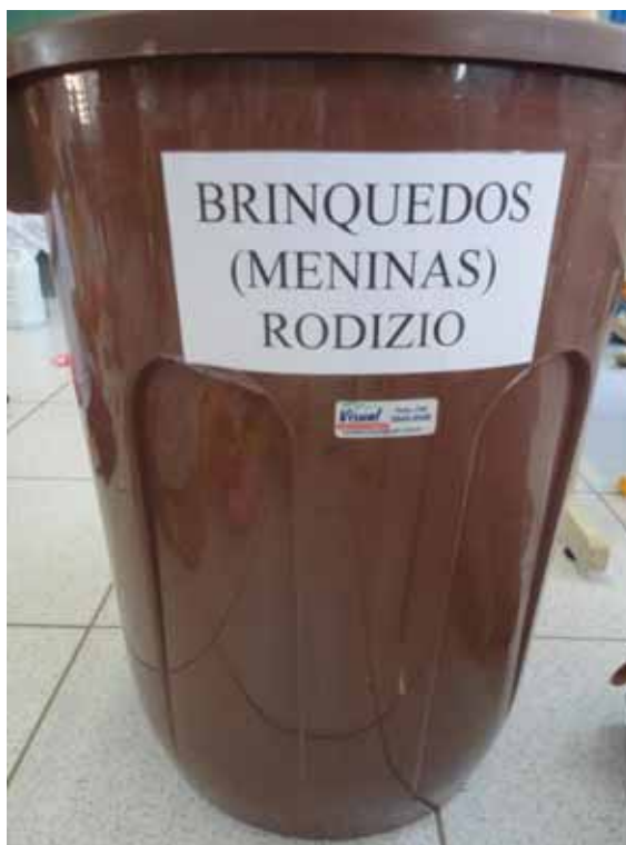
Imagem 18 - Balde Meninos