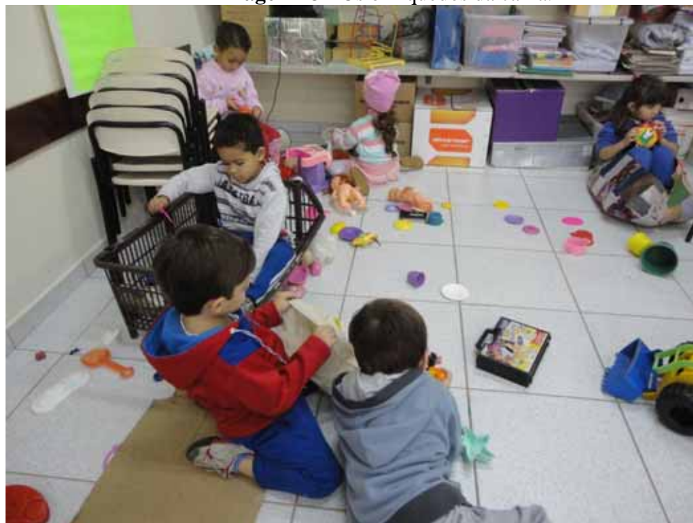
Imagem 23 - Os brinquedos da caixa.