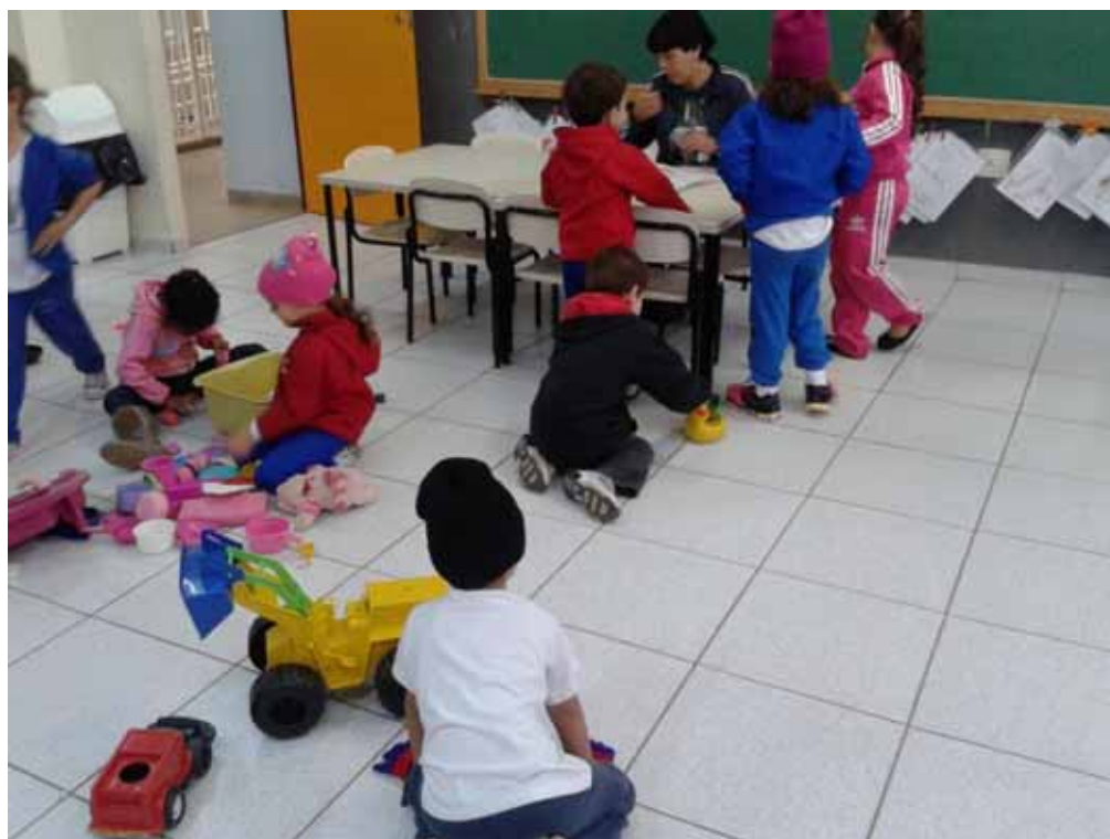
Imagem 25 – Alunos brincando na sala de aula enquanto a professora organiza atividades