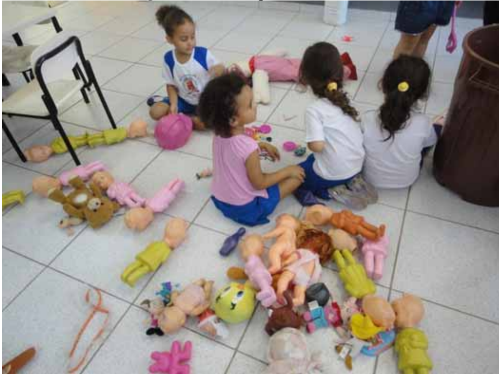
Imagem 20 - Os brinquedos das meninas