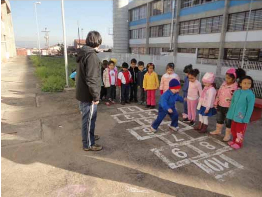
Imagem 2 - Brincadeira Amarelinha