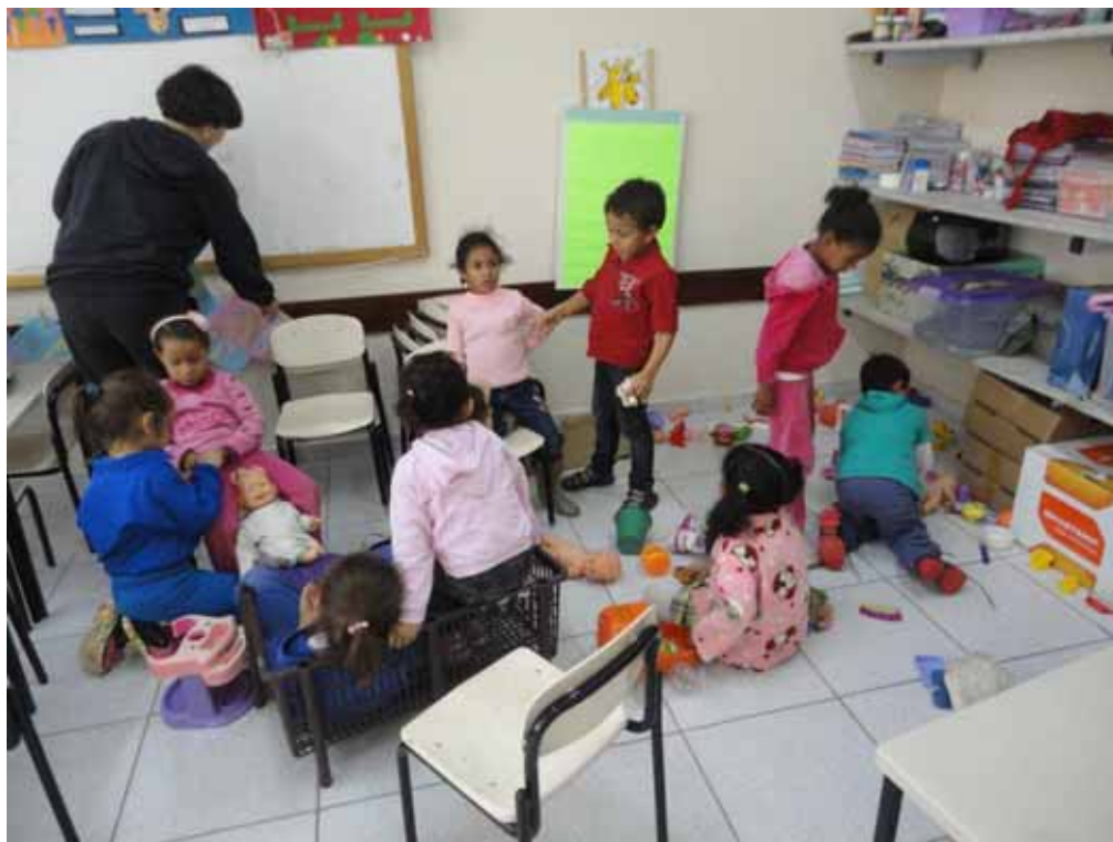
Imagem 26 – Alunos brincando enquanto a professora organiza varal de atividades.