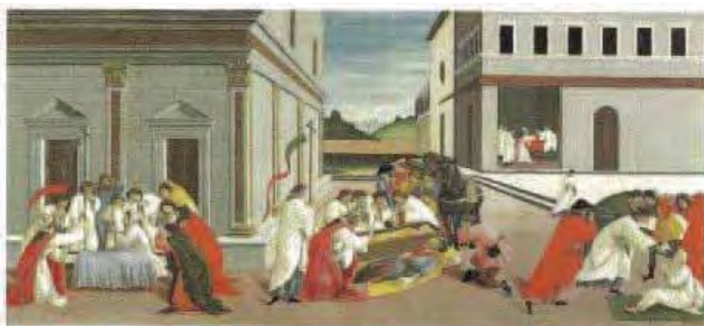
Os três milagres de são Zenóbio (1500-1505). Metropolitan Museum of Art, Nova Iorque.

Como se sabe, a família Médici foi grande provedora da arte de Botticelli, estabelecendo certos critérios para as obras que lhe encomendavam. No entanto, o artista, como homem intelectual do Renascimento e conhecedor das regras do Humanismo, entendia que tais regras deveriam ser aquelas ditadas pelos manuais de pintura, ou, diferentemente, deveriam ser orientadas pela Filosofia, Teologia, e, sobretudo, pelo legado antigo através da Literatura. Botticelli conseguiu imprimir, por meio desse conhecimento múltiplo, algo original em sua obra: conseguiu resgatar e apropriar-se do repertório dos antigos sobre a natureza, voltando-se aos temas clássicos que permearam boa parte de sua produção.