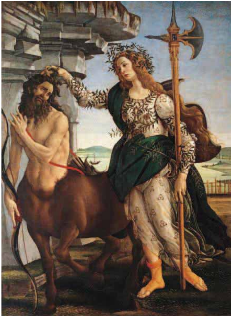
Minerva e o centauro, 1485-1486, Louvre, Paris