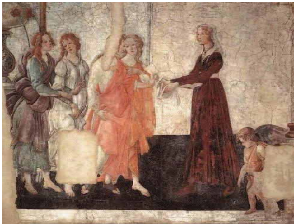
Afresco sobre alegorias núpcias na Vila Lemmi, 1485-1486, Louvre, Paris