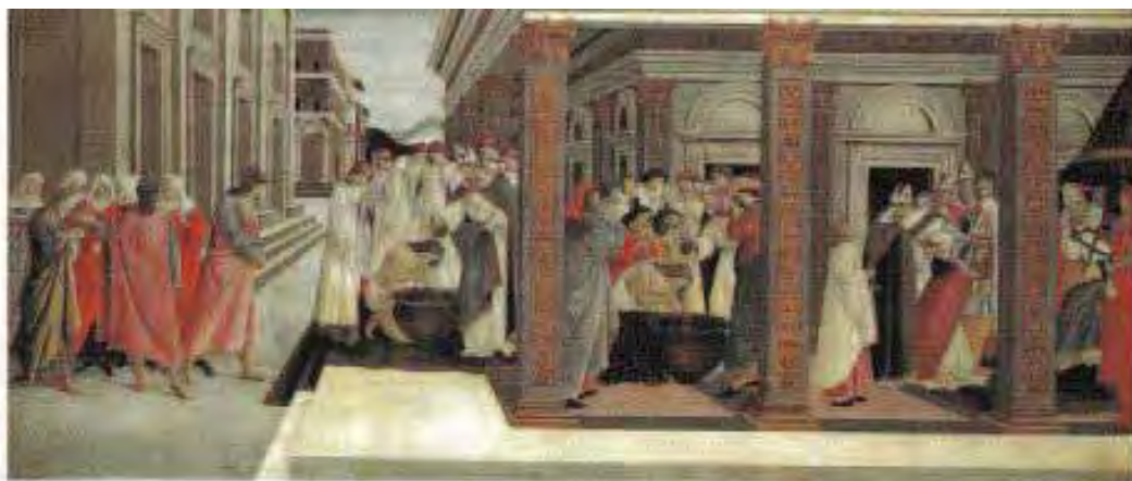
Cenas da Vida de São Zenóbio (1500-1505). National Gallery. Londres

em Florença no final do século XV, Girolamo Savonarolla (1452-1498). Tal censura teria ocorrido diante da intensa retomada pelo pintor de temas religiosos, como é o caso das obras que ilustram a vida de São Zenóbio (1500- 1505), que narra a história do primeiro papa de Florença, ocorrida mais de mil anos antes. Percebemos que essa última fase desperta um interesse particular em Argan, uma vez que o teórico observa que é nela que Botticelli se define, ou seja, que o pintor florentino é capaz de conciliar as influências teóricas e técnicas, as quais examinaremos adiante.