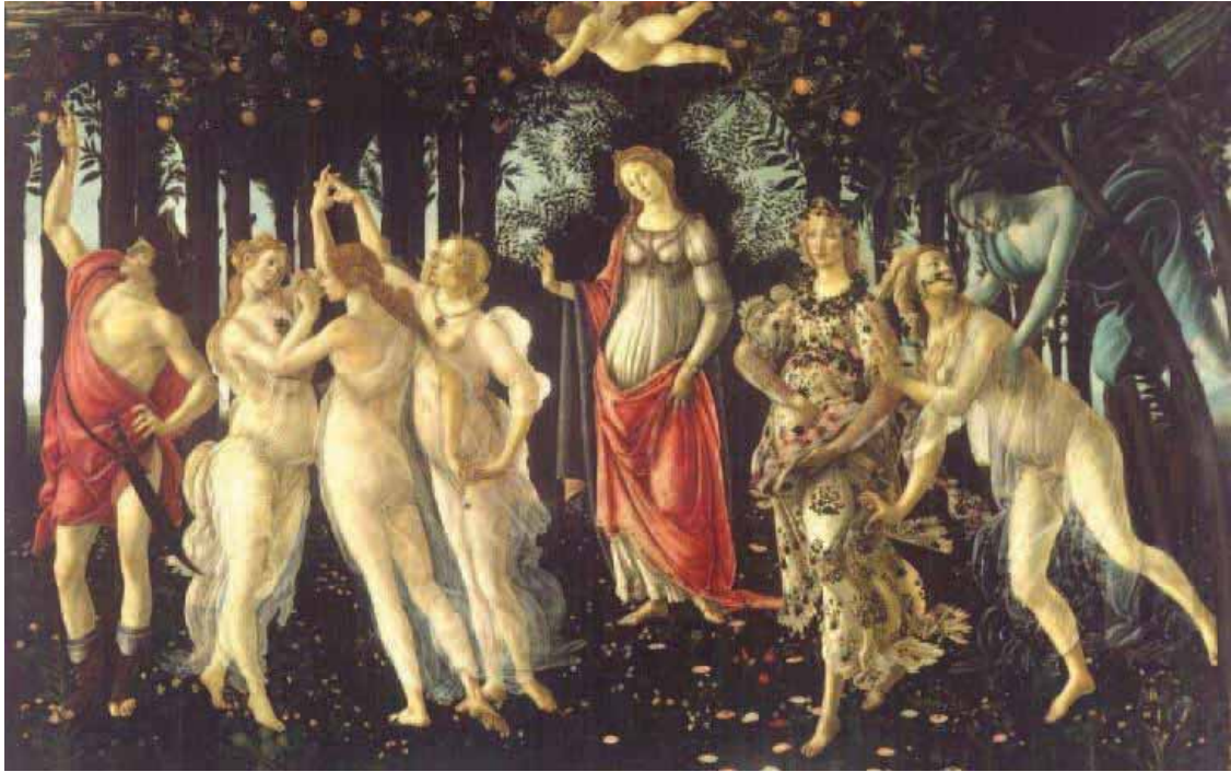
A primavera, 1482, Galleria degli Uffizi, Florença