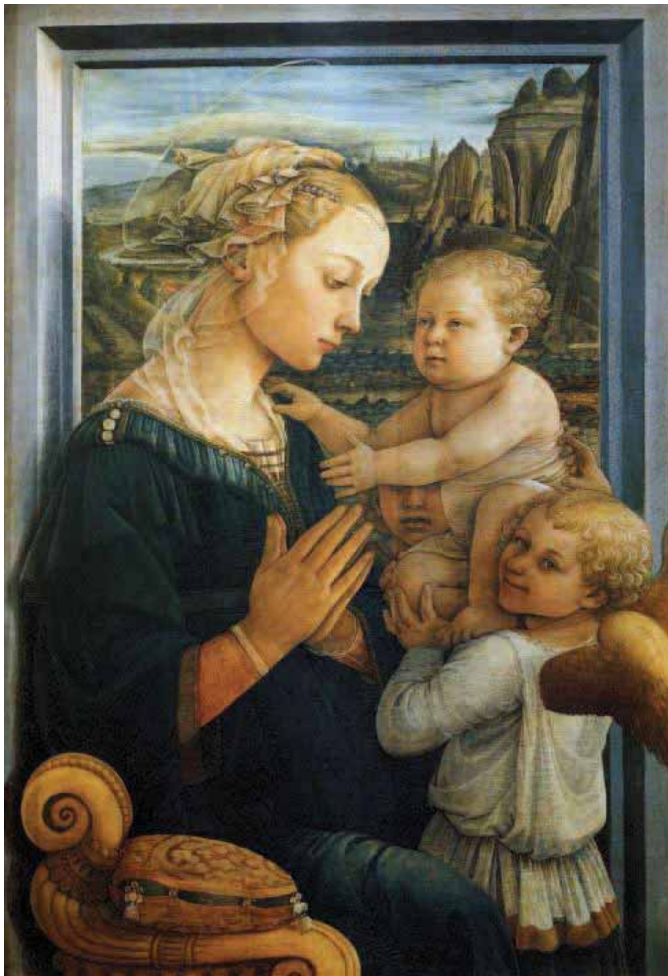
A virgem e o menino (1465) Galleria degli Uffizi, Florença.

Tal intimidade com o divino a partir das obras religiosas domésticas foi recomendada no início do século XV pelo pregador dominicano Giovanni Dominici na Regole Del governo di cura familiare :