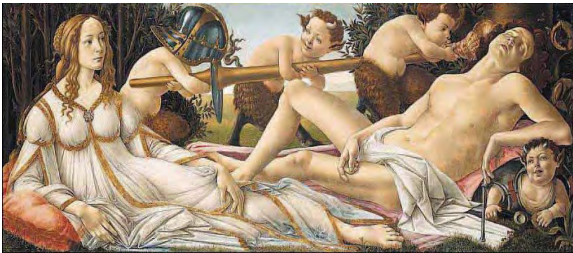
Vênus e marte. 1482, Galleria degli Uffizi, Florença