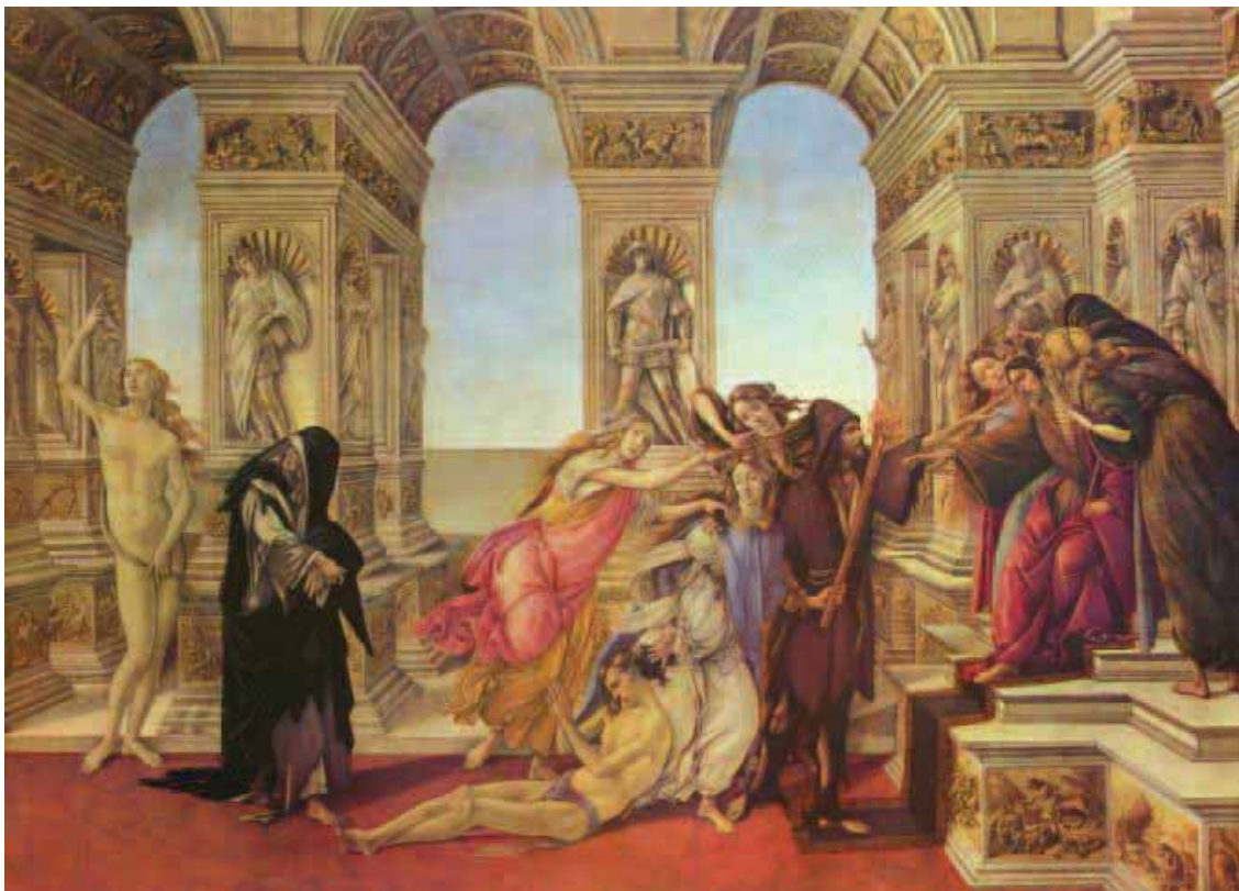
Calúnia (1495). Galleria degli Uffizi: Florença.

Argan aponta que Botticelli, inspirando-se no mestre grego Apeles, escolheu para si um ideal de graça venusta , que entende a arte como harmonia de linhas e cores, empregando em certas obras uma imitação de uma ideia de belo, e não de formas históricas, instigando-nos no questionamento sobre o que é o belo ideal para o artista. Para Argan, os elementos que compõem uma pintura são o resultado de uma inspiração propriamente teórica, e não apenas técnica. A obra Calúnia , por exemplo, apresenta elementos formais que resultam da especial inspiração do pintor no mestre antigo Apeles, uma vez que Botticelli se manteve atento aos artifícios da pintura antiga que agregavam a graça ( venusta ) e a harmonia entre as cores e linhas à pintura. O belo de Botticelli, segundo Argan (1999, p. 214), está afastado e quase destituído de substância corporal: a beleza, a mesma beleza ficiniana, é um distanciamento da realidade física, uma misteriosa transferência da coisa na imagem, um processo que implica um artifício, uma poética moldada em procedimentos alegóricos carregados de preceitos humanistas.