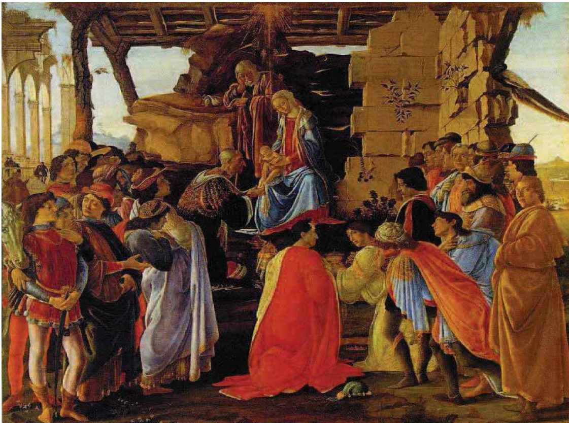
A adoração dos magos. 1465-1467. Galleria degli Uffizi: Florença.

Na primeira fase, Botticelli também se dedica à representação da Virgem Maria, que na maioria das vezes é figurada junto do menino Jesus e de anjos. Esse tema mostra claramente a fidelidade do pintor aos ensinamentos de seu mestre Fra Filippo Lippi, que, por sua vez, exercia atividades religiosas. Não demorou muito tempo, após os cinco anos que esteve vinculado ao ateliê de Lippi, para que Botticelli inaugurasse seu próprio estúdio em Florença, por volta de 1470. A partir de então, Botticelli salta em direção às características próprias, e se apresenta receptivo às novas tendências que acreditamos ser o ponto de transição para sua segunda fase. O artista permanece de prontidão à necessidade de se pintar figuras de temática bíblica e até mesmo retratos; porém, solitariamente, começa a introduzir em suas representações alguns elementos que denotam originalidade. Tais elementos atingirão seu ápice por volta da década de 1480, no Quattrocento, quando, por meio deles, Botticelli finalmente conquista a apreciação dos mecenas, sobretudo, da família Médici.