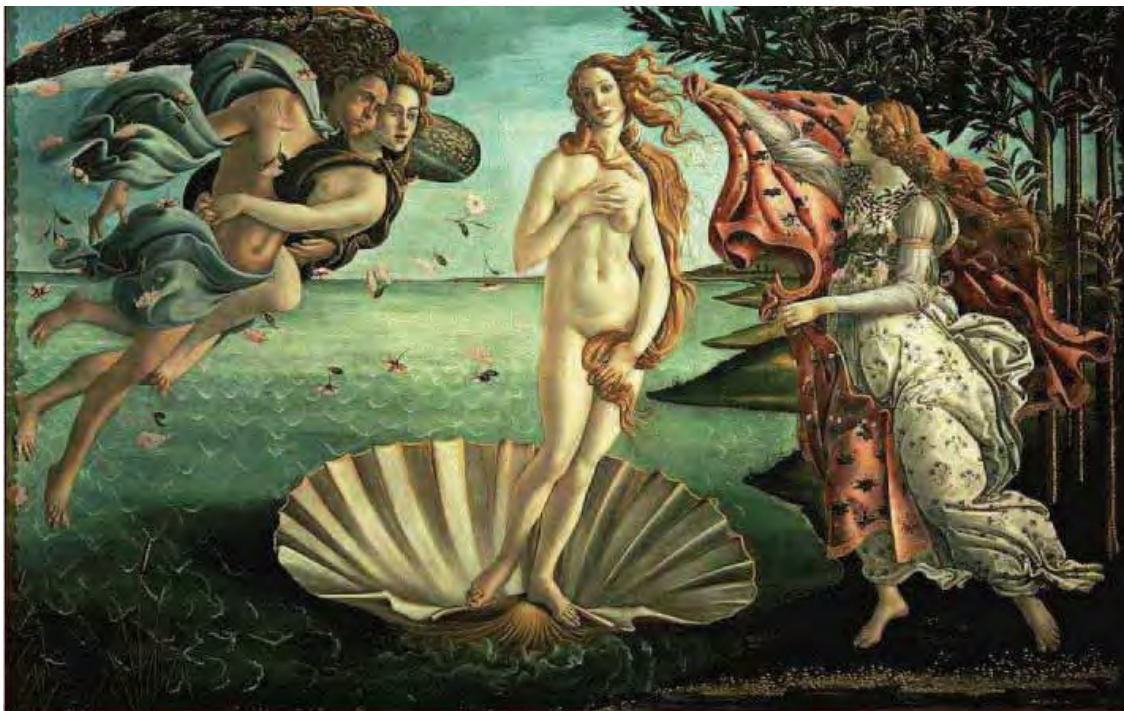
O nascimento de vênus, 1483, The National Gallery, Londre

Durante o período que estabelecemos como sendo a segunda fase da obra de Botticelli, percebemos uma ênfase ao conteúdo que buscava resgatar a temática e a natureza grega, o que gerava uma associação da arte plástica à filosofia neoplatônica. As representações de figuras mitológicas, que conotavam um sentido profano à época, pretendiam resgatar a natureza grega, transmitindo um conteúdo filosófico que os intelectuais discutiam nos encontros de reflexão, conteúdo capaz de colocar na mesma chave a teologia órfica da Antiguidade e os elementos da moral cristã, os quais estudaremos mais detalhadamente adiante.