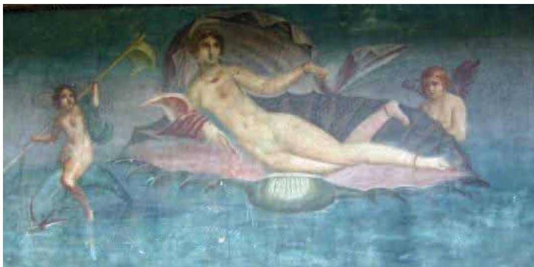
Vênus Anadiomena se trata de uma figuração de encontrada nos murais de Pompéia, e acredita-se que foi pintada por volta do século I a. C.

uma “estética” como prefere Argan (1999, p. 206). O referido autor inicia seu estudo acerca da pintura de Botticelli sugerindo que o pintor tenha participado de correntes helenizantes que surgiram em meio à cultura florentina do século XV, uma vez que essas correntes utilizavam fontes literárias antigas, das quais extraíam o tema das obras de arte produzidas por seus artistas, como no caso de Botticelli, que realizou uma ecfrase do pintor antigo Apeles, utilizando o conceito da Vênus anadiomena para compor a obra Calúnia . Com base nessas sugestões, Argan chama a atenção para a importância do conceito envolvido nas produções artísticas de Botticelli, pois o pintor realizava uma poética com sofisticação, a partir de uma escolha minuciosa de imagens que expressem uma ideia, um tema conveniente. O rigor é próprio do “rito que evoca o mito” (ARGAN, 1999), sem o qual não seria possível a existência de imagens, uma vez que a pintura tem a função de descobrir e revelar as ideias por meio dos símbolos, isto é, das imagens.