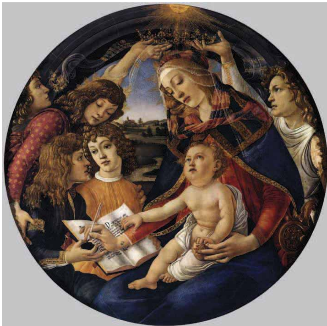
A virgem do Magnificat (1480-1482). Galleria degli Uffizi, Florença

Após termos elencado os principais aspectos que envolviam o fazer artístico de Botticelli, devemos nos empenhar em realizar nossas considerações a respeito de sua obra, reafirmando muitas das discussões realizadas até este ponto. Pretendemos, então, neste capítulo conclusivo, tomar a obra A virgem do magnificat como porta de entrada para um universo teórico, ou seja, a partir da análise desta pintura, almejamos reiterar a opinião que situa Botticelli como um autêntico artista e intelectual do Renascimento, bem como apontar os elementos da pintura que figuram o conceito de graça.