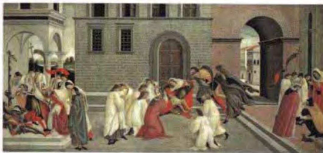
Os três milagres de São Zenóbio (1500-1505). Metropolitan Museum of Art. Nova Iorque