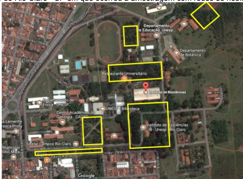
Figura 1 - Localização dos seis pontos (destacados em amarelo) no campus da Unesp de Rio Claro - SP em que ocorreu a amostragem com redes de neblina.