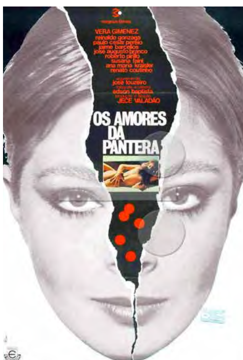
Cartaz de Os Amores da Pantera , de Jece Valadão, baseado na obra de Louzeiro