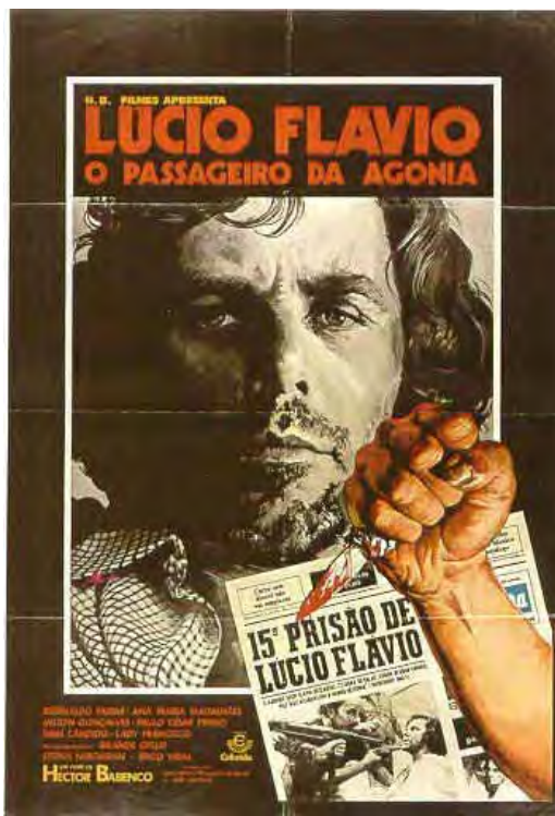
Cartaz de Lúcio Flávio, o Passageiro da Agonia , com referências jornalísticas

Natural do Estado do Maranhão, José Louzeiro está entre os mais famosos e importantes repórteres da crônica policial no país, começando sua vida como jornalista na década de 50 e se destacando nos decênios seguintes. Louzeiro passou por distintas redações, transitando basicamente entre Rio de Janeiro e São Paulo, com passagens pela Folha de S. Paulo , Jornal do Brasil , O Globo , dentre outros. Essencialmente, trabalhou como repórter policial, uma espécie de “repórter subterrâneo”, com a missão perigosa de penetrar o universo de figuras marginalizadas. Deriva daí seu contato com prostitutas, cafetões, bandidos, bicheiros, e toda uma seleta “fauna” que costuma concentrar-se em ambientes um tanto distantes dos olhares das classes mais abastadas. Louzeiro tem seu foco no submundo, tal como fazia um João Antonio, notável menestrel da vida da “gentalha”. Entretanto, não era apenas a miséria dos ambientes e personagens que Louzeiro investigava que explica as razões de sua obra posterior, sobretudo seus romances-reportagens. O contexto político em que escreveu – sobretudo a partir do AI-5 – era pouco ou nada afeito à liberdade de expressão, e a figura do repórter policial passava a ter contato não apenas com crimes corriqueiros e banais, mas também com crimes realizados por grupos de extermínio, e chacinas perpetradas por