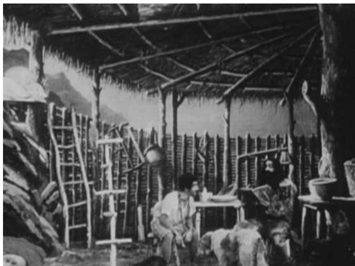
Fotograma do Robinson Crusoe de George Méliès: no início era a adaptação

Mas voltemos a Griffith, por ora. Griffith há muito possui o status de detentor da paternidade da linguagem cinematográfica, uma vez que, sendo ou não o primeiro autor de uma miríade de procedimentos técnicos, teve o indelével mérito de reuni-los numa só obra, ainda na década de 1910, e a partir daí o cinema começava a ser sistematizado. Dessa vez, não mais como uma reunião simplória de planos, como sequências por vezes bagunçadas, mas como linguagem autônoma. Considerando o pioneirismo e a amplitude de seus empreendimentos, ninguém doou tanto à linguagem do cinema como Griffith. Se razoável quinhão da técnica que caracterizaria a obra de Griffith parece ter sido desenvolvida nos anos anteriores à Primeira Guerra, foi justamente em 1914, ano em que estourou conflito, que surgiu a O Nascimento de uma Nação ( Birth of a Nation ).