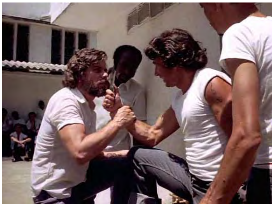
Pouca ação na prisão: opção por fluidez e poucas digressões

No entanto, é possível afirmar que a exclusão das informações que surgem na permanência de Lúcio na prisão diminui em alguma medida a riqueza do personagem. Na prisão, Lúcio pinta quadros e chega a falar sobre arte, além de praticar leituras. Ali mostra-se também mais culto, um ser humano complexo, no limiar entre civilidade e barbárie. Treina sua técnica de pintura ostensivamente e ao mesmo tempo, acossado, a cada segundo tem que se preocupar com sua própria existência, ameaçada constantemente.