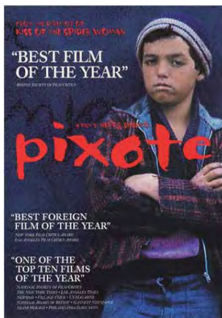
Cartaz em língua inglesa anunciando Pixote como “o melhor filme estrangeiro do ano”