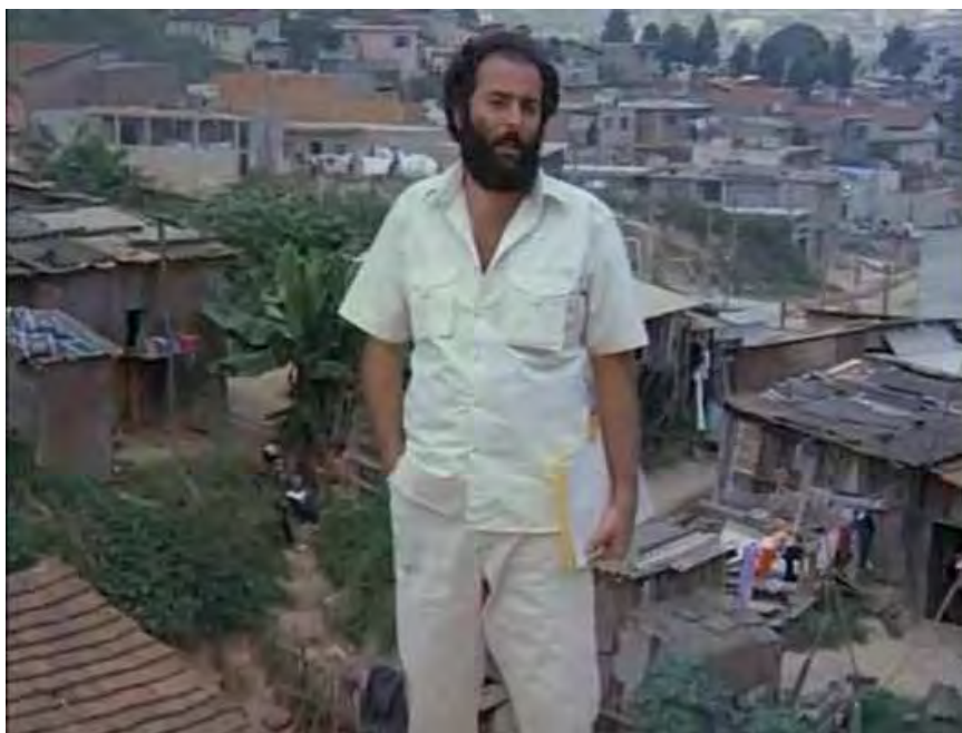
Babenco comenta a realidade brasileira e os meninos de rua, no início do filme

Algumas semelhanças são dignas de menção; por exemplo, há uma viagem importante de Dito no romance, que deixa o Rio de Janeiro e vai de trem a São Paulo. No filme de Babenco, existe também uma viagem, com o mesmo propósito de encontrar a prostituta Deborah a pedido do bandido Cristal, porém o trajeto é invertido, de São Paulo para o Rio de Janeiro. Assim, percebe-se que há uma espécie de “tática de afastamento” ou, ainda, uma “tática de dessemelhança”, como se o filme buscasse se afastar do molde literário original (o romance de Louzeiro) ou recriar o conteúdo do filme conforme outras expectativas. A mudança de rota na viagem que há no filme, rumando ao Rio de Janeiro, permite alguns momentos de contemplação da beleza das praias cariocas, algo inexistente no “cenário sombrio” do livro. Da mesma forma, e já dissemos que Pixote está longe de se pretender uma adaptação num sentido mais estrito do termo, não há nenhuma Camanducaia no filme.