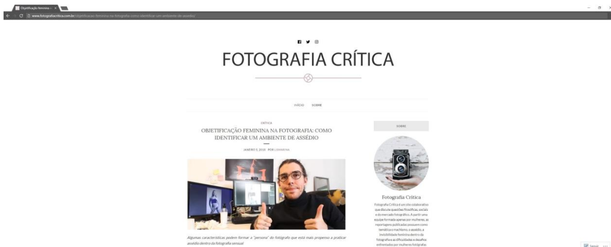
Figura 1 - Print screen da página inicial do site

A plataforma de publicação escolhida foi o Wordpress , pela facilidade da inclusão de diversos colaboradores, por possuir um layout responsivo e uma ótima indexação no Google, o que faz com que o site seja encontrado facilmente pelos leitores. Para garantir um destaque maior às imagens, foi escolhido um layout mais limpo, com bastante uso de branco e espaçamento entre um elemento e outro. Também foi criado um logo para o site e uma vinheta para o canal do Youtube com os mesmos princípios: um obturador minimalista foi escolhido para remeter à fotografia e a cor rosa antigo para remeter à produção de conteúdo feita por mulheres.