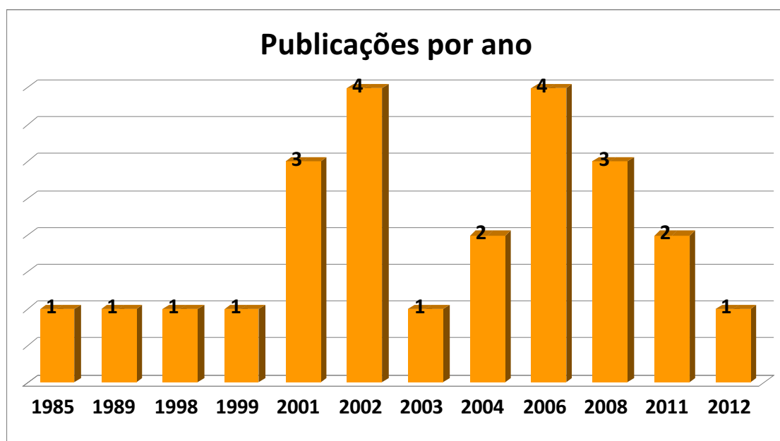
Gráfico 1 – Indicação do número de pesquisas realizadas por ano.

Quanto ao número de dissertações, teses e artigos publicados por ano, o Gráfico 1 abaixo demonstra que com relação ao período de publicação das pesquisas, estas se encontram entre o ano de 1985 e 2012. Com o total de oito publicações, 2002 e 2006 foram os períodos em que mais se publicou a respeito da Paternidade. Seguindo, com o total de seis publicações, 2001 e 2008 ocuparam o segundo lugar no que se refere aos anos de maior publicação sobre o tema. Os anos de 2004 e 2011 ficaram em terceiro lugar, com dois artigos publicados sobre a Paternidade, em cada ano. Em último lugar, com apenas uma publicação, estão os anos de 1985, 1989, 1998, 1999, 2003 e 2012.