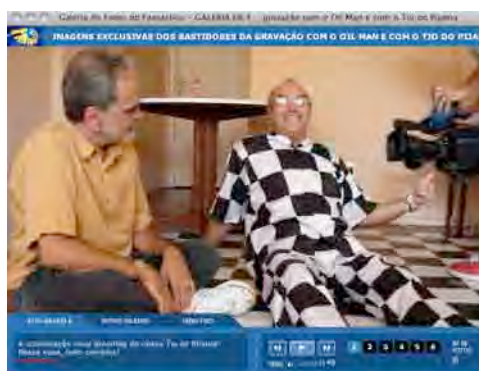
Figura 19: Tio do Pijama 2.

Estas imagens fazem parte de uma sessão chamada “Galeria de Fotos do Fantástico”, comum nas laterais do blog Me Leva Brasil em 2008 e que hoje já não fazem parte de seu layout .