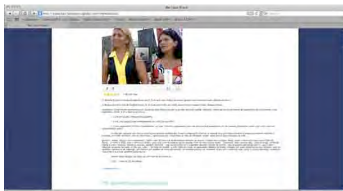
Figura 16: Parte central do Blog Me Leva Brasil.

Na parte central do blog, estão distribuídos os posts de Maurício Kubrusly, que podem vir acompanhados de comentários do leitor e que geralmente são apresentados com vídeos ou fotos sobre as reportagens do Me Leva Brasil.