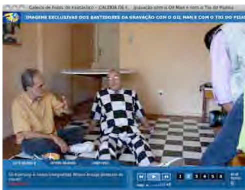
Figura 18: Tio do Pijama 1.