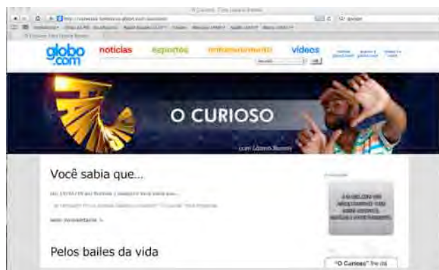
Figura 12: Blog O Curioso.

Outro exemplo desse tipo de storytelling é o blog “O Curioso”, com o ator Lázaro Ramos, que representa um outro quadro televisivo do programa “Fantástico”, criado e exibido em 2010. No momento da escrita deste texto, “O Curioso” ainda não havia sido exibido na TV, mas já contava com o blog para registrar as gravações feitas e divulgar o quadro. “O Curioso” possui algumas semelhanças com o quadro “Me Leva Brasil”: ambos fazem parte do programa “Fantástico”, são quadros de reportagens produzidos em diferentes lugares do Brasil e contam com um blog como canal de comunicação com o público. No entanto, “O Curioso” inclui teledramaturgia e informações curiosas sobre diversos temas. Já o quadro de Kubruly, que no ano de 2010 completa 10 anos, limita-se a entrevistas sobre histórias locais, fatos e personalidades extravagantes, compondo um retrato da “fantástica gente de todos os cantos” do Brasil.