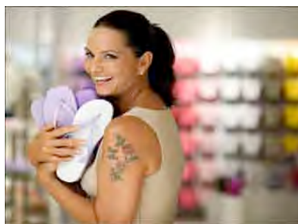
Figura 1 e 2: Propaganda chinelos Havaianas.