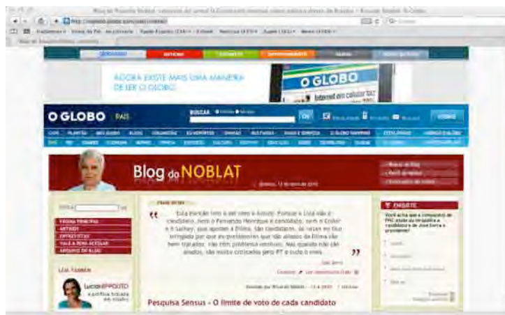
Figura 7: Blog do Noblat.

Um outro tipo de definição dos blogs pode ser funcional, o que implica considerar os weblogs como um meio de comunicação que é utilizado para divulgar informações. Os blogs jornalísticos são um exemplo disso. Muitos deles nasceram de jornalistas que buscavam uma mídia alternativa que lhes desse mais liberdade de expressão. Foi assim no Brasil com o blog sobre política de Ricardo Noblat. Em 2005, ele se destacou como blogueiro durante o desenrolar do escândalo político do “mensalão”, de modo que seu blog foi até fonte jornalística para outros meios (PENTEADO; SANTOS; ARAÚJO, 2006). Noblat oferece uma gama de informações diferenciadas: crônicas, discursos, documentos, editoriais, histórias exemplares, notas oficiais e reportagens, etc.