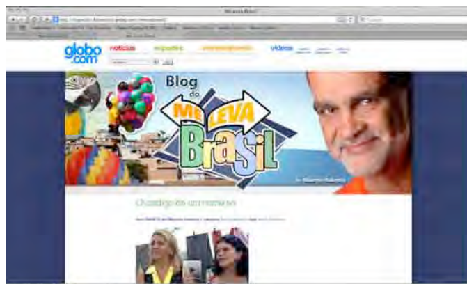
Figura 15: Parte superior do Blog Me Leva Brasil.