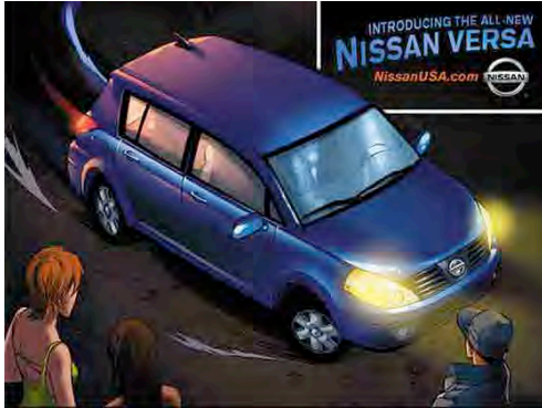
Figura 4: Propaganda de carro.

No site da NBC, os fãs tinham acesso a vários conteúdos de Heroes , como por exemplo, o 9th Wonders versão online . Antes de cada história, aparecia sempre uma propaganda de carro da Nissan, um dos patrocinadores da série.