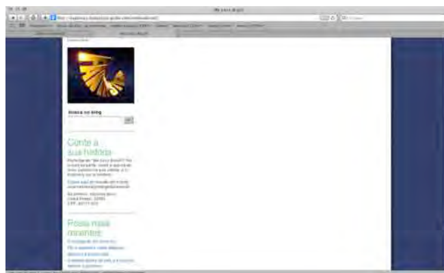
Figura 17: Parte inferior do Blog Me Leva Brasil.

um calendário, e na parte central inferior, uma ferramenta de busca na web e no site globo.com .