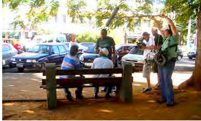
Figura 14: O Curioso encontra novas paisagens em Goiânia.

O uso de fotografias mostrando a produção do quadro televisivo reforça o aspecto midiático desse storytelling , que não é por exemplo pessoal.