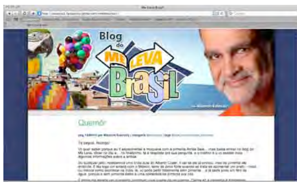
Figura 13: Blog Me Leva Brasil.