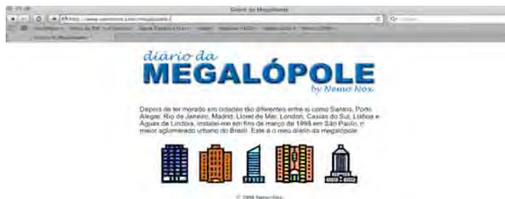
Figura 8: Blog Diário da Megalópole.

surgiu foi um diário. Renato Pedroso Júnior, conhecido como Nemo Nox, resolveu contar suas histórias em São Paulo em 1998, cidade para onde recém havia mudado. “Diário da Megalópole” era o primeiro blog brasileiro a entrar para o Blogosfera.