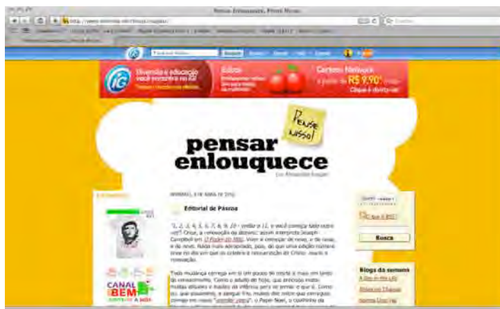
Figura 10: Blog Pensar Enlouquece.