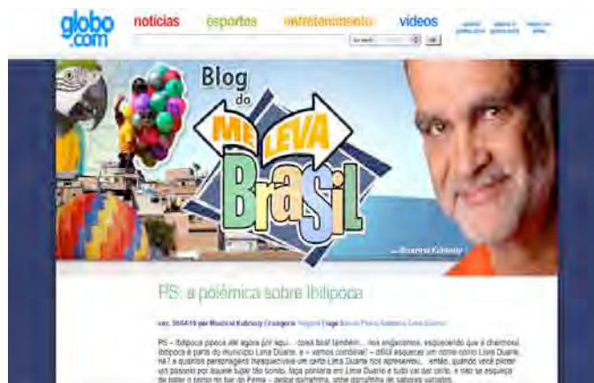
Figura 6: Blog Me Leva Brasil.