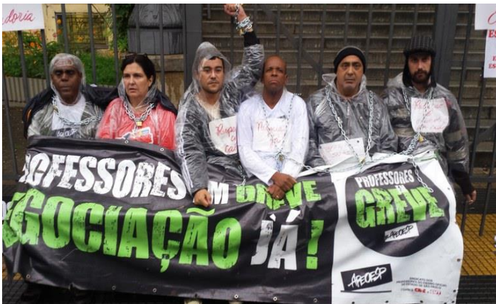
Imagem 14: Professores acorrentados à grade da SEE-SP.

Mesmo que a reunião não tenha resultado em avanços na negociação é importante compartilhar um episódio que ocorreu ao lado de fora da SEE-SP, durante o encontro do sindicato com o secretário de Educação. Um grupo de seis professores grevistas decidiu aguardar o término do diálogo com a SEE-SP acorrentados às grades que cercam o prédio. Conforme o sindicato, a decisão deles se acorrentarem seria uma “resposta à forma desrespeitosa que a categoria vinha sendo tratada” (Idem, ibidem).