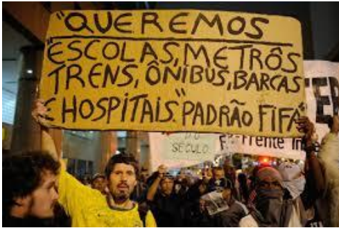
Imagem 23: Jornadas de Junho 2013. Foto da internet