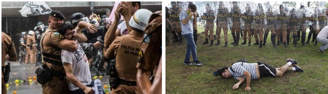
Imagens 18 e 19: Ataques desferidos contra manifestação de professores n Paraná pela tropa de choque. Imagens extraídas da internet. FONTE: imagem extraída da Internet

A atuação da tropa de choque durante a greve, num cenário em que a própria instituição militar não transmite segurança para uma parcela da população, acena para uma autoridade que se legitima pela opressão e intimidação. Difícil dizer se esta instituição perdeu seu crédito para com a população por conta dos seus atos. O concreto é que há uma crise de autoridade e não envolve apenas a polícia militar, mas expande-se para todas as demais instituições da sociedade. Para Certeau: