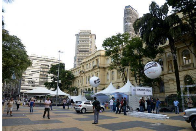
Imagem 2: Acampamento APEOESP

Com o passar do tempo a greve no magistério passa a suscitar opiniões. Foi o que aconteceu com o jornal Folha de São Paulo. Até 25 de março, embora publicasse notícias a respeito do movimento, o periódico não havia exposto de modo claro sua posição quanto a ele. Contudo, no dia 26 de março foi publicado, neste jornal, um artigo de opinião assinado pela equipe editorial, intitulado Desedução pela greve . O título em si já demonstra uma opinião contrária à greve. No texto é mencionado o bônus salarial pago pela Secretaria da Educação, cujo montante foi de um bilhão de reais, aos funcionários de unidades de ensino que conseguiram atingir as metas educacionais estabelecidas pelo governo 9 . Tal fato é seguido pelo posicionamento do jornal sobre a carreira docente, seus vencimentos e a relação da educação para o país. Vejamos o que o texto diz: