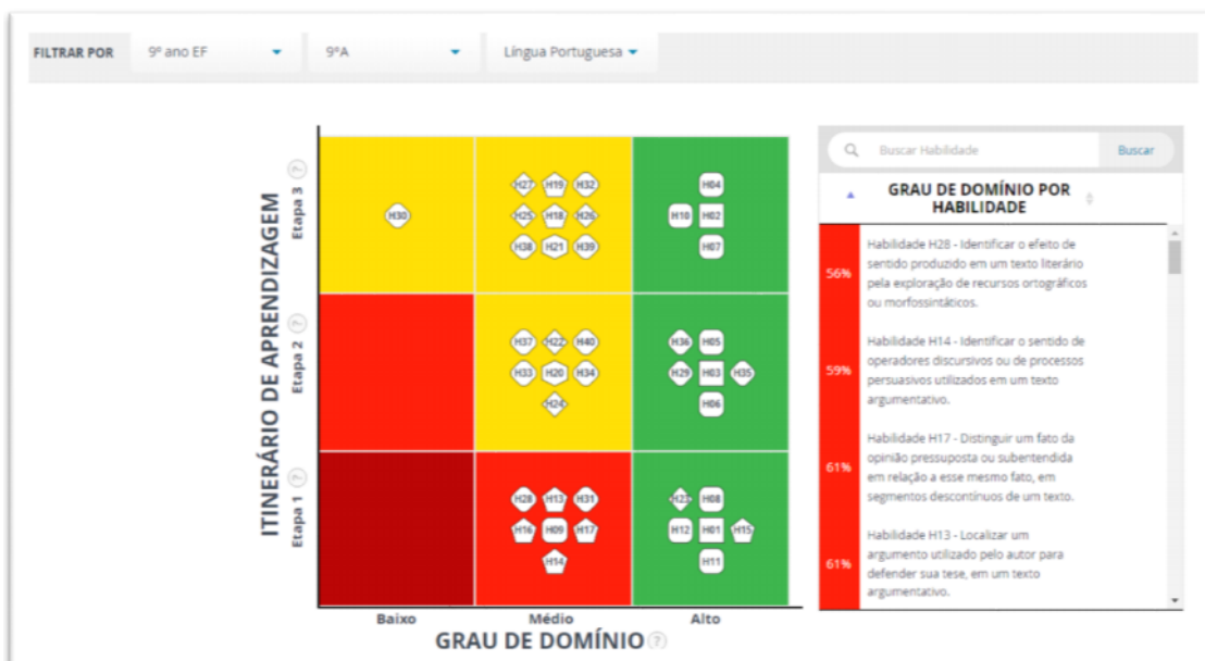
Imagem 27: Extraída do documento “Tutorial foco aprendizado”.

O mapa auxiliaria o professor a criar um plano de intervenção mais apurado e que tivesse como foco a aprendizagem do aluno. O suposto auxílio pedagógico que ele traria aos professores encobre uma nova realidade educacional estruturada a partir de princípios neoliberais. O foco escolar não é mais o conhecimento como algo construído pela humanidade e que tem como finalidade a emancipação do aluno, segundo os moldes humanistas. O foco escolar a partir do neoliberalismo consiste no domínio de habilidades que sejam úteis para tornar o aluno um sujeito empregável. A escola deve propiciar aos estudantes o desenvolvimento dessas habilidades e competências como prioridade, afinal são esses os novos requisitos exigidos pela nova organização mundial do trabalho, sujeitos que garantam sua empregabilidade.