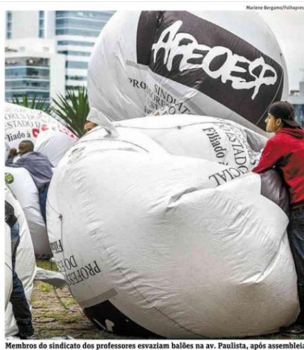
Imagem 16: Balões sendo esvaziados após a decretação do fim da greve.

A imagem apresenta balões infláveis do sindicato Apeoesp, não ao ar e cheios, mas no chão sendo murchos. A simbologia empregada na foto enfatiza não só a mensagem de que professores grevistas e sindicatos perderam o duelo, mas também perderam o duelo acerca da narrativa do evento (idem, ibidem).