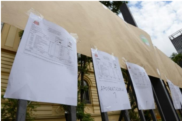
Imagem 8: Holerites fixados no prédio da SEE-SP.

Ao longo da semana o sindicato Apeoesp recebeu mais uma decisão judicial que impossibilitava suas estratégias de conseguir visibilidade ao movimento e, conseqüentemente, pressionar o governo. Desta vez, ela ficou impossibilitada de realizar fechamentos completos ou parciais de rodovias, sob pena de multas no valor de R$100.000,00 (cem mil reais) após a notificação que ocorreu no dia 22/04. Essa decisão judicial mais uma vez serviu para evidenciar a maneira como o governo do Estado de São Paulo buscava minar e impedir sua expansão.