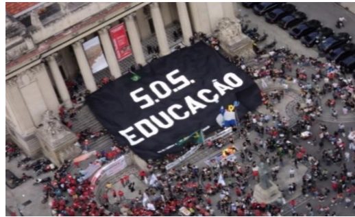
Imagem 24: Contra a PEC 241. Maio 2015.