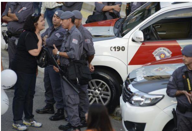
Imagem 12: Tropa de Choque na assembleia de professores ocorrida em 24/04/2015.

As deliberações ocorridas na assembleia foram pela continuidade da greve, pela continuidade do acampamento instalado na Praça da República no início do