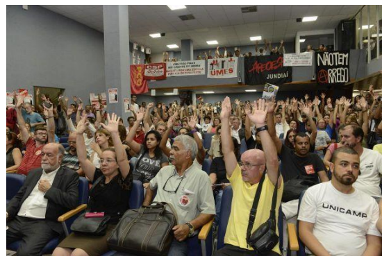
Imagens 3 e 4: Ocupação da ALESP.