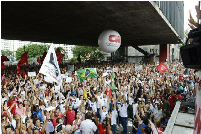
Imagem 6: Assembleia em 17/04/2015.

Após desocuparem a ALESP, no final da tarde do dia 16 de abril, os grevistas voltaram a se reunir na tarde da sexta-feira do dia 17/04 para a realização da sexta assembleia desde a deflagração do movimento, em 13/03/2015. Tal assembleia foi marcada pela presença de 60 mil professores, segundo o sindicato (APEOESP, BI, nº 33, 17/04/2015). Nela foi exposto pela diretoria do sindicato um balanço da ocupação da ALESP, apontado como uma ação importante e “acertada, pois, além de dar visibilidade à greve em razão da grande cobertura da imprensa, conseguimos com que o presidente da Casa, Fernando Capez, se comprometesse em intermediar as negociações” (idem, ibidem).