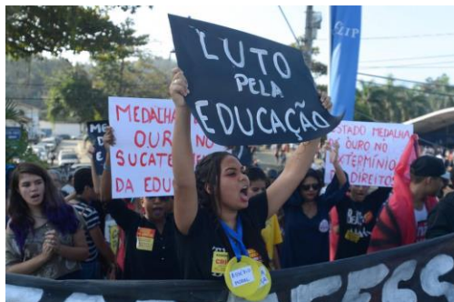
Imagem 25: Ato contra a pec do fim do mundo. Out/2016.