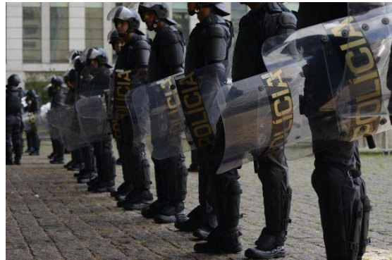
Imagem 11 (acima): Tropa de Choque na assembleia de professores ocorrida em 24/04/2015.