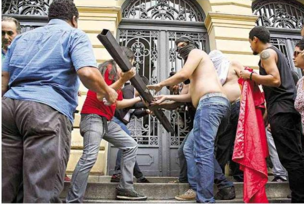
► FORÇA BRUTA Professores em greve tentam invadir a Secretaria Estadual da Educação, no centro de SP, após reunião com o governo acabar sem acordo; manifestantes quebraram vidros e polícia reagiu com bombas de efeito moral Cotidiano C5

greve após quebra-quebra” (JORNAL FSP, COTIDIANO, C5, 24/04/2015). Destaca-se que além do texto, o jornal FSP do dia 24/04 também conta com imagens. Estas também enfatizam a violência. As imagens seguem abaixo: