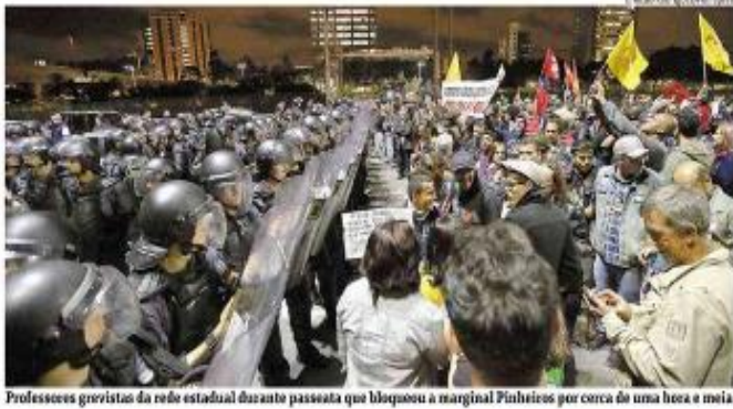
Imagem 13: Tropa de Choque no ato de professores ocorrido em 08/05/2015.