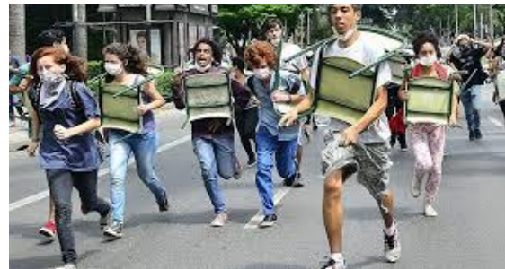
Imagem 26: Estudantes contra reorganização escolar. Nov/2015.

As imagens acima mostram alguns episódios da história recente em que a educação se tornou uma reivindicação. A presença de reivindicações é um dado importante para observarmos o desejo dos cidadãos por melhorias na educação. Não é de forma irrefletida que os políticos do nosso país - em épocas de eleições - exploram em suas campanhas desse lema. Os políticos buscam, segundo Gomes e Setton (2016), criar um marketing político para comover e conquistar eleitores. Nesse sentido, a educação é utilizada como elemento de campanha, pois com certa frequência a população evidencia, seja em manifestações ou mesmo em enquetes, o desejo de ter uma educação pública de qualidade.