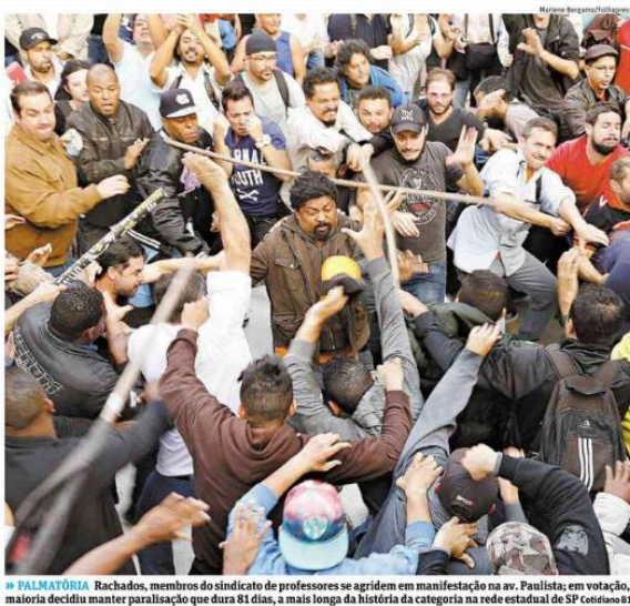
Imagem 15: Atritos entre professores durante a assembleia em 03/06/2015.

Na quarta-feira, dia 03 de junho, mesmo com a ausência de negociações e diante de todas as consequências da greve, 15 mil professores participam da Assembleia. Como as outras, esta ocorreu no Vão Livre do Masp, na cidade de São Paulo. Os professores deliberaram e a maioria aprovou a continuidade. O evento não foi calmo. Segundo noticiado pelo jornal FSP, houve tumultos, troca de socos e um professor foi visto com nariz sangrando (JORNAL FSP, COTIDIANO, B3, 04/06/2015). Para ilustrar o conflito entre os professores o jornal expõe em sua primeira página a foto abaixo.