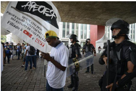
Imagem 10 (acima): Tropa de Choque na assembleia de professores ocorrida em 24/04/2015.

Essas modificações na postura de ambos os lados podem ser visualizadas na assembleia do ocorrida no dia 24/04, uma sexta-feira, no Vão livre do Masp, em São Paulo. O evento contou com 50 mil docentes e não ocorreu no local marcado. A justificativa para isso deve-se ao fato de que o prédio do Masp estaria com problemas estruturais (APEOESP, BI, nº 35, 24/04/2015). Para impedir que professores grevistas se instalassem no local, além de faixas de sinalização havia policiais do batalhão da tropa que se mantiveram em fila no espaço. Por conta desse impedimento, o evento ocorreu nas duas faixas da Avenida Paulista, resultando em multas ao sindicato pelo fato da ação ter bloqueado as duas vias, ou seja, descumpriu uma decisão judicial.