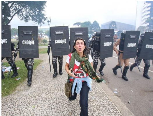
Imagem 17: Professora correndo da tropa de choque paraense em manifestação do dia 29/04/2015.

As fotos abaixo são apenas algumas imagens do transcorrido nesse dia