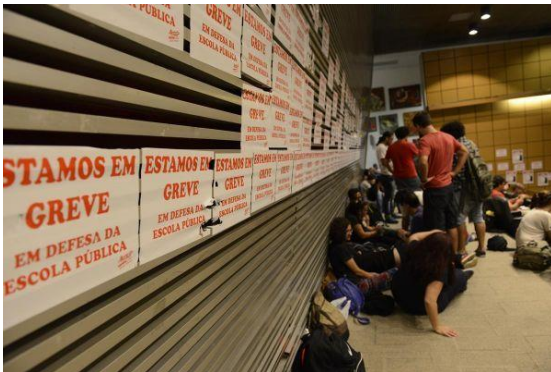
Imagem 5: Acampamento ALESP.

O evento, embora tenha sido uma novidade entre as práticas adotadas por grevistas neste movimento, fora noticiado pela FSP em poucas linhas apenas no dia 17 de abril. O título da matéria é "Greve em SP afeta 12 das 20 melhores escolas no Enem", e o texto enfatiza novamente os prejuízos que alunos tinham por conta da