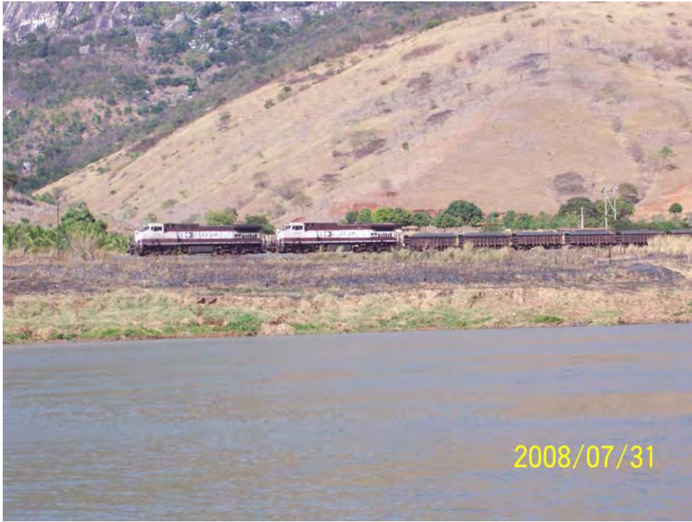
Estrada de Ferro Vitória-Minas