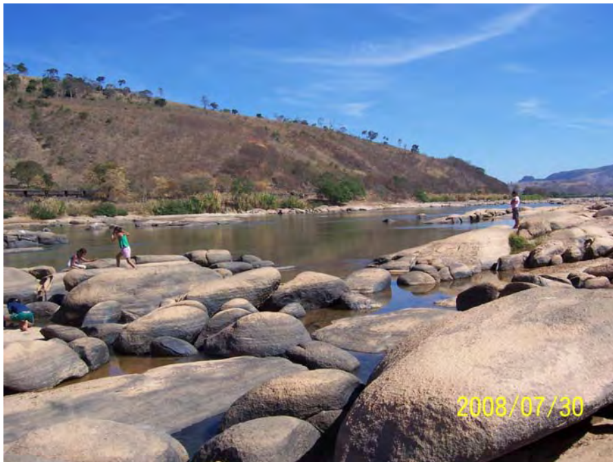
Toda a beleza do Watu!