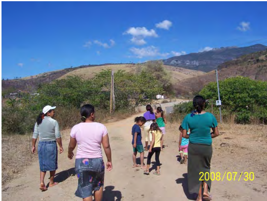
Adultos e crianças nascidas em Vanuíre indo de encontro ao Rio Doce pela 1º vez.