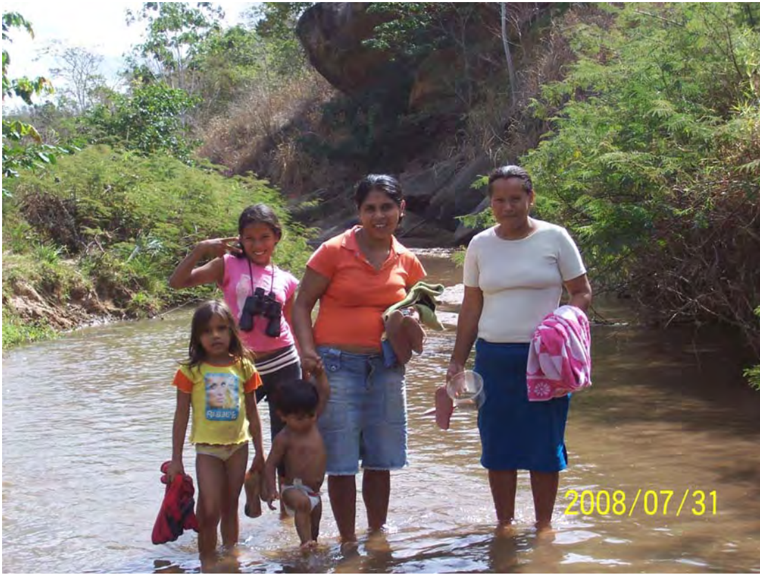
O banho no Rio Eme