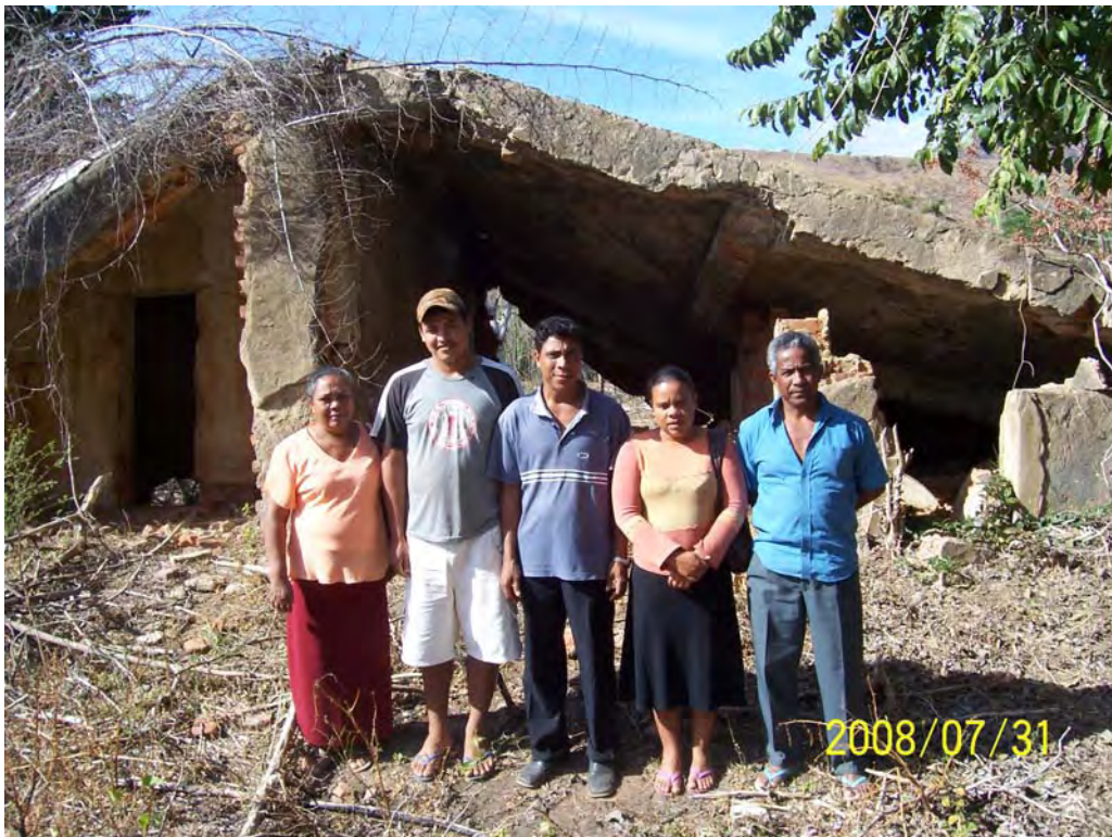
As marcas do passado: ruínas do antigo presídio.