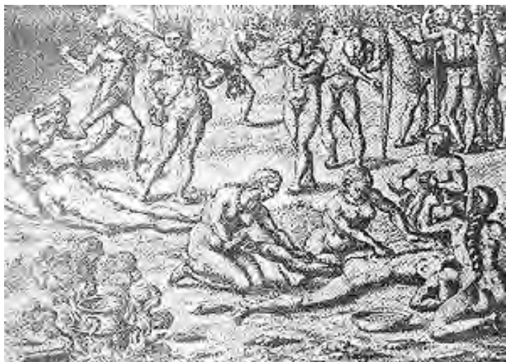
Figura 6: Cena antropofágica: mulheres da tribo retalham o morto (BRY, 1540).

Repugnáva-lhes, antes de tudo, o canibalismo (prática inteligível e assustadora para o missionário), fato que corroborava a visão do ameríndio como ser animalesco, selvagem e monstruoso (Figura 6). Mas inquietava-os, em grande medida, o que consideravam falta de lei, ausência de interdições quanto à exibição do corpo e às relações sexuais.