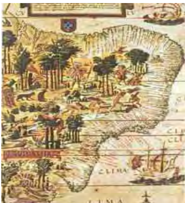
Figura 1: Mapa do Brasil no século XVI (WIKIPÉDIA, 2009).

Enquanto D. João III nomeia a Tomé de Souza primeiro Governador Geral do Brasil, o Provincial de Portugal, Simão Rodrigues, nomeia o Pe. Manuel da Nóbrega para fundar a nova Missão além-mar. A 29 de março de 1549 chegam a Bahia (Figura 1) onde se instala a sede do Governo Geral (FERREIRA, 1957). Curioso, porém, é a nomeação de Nóbrega para esta missão evangelizadora, pois quem recebera licença de D. João para desembarcar em solo brasileiro, e lá permanecer por três anos, foi o Ir. Simão Rodrigues (FERREIRA, 1957; LEITE, 1955b).