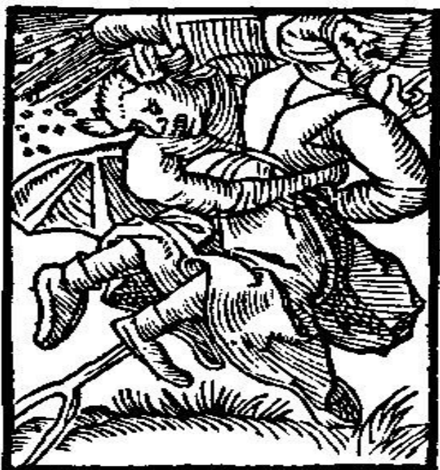
Figura 3: Uma feiticeira e seu demônio cavalcando um fálico cabo de vassoura rumo a um sabá (MOLITOR, 1549).

Mesmo falando em século XVI, Michel Foucault (1988, 2007, 2008) é mais do que pertinente em nossa análise já que ao se preocupar com o corpo visa compreender como o poder influencia e é exercido nos microespaços pelos indivíduos e pelos diversos grupos de uma sociedade. Assim, estudar o controle e o processo de normatização das condutas, atitudes e comportamentos das índias, traduz-se em Foucault numa análise apaixonada e cabível, mas que desencanta a sociedade deste período.