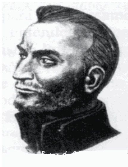
Figura 2: Busto do Pe. Manuel da Nóbrega (BAIRRO DO CATETE, 2009).

Como os episódios dos concursos não levaram Nóbrega ao êxito da fala, desenganou-se. E como diria ainda Franco ( apud LEITE, 1955b, p. 29) “Vendo que o mundo o desprezava, fez propósito de o desprezar a ele”. Circunstâncias da vida, o fato é que se ficasse em primeiro lugar seria Nóbrega professor universitário e não “professor” de mais alto magistério, a imensa Universidade das Almas, como Vieira chamaria mais tarde as selvas do Brasil (LEITE, 1938).