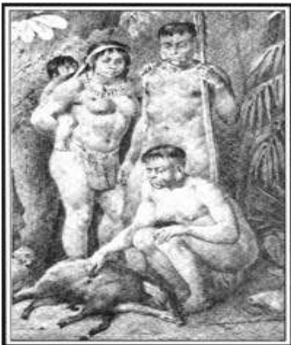
Figura 8: família de índios botocudos (FAYET, 2006).

Os habitantes nus do Brasil quinhentista (Figura 8) causaram profundo desalento ao Pe. Manuel da Nóbrega que tudo fez para vesti-los desde que chegou à Bahia: quis dar a roupa sobressalente dos padres para os índios batizados; pediu roupas ao Pe. Simão Rodrigues; considerou a possibilidade de os próprios índios fiarem o algodão de seus vestidos; e incluiu essa medida no plano geral de aldeamento de 1558.