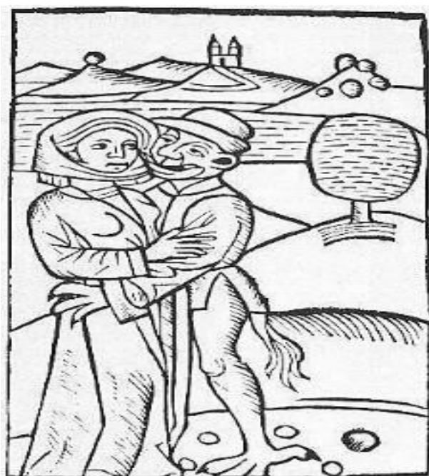
Figura 7: O diabo que faz amor com a bruxa. (MOLITOR, 1489).

Acreditava-se, como mencionado anteriormente, que a mulher tinha ligações íntimas não com Deus, mas com o diabo (Figura 7) – travestido no corpo de uma serpente, por exemplo -, sendo considerada um ser terreno tirado da costela de Adão e motivo da perdição deste e da sua expulsão do paraíso.