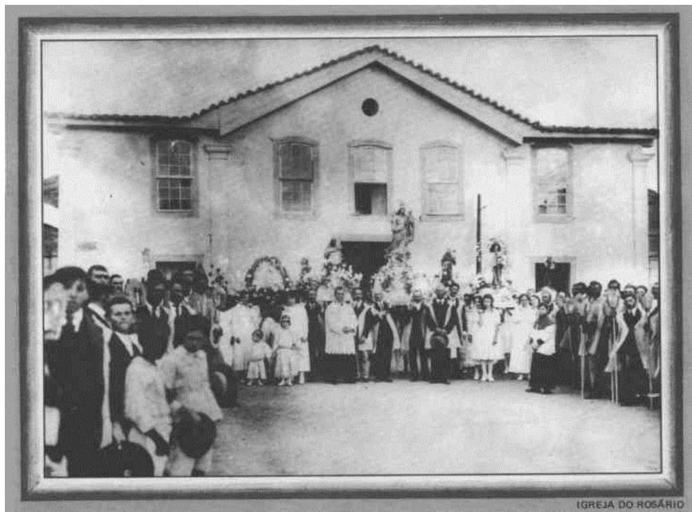
Figura 2 - Igreja Nossa Senhora do Rosário, Jundiáí, 1922.