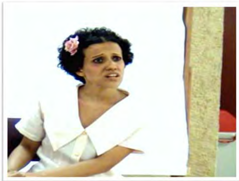
Figura 2: Branca