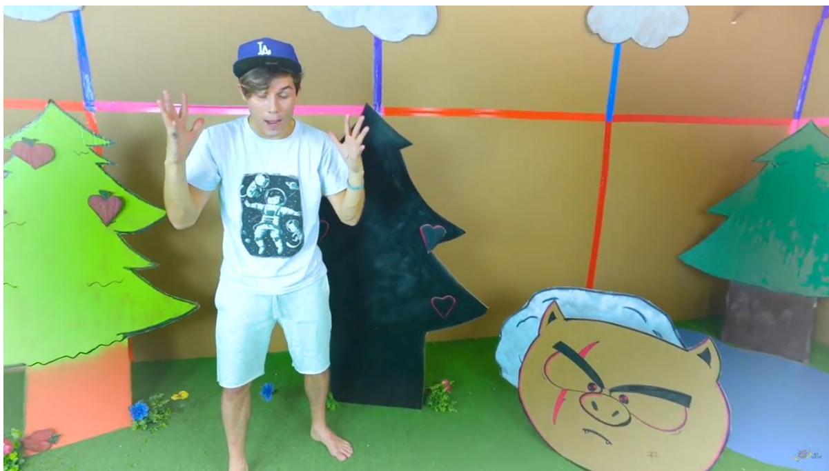
Figura 5 - Cenários de papelão - Gato Galáctico

gráfica. Todo o cenário e os personagens fantásticos são feitos de papelão. Esta proposta aposta na adesão do público às justificativas narrativas, ou seja, na suspensão da descrença.