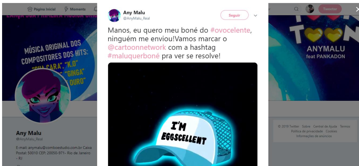
Figura 3 -Tweet de Malu reivindicando o boné.